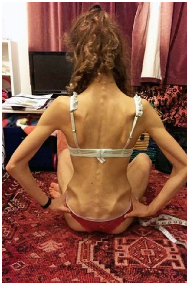
Slika 4: Balerina 18. g, oboljela od anoreksije