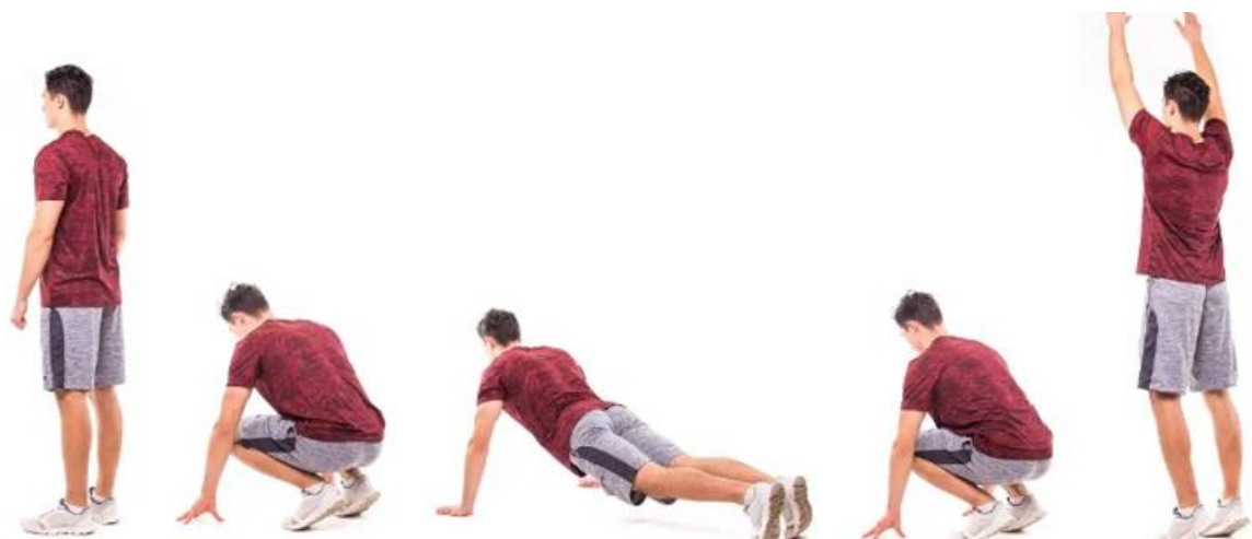
Slika 15 Burpees

Kao i preskakanje užeta, burpees je pliometrijska vježba. Pomažu razviti eksplozivnu snagu dok istovremeno jačaju gotovo svaki glavni mišić u vašem tijelu. Burpees trenira eksplozivnost istovremeno angažirajući ramena, bicepse i tricepse. To je vježba za cijelo tijelo koja brzo ubrzava otkucaje srca i pomaže u izgradnji izdržljivosti i kardiovaskularne snage. Bez sumnje, to je jedna od najvažnijih vježbi snage i kondicije za boks.