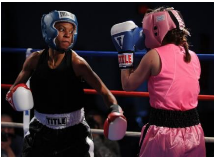
Slika 2 Ženski amaterski boks

Unutar ženskog amaterskog boksa težinske kategorije su: muha ne više od 48 kg, bantam do 51 kg, pero laka do 54 kg, laka do 57 kg, poluvelter do 60 kg, velter do 64 kg, srednja kategorija do 69 kg, poluteška do 75 kg, teška kategorija do 81 kg i superteškaš, svaka težina iznad 81 kg. (Morton. i sur., 2010) Ženski olimpijski boks ograničen je na samo tri težinske kategorije: muha od 48 do 51 kg, lagana od 56 do 60 kg i srednja težina od 69 do 75 kg (Langan-Evans, 2011)