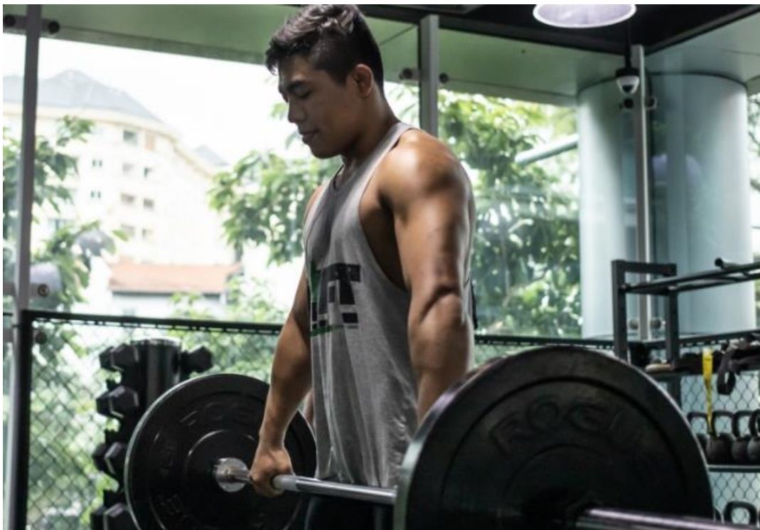
Slika 11 Mrtvo dizanje

Mrtvo dizanje je neophodno za svaki program snage i kondicije. Ono je uobičajeno u bodybuilding rutinama za razvoj snage i donjeg dijela leđa. Oni također aktiviraju gluteuse i tetive koljena, a svaka vježba koja se fokusira na glavnu mišićnu skupinu izvrsna je za boks. Kada se radi mrtvo dizanje, potrebno je staviti naglasak na pravilnu formu