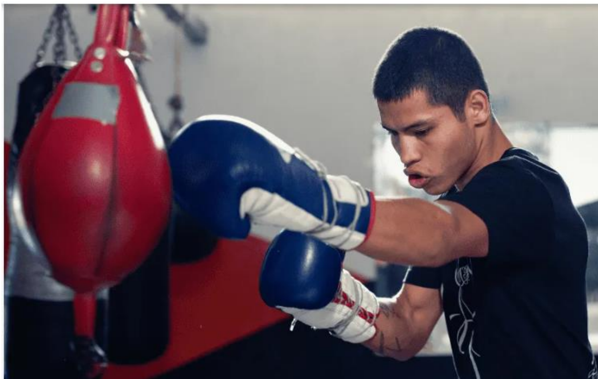
Slika 7 Dvostruka vreća

Dvostruka vreća alat je jedinstven za boksače i jedna je od najboljih vježbi za treniranje koordinacije i, prije svega, točnosti udarca. Dvostruka vreća spojena je s podom i stropom i kreće se bjesomučnom brzinom pa ju je lako promašiti. Manja meta ne dopušta snažne udarce, ali čini čuda za točnost i koordinaciju.