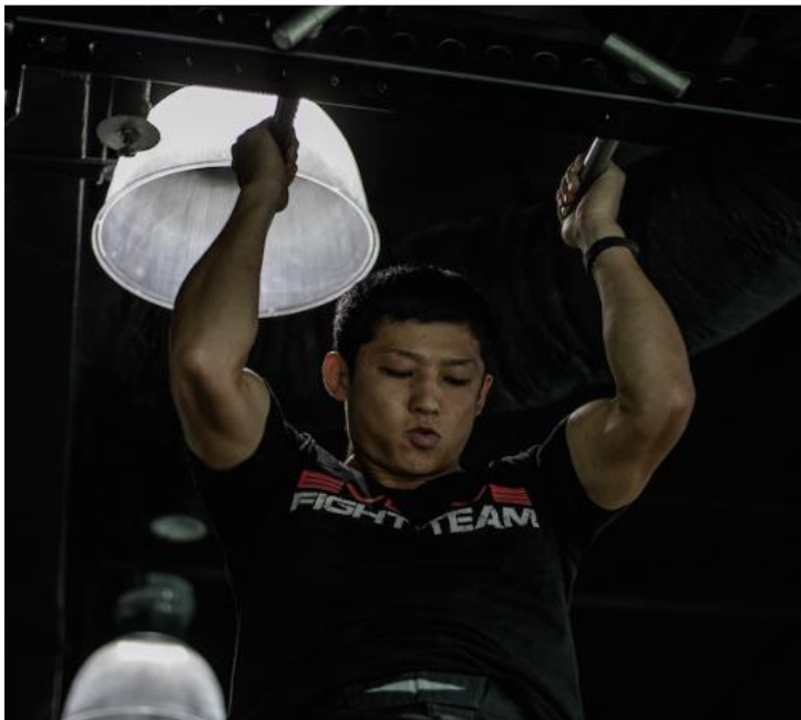
Slika 10 Zgibovi

Zgibovi su izvrsni za izgradnju ukupne snage. Zgibovi također pomažu razviti snagu gornjeg dijela tijela, a istovremeno stimuliraju gornji dio leđa . Ovo je bitno za pokret povlačenja, poput onog koji se koristi u raznim situacijama klinča u boksu.