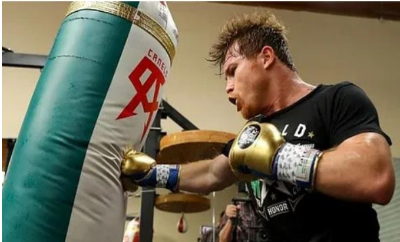
Slika 9 Teška vreća