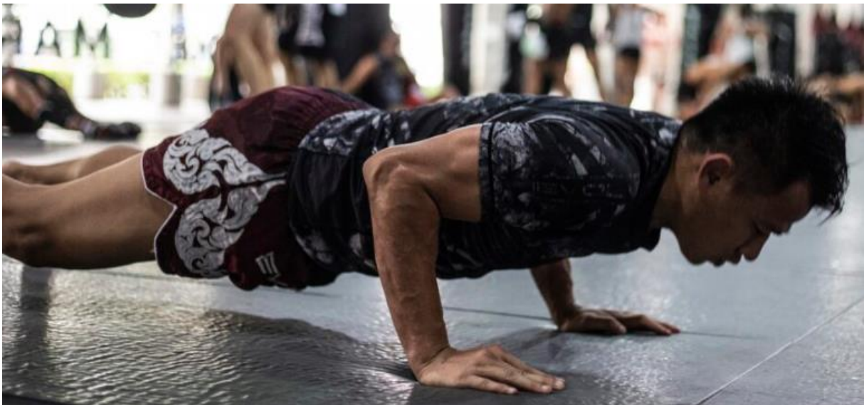
Slika 16 Sklekovi

Sklekovi su savršena vježba za izgradnju snage za borilačke vještine. Sklekovi se mogu činiti vrlo osnovnim, ali oni ovise o snazi i kondiciji. Poput burpeesa, što ste u većoj formi, to više sklekova možete izvesti. S velikim naglaskom na ramenima, prsima i rukama, sklekovi su nevjerovatni za boks. Oni grade izdržljivost u rukama, što je važno u bilo kojoj udarnoj borilačkoj vještini, omogućujući boksaču da zada veći volumen udaraca, tj. nokaut.