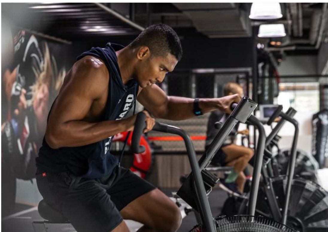
Slika 13 HIIT trening