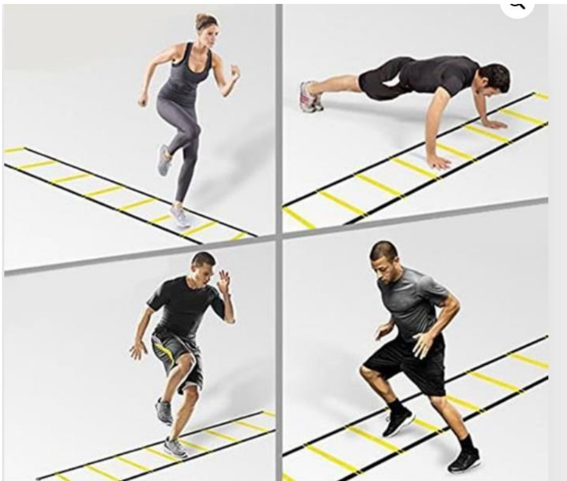
Slika 17 Ljestve agilnosti