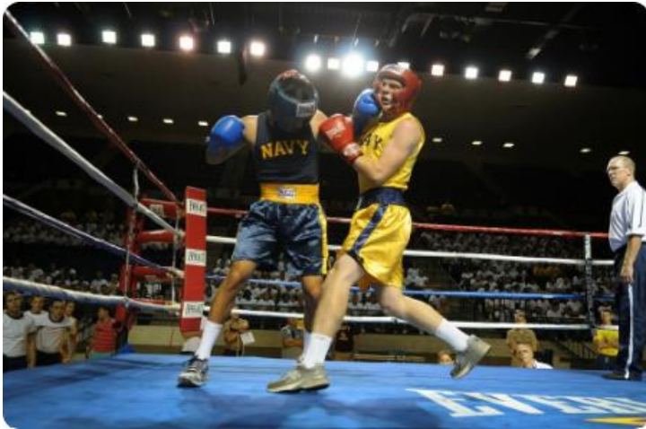
Slika 1 Muški amaterski boks

laka do 60 kg, poluvelter do 64 kg, velter do 69 kg, srednja kategorija do 75 kg, poluteška do 81 kg, teška kategorija do 91 kg i superteškaša, svaka težina iznad 91 kg (Langan-Evans, 2011).