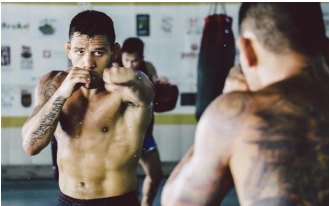
Slika 14 Boksanje u sjeni