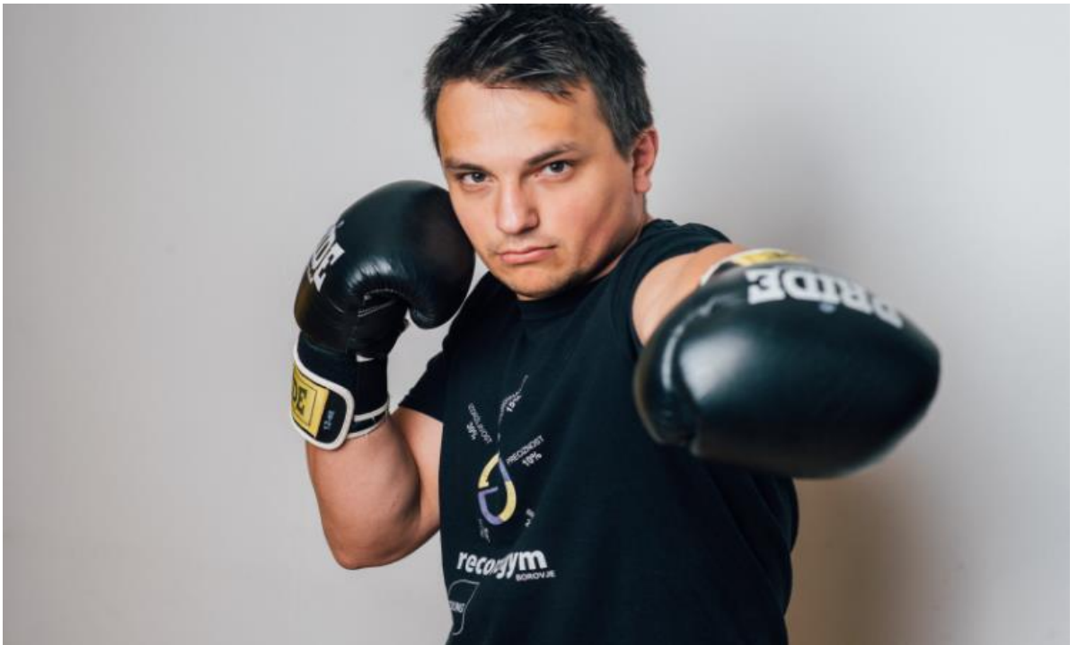
Slika 4 Direktni udarac u boksu- direkt