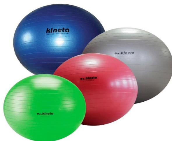
Sl. br. 11: Pilates lopte za vježbanje