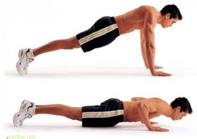
Sl. br. 5: Vježba za razvoj prsnih mišića

Agonisti: m. pectoralis major(steralni dio)