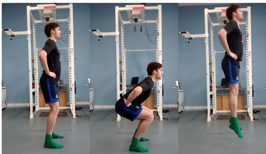
Slika 4. Prikaz izvođenja CMJ – skoka s pripremom