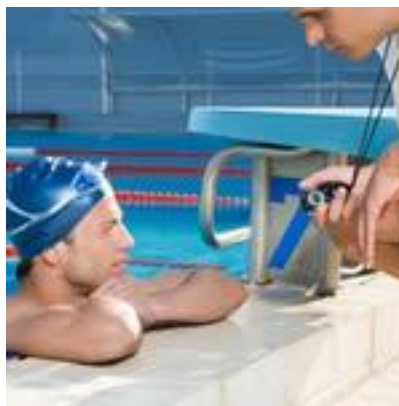
Slika 2. Prikaz mjerenja brzine plivanja na treningu ručnom „štopericom“