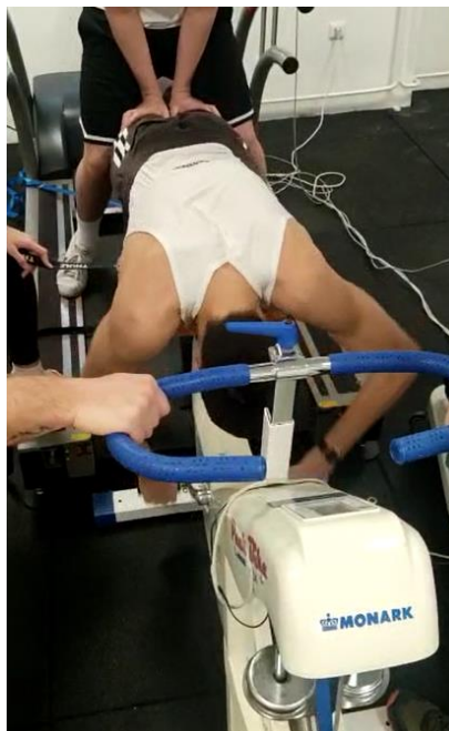
Slika 3. Prikaz izvedbe Wingate Arm Crank testa

ispitanika na zadržavanje rada kroz 30 sekundi. Zadatak je tih 30 sekundi maksimalno brzo izvoditi okretaje rukama tj. pedalama koje imitiraju zaveslaj u vodi, uz borbu s varijabilnim otporom. Parametri dobiveni Wingate arm crank testom su: anaerobni kapacitet (količina energije koja se dobiva iz anaerobnih energetske sustava, koji se koriste kod primjenjivanja znatne sile za obavljanje zadataka visokog intenziteta), PP (peak power) - maksimalna proizvedena sila za vrijeme kontinuiranog rada (pražnjenje rezervi dovodi do nakupljanja mliječne kiseline), a još ju nazivamo i anaerobnom snagom, AP (average power) – prosječna vrijednost snage, MP (minimum power) - minimalna vrijednost snage, PD (power drop) – opadanje u snazi. Opterećenje se postavljalo ovisno o tjelesnoj masi ispitanika, tj. za ispitanike muškog spola na 0,075 \text{ kg} \times \text{kg}^{-1} \text{ BM} (tjelesne mase). Detaljan postupak i validacija testa prikazani su u radu Konstrukcija i validacija ručnog Wingate testa za procjenu anaerobnih sposobnosti vaterpolo juniora (Vrdoljak, Kadić, Uljević, 2022).