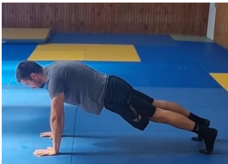
Slika 52. Plank opruženim rukama

Izdržaj u uporu prednjem. Oslonac tijela je na dlanovima i nožnim prstima. Leđa su blago savijena kako bi se dodatno povećala aktivacija trupa. Ovu vježbu raditi 1 minutu.