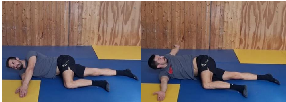
Slika 65. Rotacija trupa i ruke iz ležećeg stava

Početni položaj je ležeći na boku s rukama ispred tijela u visini ramena, donja noga je opružena u produžetku tijela, a gornja noga je u savijena u zglobu kuka i koljena pod kutom od 90°. Kao i kod prethodne vježbe radi se rotacija trupom i gornjom rukom dok ostatak tijela ostaje u početnom položaju. Ovu vježbu ponoviti 10 puta svaka strana.