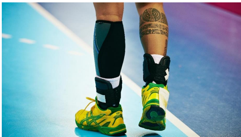
Slika 71. Rukometna oprema