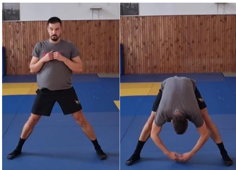
Slika 8. Pretklon u raskoračnom stavu