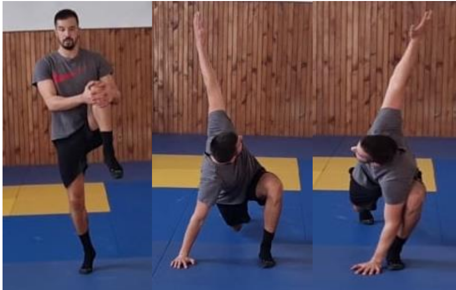
Slika 9. Iskorak s otklonom tijela

Iz početnog raskoračnog stava radimo fleksiju u zglobu kuka, te pomoću ruku natkoljenicu povlačimo na prsa te se zatim radimo iskorak prema naprijed i postavljamo ruku pored prednje noge. Nakon toga činimo otklon tijela prvo u jednu stranu nakon toga zamijenimo ruke i radimo otklon tijela u drugu stranu. Ponovno zauzimamo početni položaj i ponavljamo ovu vježbu s drugom nogom. Vježbu radimo u kretanju do ponovnog povratka na početnu liniju. Cilj ove vježbe je povećati opseg pokreta u zglobu kuka i torakalnog dijela kralježnice.