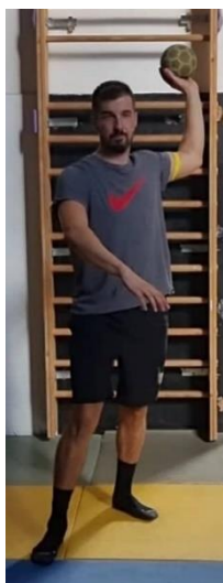
Slika 32. Jednoručno dodavanje uz otpor gumom na nadlaktici

Gumu s otporom zakačiti na nadlakticu dominantne ruke, zatim napraviti 3 koraka naprijed i dodati loptu suigraču koji se nalazi nasuprot. Ovu vježbu izvoditi maksimalnom brzinom kako bi otpor bio optimalan. Ovom vježbom jačaju se rotatori ramena i poboljšava se kontrola dodavanja i šutiranja zbog direktnog ometanja na dominantnu ruku igrača koji dodaje loptu. Vježbu ponoviti 10 puta.