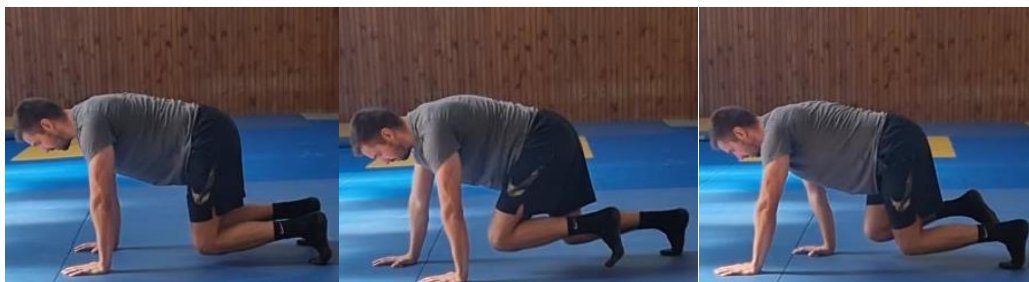
Slika 58. Bird - dog

Iz klečećeg stava s rukama u projekciji ramena sportaš koljena podiže blago od poda te aktivacijom trbušnih mišića radi izdržaj u toj poziciji. Vježba u kretanju se izvodi radeći male korake prema naprijed sinkroniziranim pokretima noge i suprotne ruke. Cilj ove vježbe je aktivirati mišiće cijelog tijela a posebno mišiće trupa.