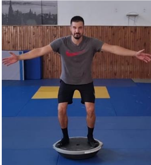
Slika 17. Sunožni stav na balans ploči

Iz sunožnog stava na podu, zauzima se sunožni stav na balans ploči te kad je balans savladan spušta se u blagi polučučanj. Održavanje balansa u polučučnju izvodi se u trajanju od 30 sekundi. Cilj ove vježbe je savladati balans na nestabilnoj podlozi.