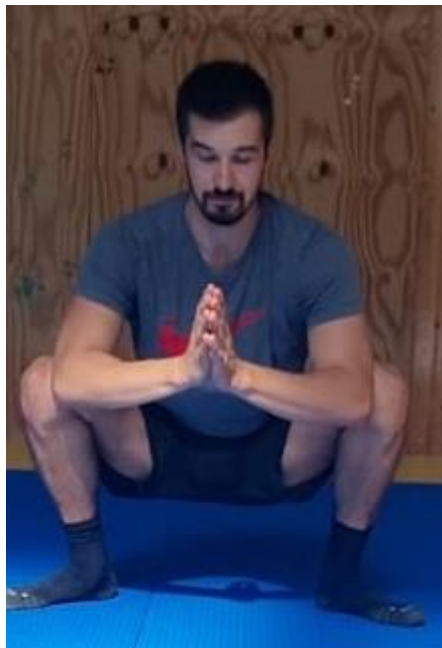
Slika 67. Duboki čučanj

Iz raskoračnog stava zauzimanje pozicije dubokog čučnja te laktovima guranje koljena prema van kako napravili što veću kretnju u zglobu kuka. Zadržati poziciju čučnja 30 sekundi. Cilj ove vježbe je poboljšati mobilnost zgloba kuka i gležnja.