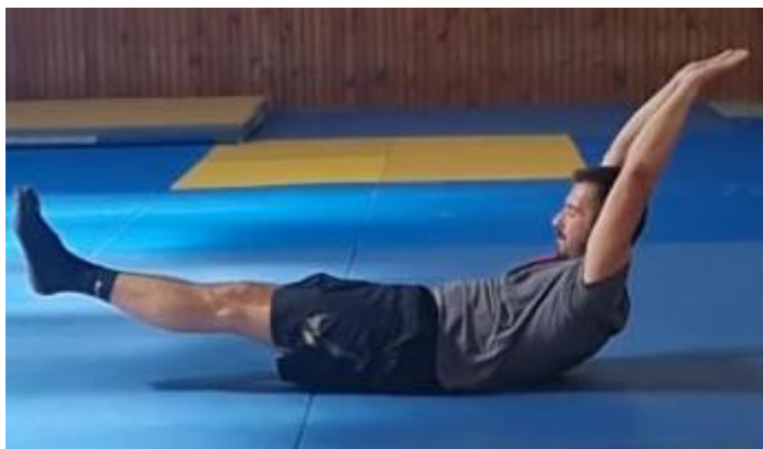
Slika 57. Sklopka izdržaj

Iz početnog ležećeg stava s rukama u uzručenju na znak trenera noge, ruke i trup se odvajaju od poda a oslonac ostaje na m.gluteus. Izometričnom kontrakcijom trbušnih mišića zadržati taj položaj. Ovu vježbu raditi 45 sekundi.