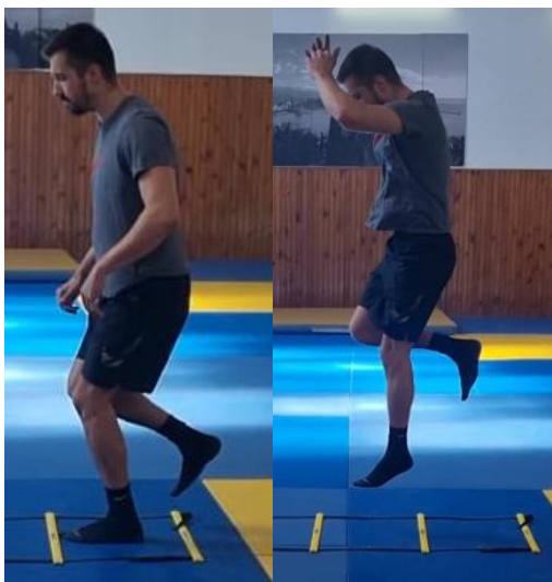
Slika 40. Jednonožni skokovi preko podnih ljestvi

Iz sunožnog stava zauzimanje jednonožnog stava, te skokovi prema naprijed. Rade se eksplozivni skokovi tako da svakim skokom se doskoči u naredno polje i tako do kraj ljestvi. Nakon toga ponoviti sve suprotnom nogom. Ovu vježbu ponoviti 3 puta svaka noga. Cilj ove vježbe je razviti eksplozivnu snagu gležnja te poboljšati koordinaciju manipulirajući svojim tijelom skokovima na jednoj nozi.