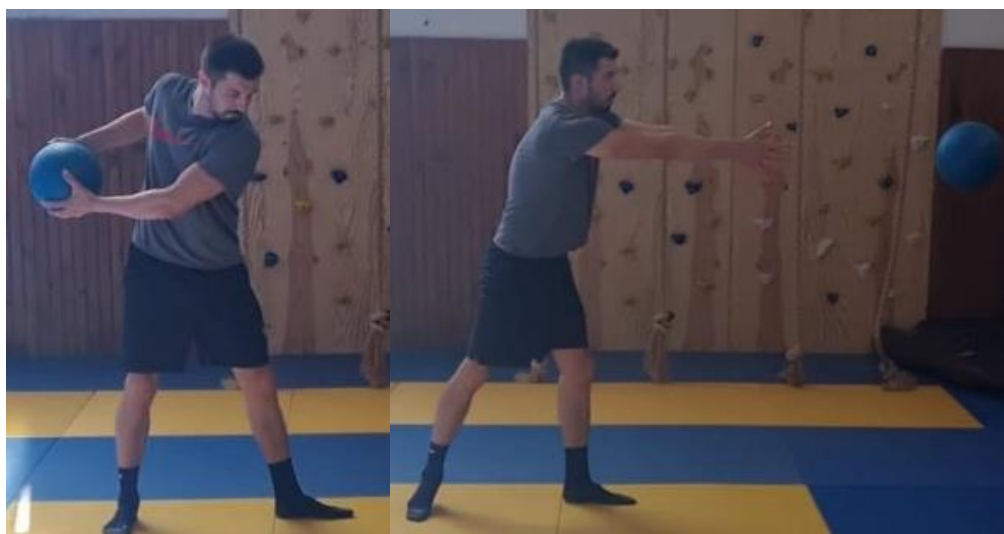
Slika 38. Udarac medicinkom o zid s obje ruke bočno

Početna pozicija je raskoračni stav držeći medicinku s dvije ruke u visini kukova na udaljenosti 3 metra od zida. Zatim slijedi korak jednom nogom prema naprijed uz