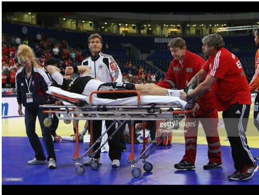
Slika 2. Ozljeda prilikom rukometne utakmice