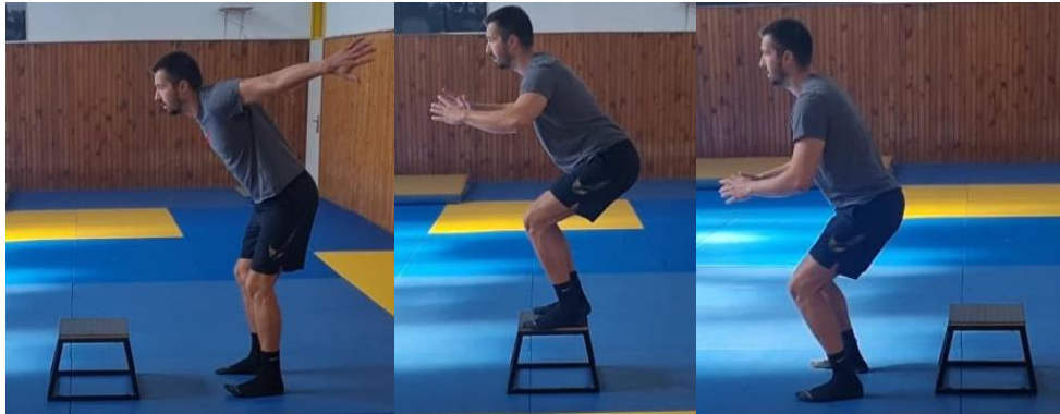
Slika 43. Sunožni skok na klupicu i saskok

Iz početnog sunožnog stava odraz dvjema nogama na klupicu te amortizacija doskoka i zatim slijedi saskok ispred klupice. Ponovno se okrenuti licem prema klupici i ponoviti ovu vježbu 10 puta. Cilj ove vježbe je razvoj eksplozivnost i jakost donjih ekstremiteta.