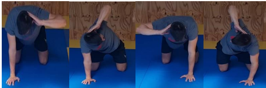
Slika 66. Iz četveronožnog položaja rotacija trupom

Početna pozicija je četveronožni stav s trupom paralelnim s podom. Jednu ruku saviti u laktu te dlan te ruke postaviti iza glave te napraviti vanjsku rotaciju trupom. Ovu vježbu ponoviti 10 puta svaka ruka. Cilj ove vježbe je povećati mobilnost torakalnog dijela kralježnice.