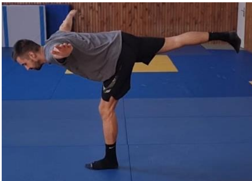
Slika 16. Vaga

Iz sunožnog raskoračnog stava zauzima se položaj vage tako da tijelo ostaje s osloncem na jednoj nozi dok trup ide u pretklon dok druga noga prati kretnju gornjeg dijela tijela