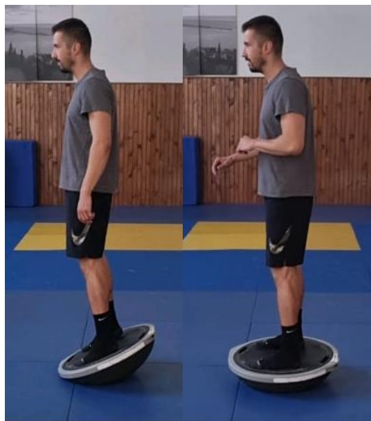
Slika 18. Na balans ploči kretnja prsti – peta