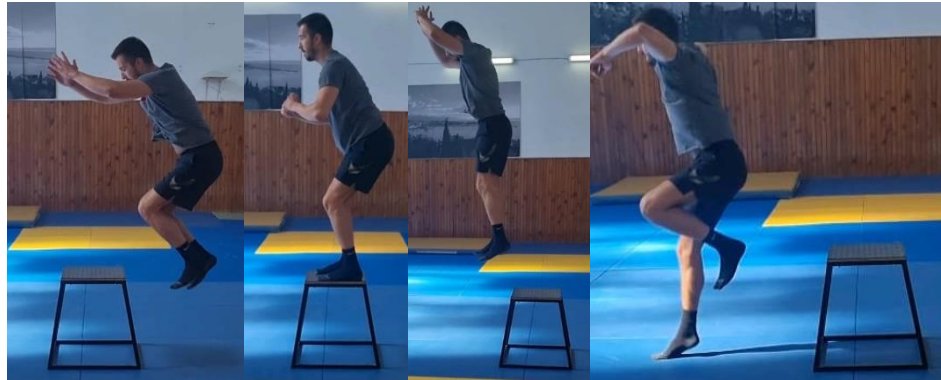
Slika 47. Skok na klupicu i jednonožni saskok

Iz sunožnog raskoračnog stava izvesti skok na kutiju uz upotrebu ruku, a nakon amortizacije doskoka jednonožno saskočiti s klupice te amortizirati doskok. Ovu vježbu ponoviti 5 puta svaka noga. Cilj ove vježbe je razviti koordinaciju i kontrolu jednonožnih doskoka kako bi tijelo bilo spremno za vrijeme rukometne igre uspješno izvesti navedene radnje.