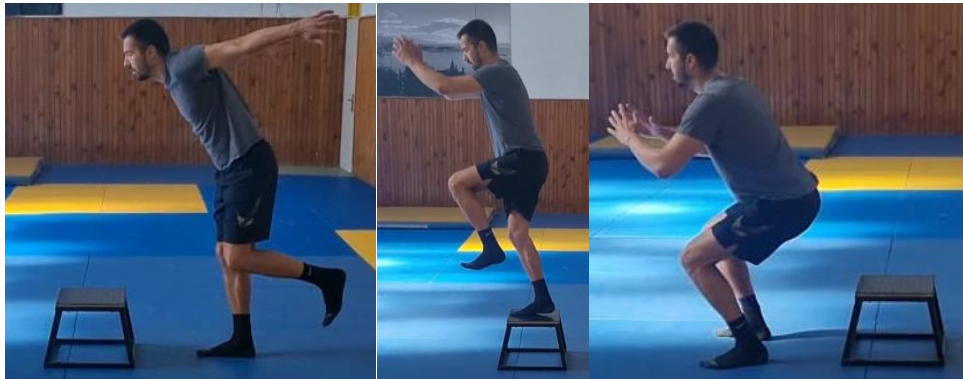
Slika 44. Jednonožni skok na klupicu i jednonožni saskok

Iz jednonožnog početnog stava skok na klupicu i jednonožna amortizacija doskoka, te zatim sunožni doskok s klupice. Ovu vježbu ponoviti 8 puta s svakom nogom. Cilj ove vježbe je razvoj koordinacije i kontrole jednonožnih skokova kao i razvoj eksplozivne snage i jakosti donjih ekstremiteta.