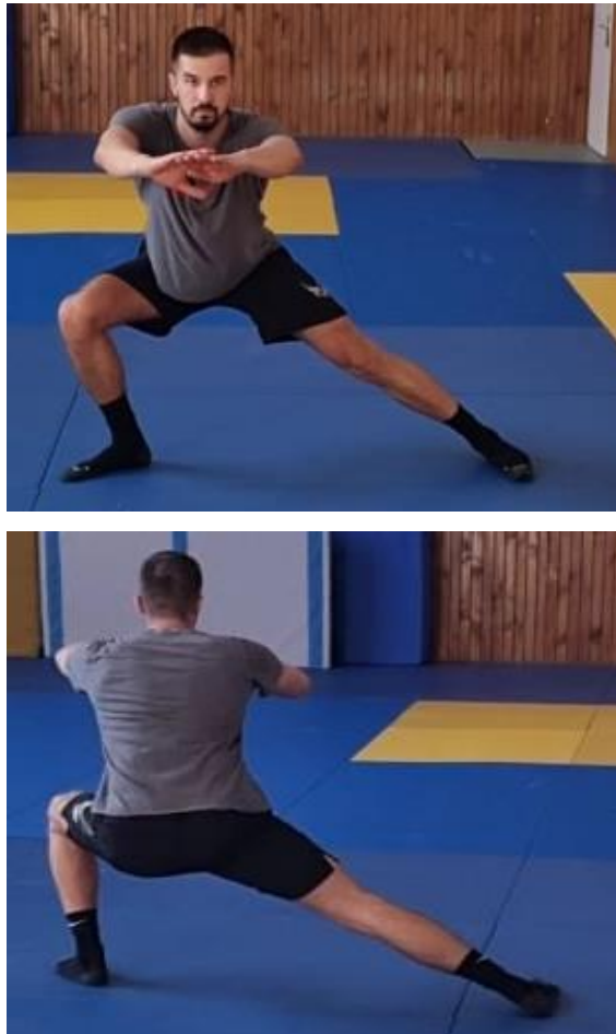
Slika 10. Bočni iskorak

Iz bočnog raskoračnog stava radimo iskorak u jednu stranu, zatim se podižemo u početni položaj, okrećemo se za 180% oko svoje osi te radimo bočni iskorak s drugom nogom. Ovu kretnju ponavljamo naizmjenično lijeva desna strana do ponovnog povratka na početnu liniju. Cilj ove vježbe je povećati raspon pokreta u zglobu kuka i aktivirati mišiće natkoljenice.