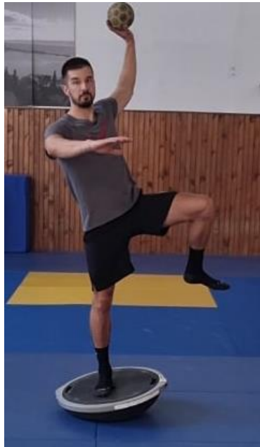
Slika 24. Jednoručno dodavanje s jedne noge na balans ploči

Igrači se nalaze u sunožnom stavu te prilikom dodavanja lopte zauzimaju jednonožni stav te dominantnom rukom dodaju loptu suigraču. Cilj ove vježbe je imitirati standardno dodavanje iz rukometa ali je otežano na način da igrači nemaju stabilnu plohu ispod nogu te moraju kontrolirati svoje tijelo prilikom dodavanja kako bi bili spremni za dodavanja iz raznih pozicija koje ih očekuju za vrijeme utakmice.