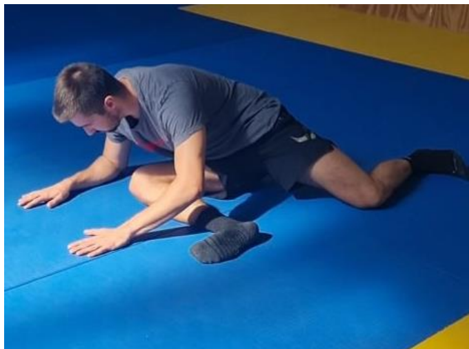
Slika 68. Sjedeći položaj 90° - 90°

Iz sjedećeg položaja prednju nogu postaviti pod kutom od 90° između natkoljenice i potkoljenice, a stražnju nogu također postaviti pod kutom od 90°. Trup gurati prema naprijed i dole dok oslonac ne bude na podlakticama. Cilj ove vježbe je povećati