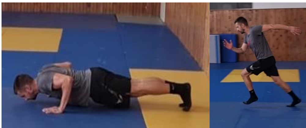
Slika 14. Sklek + sprint