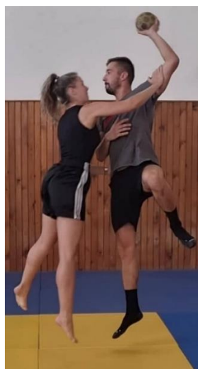
Slika 36. Skok šut uz kontakt obrambenog igrača