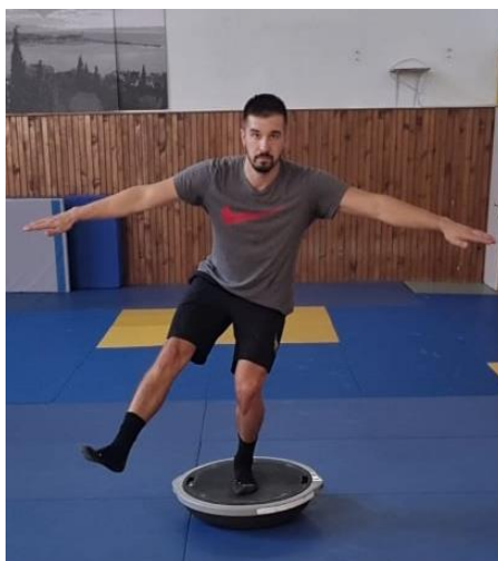
Slika 20. Jednonožni stav na balans ploči

Iz sunožnog stava zauzimanje jednonožnog stava na balans ploči te zatim spuštanje u polučučanj. Cilj ove vježbe je osposobiti tijelo za kontrolu i jakost mišića nogu ukoliko samo jedna noga preuzima teret ostatka tijela. Laganija izvedba ove vježbe bila bi zauzimanje jednonožnog stava bez polučučnja, dok naprednija vježba je spuštanje u duboki jednonožni čučanj. Ova vježba izvodi se 10 puta jedna noga, zatim promjena nogu i ponoviti 10 puta.