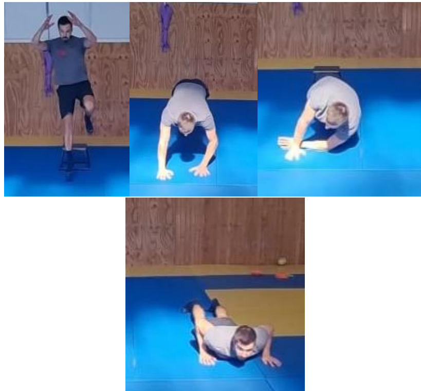
Slika 50. Prizemljenje rolanjem

Prizemljenje rolanjem najčešće se koristi prilikom amortizacije padova prema naprijed i u stranu. Igrač je ispružen prema naprijed te pad amortizira lagano pogrčenim rukama u laktu i otvorenim dlanovima, te jednu ruku podvlači ispod trupa i radi rotaciju preko ramena ruke koja se nalazi ispod tijela do dolaska u poziciju skleka.