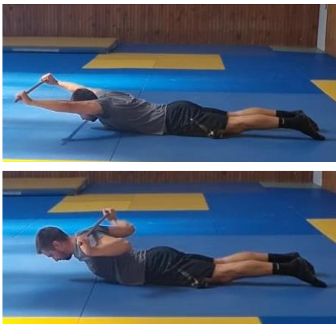
Slika 63. Povlačenje štapa iza glave

Početni položaj je ležeći na prsima s rukama u uzručenju čvrsto primiti štap s obje ruke. Povlačenje štapa iza glave do stražnjeg dijela ramena te povratak u početnu poziciju. Cilj ove vježbe je povećati raspon pokreta stražnjeg dijela ramena. Ovu vježbu ponoviti 10 puta.