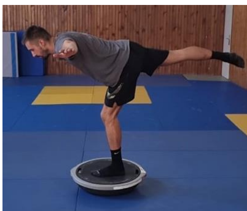
Slika 21. Vaga na balans ploči

Iz sunožnog stava na balans ploči zauzimanje jednonožnog stava te zatim trup ide u pretklon dok noga prati kretanju gornjeg dijela tijela dok trup i noga ne budu paralelni s podlogom. Ruke su u odručenju zbog održavanja balansa. Vježba se ponavlja 10 puta