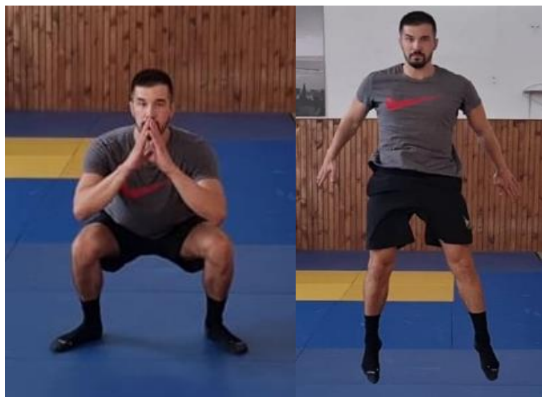
Slika 7. Čučanj - skok

Iz laganog trčanja prema naprijed na znak trenera radimo čučanj te eksplozivni sunožni odraz prema gore. Nakon amortizacije doskoka nastavljamo trčati prema naprijed i na ponovni znak ponavljamo čučanj – skok. Ovo je kompleksna vježba u kojoj imamo za cilj podignuti radnu temperaturu tijela i dodatno zagrijati zglob kuka, koljena i gležnja.