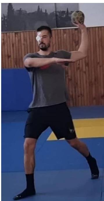
Slika 33. Jednoručno dodavanje uz zaklopljeno oko