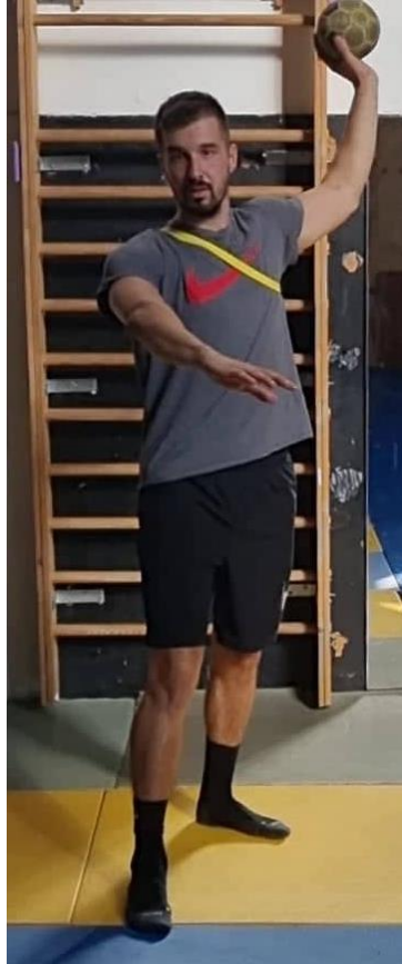
Slika 31. Jednoručno dodavanje uz otpor gumom oko prsnog koša

U početnoj poziciji gumu s otporom zakačiti oko prsnog koša, te zatim napraviti 3 koraka prema naprijed i izvršiti rukometno dodavanje dominantnom rukom i zatim povratak u početnu poziciju. Kretnje naprijed natrag izvoditi punom snagom kako bi otpor gume bio povećan i samim tim otežavao kontrolu dodavanja lopte. Cilj ove vježbe je onemogućiti tijelu idealnu poziciju za dodavanje, a da pri tom efikasnost ostaje maksimalna.