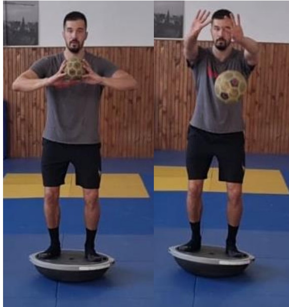
Slika 22. Dodavanje loptom na balans ploči

Iz raskoračnog stava na balans ploči dodavanje rukometnom loptom s prsa. Igrači se nalaze u parovima tako da su postavljeni jedan nasuprot drugog na udaljenosti od 5m. Loptu dodaju s prsa s dvije poput košarkaškog dodavanja. Za svo vrijeme vježbe potrebno je održavati balans na ploči.