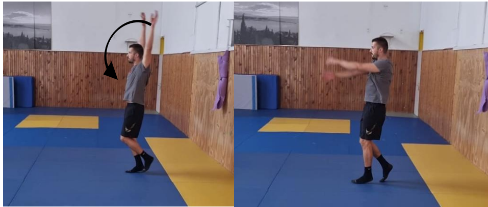
Slika 4. Kruženje rukama prema naprijed

Početni položaj je raskoračni stav, te krećemo u lagano trčanje prema naprijed a s opruženim rukama u laktu kružimo prema naprijed s kretnjom iz ramenog zgloba. Zatim ponavljamo istu ovu vježbu ali s kruženjem rukama prema natrag. Cilj ovih vježbi je zagrijati rameni zglob i pripremiti ga za daljnje napore u treningu koji uključuju rame budući da ga koristimo pri izvođenju raznih dodavanja i šutiranja.