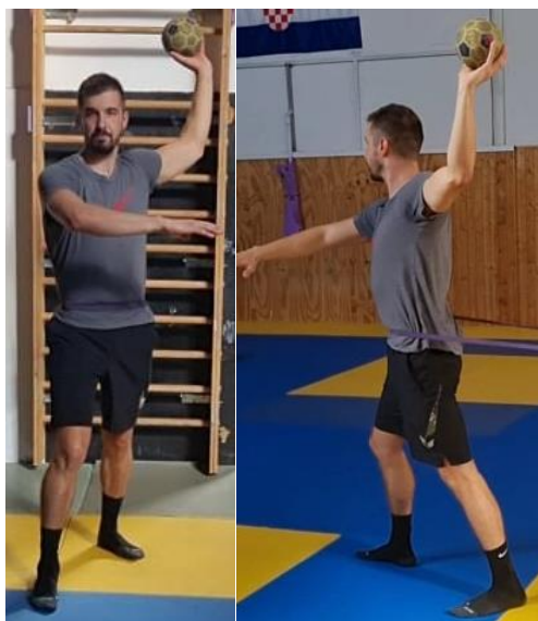
Slika 25. Dodavanje uz otpor gumom

Za ovu vježbu potrebna je guma s otporom koju treba zakačiti oko trbuha. Početna pozicije je na mjestu gdje guma ima najmanji otpor, te onda igrač s loptom u ruci čini 3 koraka prema naprijed i u fazi kada je otpor gume najveći dodaje loptu suigraču i zatim se vraća na početnu poziciju. Svaki igrač maksimalnom brzinom izvodi ovu vježbu 10 puta. Cilj ove vježbe je izbaciti tijelo iz balansa te mu otežati kretanje prilikom izvođenja rukometnih elemenata.