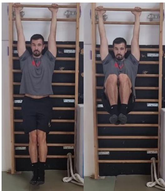
Slika 59. Podizanje nogu

Iz visa na švedskim ljestvama privlačenje natkoljenice prema prsima radeći fleksiju u zglobu kuka, te kontrolirano spuštanje u početnu poziciju. Teža varijanta ove vježbe bi bilo podizanje nogu opruženih u koljenu ili izdržaj s nogama podignutim pod kutom od 90^\circ u odnosu na trup. Cilj ove vježbe je razvoj trbušnih mišića. Vježbu ponoviti 15 puta.