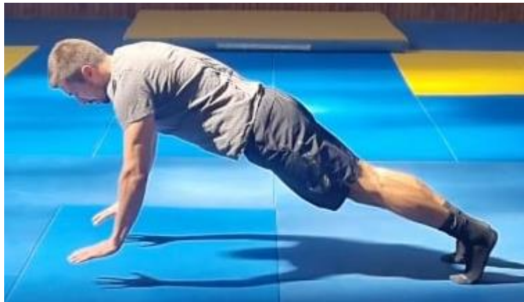
Slika 39. Sklekovi s odri vom

Početna pozicija je upor prednji nakon čega slijedi dolazak u poziciju skleka gdje je kut između podlaktice i nadlaktice 90^\circ , nakon toga se radi opružanje u lakatnom zglobu maksimalnom brzinom tako da se dlanovi odvoje od poda, nakon čega slijedi amortizacija i ponovni dolazak u poziciju upora prednjeg. Cilj ove vježbe je razvoj jakosti i eksplozivne snage prsnih i ramenih mišića. Naprednija verzija ove vježbe bi bila prilikom odraza rukama o pod da se napravi pljesak te amortizacija samog skleka i zauzimanje početne pozicije. Ovu vježbu ponoviti 10 puta.