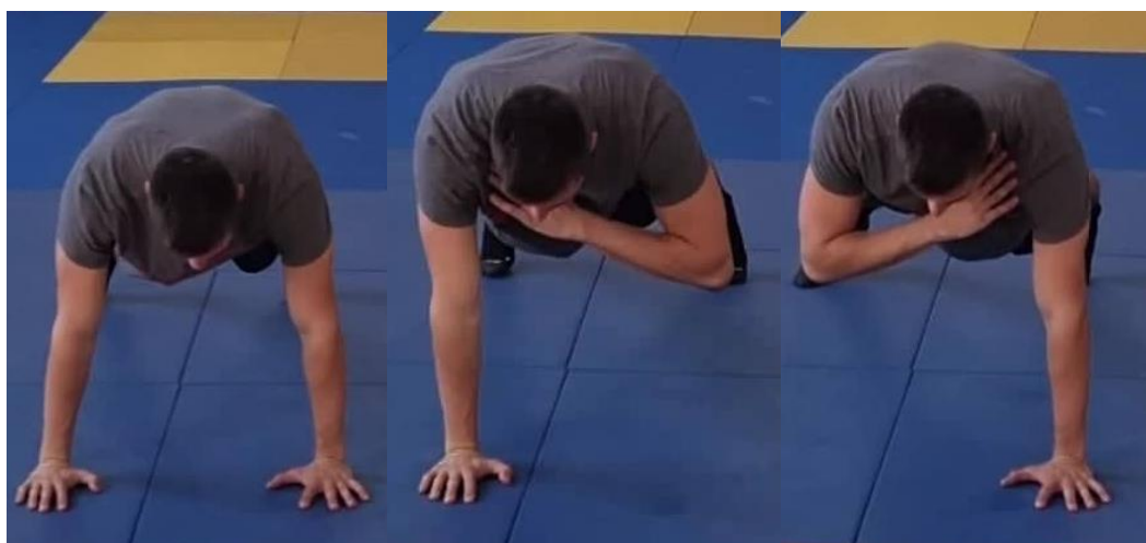
Slika 27. Dodirivanje ramena u uporu