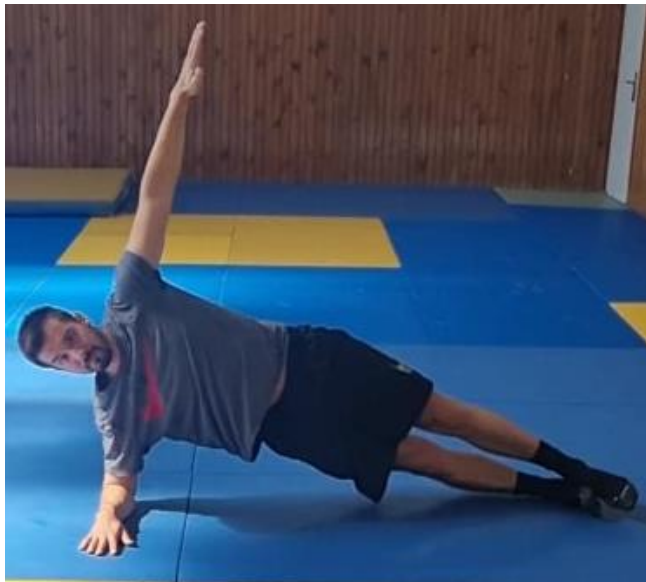
Slika 54. Bočni plank

Sportaš se nalazi ležeći na boku te na znak trenera oslanja se na jednu podlakticu te na vanjski dio stopala. Kukovi podignuti od poda i prate ravnu liniju tijela. Druga ruka je u abdukciji te tijelu osigurava balans. Teža varijanta bi bila pri abdukciji gornje noge te bi to zahtijevalo veću stabilnost tijela i jaču aktivaciju mišića trupa i nogu. ovu vježbu raditi 45 sekundi s svake strane. Cilj ove vježbe je povećati stabilnost trupa i tijela a posebno staviti akcenat na bočne trbušne mišiće.