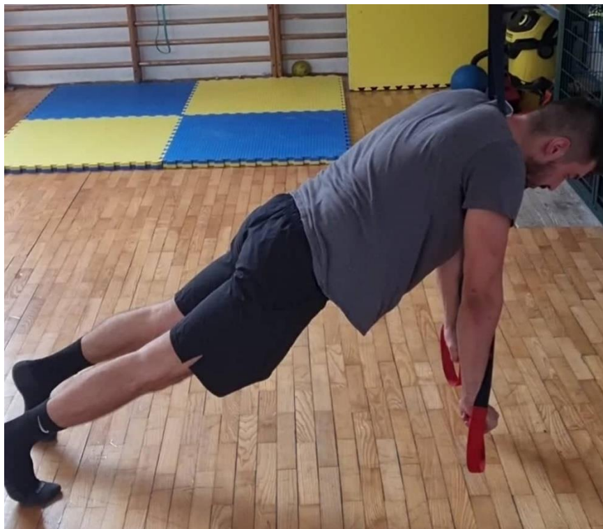
Slika 28. Upor na trx-u

Ručice od trx-a se nalaze u ruci i zauzima se položaj planka. Nakon zauzimanja položaja radi se izdržaj od 40s tako da se zadrži pravilna pozicija tijela uz stisnuti trup te kontrolu ruku. Cilj ove vježbe je povećati snagu ruku i ramenih mišića te povećati kontrolu tijela pri izvođenju vježbi snage prilikom uporabe nestabilnih rekvizita. Ovu vježbu je moguće zamijeniti plankom na balans ploči ili fitness lopti. Kada su savladani svi izdržaji na rekvizitima kao dodatnu vježbu može se odraditi sklek na trx-u, balans ploči ili lopti.