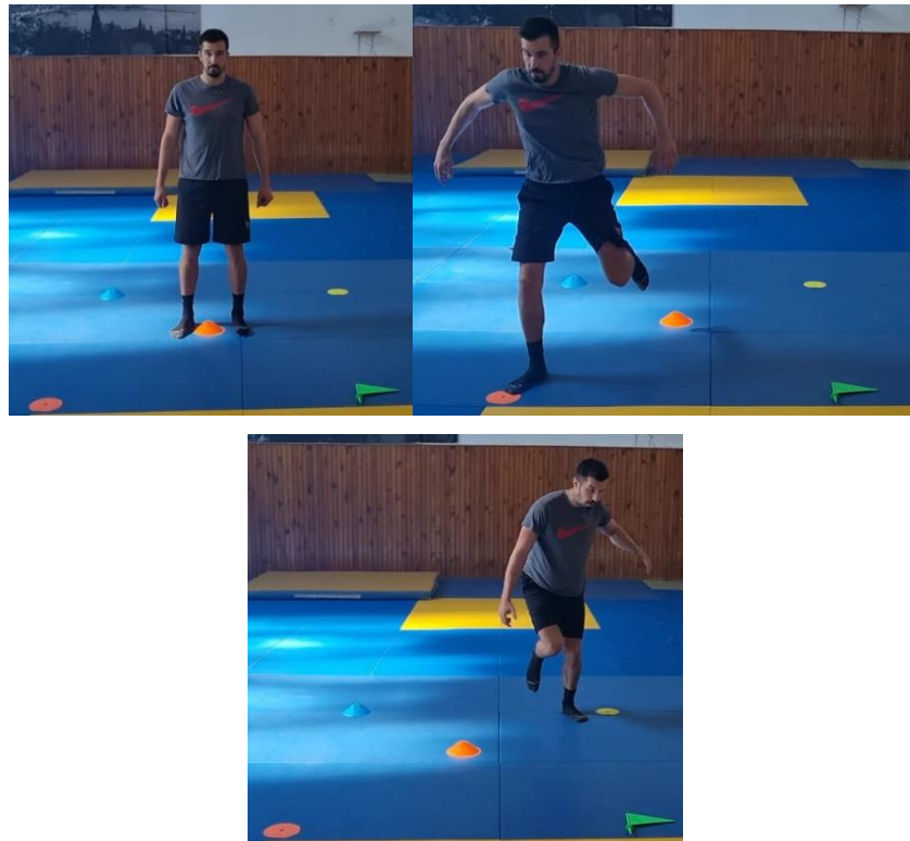
Slika 42. Jednonožni skokovi na označena polja

Početna pozicija je sunožni stav. Okolo igrača se nalaze označena polja raznih boja te na znak trenera igrač jednonožnim odrazom skače na boju koju je trener rekao, te nakon amortizacije skoka slijedi povratak jednonožnim skokom u početnu poziciju. Ova vježba se izvodi eksplozivno i kako bi vježba bila uspješno obavljena igrač treba brzo reagirati na upute trenera prepoznajući gdje se nalazi zadana boja. Ovu vježbu ponoviti 10 puta s jednom nogom zatim 10 puta s drugom. Cilj ove vježbe je razviti koordinaciju te brzinu reakcije kako bi bili spremni za uspješno brzo reagiranje u tijeku rukometne igre.