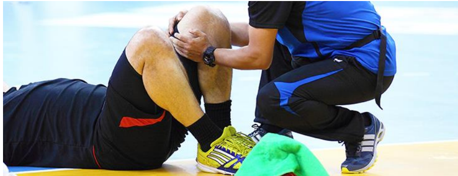
Slika 1. Ozljeda koljena

zasigurno može smanjiti stopu ozljeda koje se događaju za vrijeme rukometnih treninga i utakmica. Ovaj trening program je osmišljen tako da se provodi u uvodnom dijelu treninga kako bi tijelo bilo maksimalno spremno za glavni dio treninga.