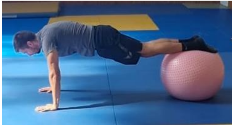
Slika 55. Upor prednji na fitness lopti

Nakon vježbi s stabilnim osloncem na red dolazi teža varijanta, tj. vježba s osloncem koji nema fiksnu poziciju. Ovu vježbu možemo izvoditi pomoću lopte ili trx-a. Oslonac je rukama o pod i nogama na lopti. Aktivacijom nogu i trupa kukove postaviti na optimalnu visinu te održavati poziciju narednih 45 sekundi. Ova vježba se može izvoditi tako da noge budu oslonjene o pod, a podlaktice postaviti na loptu. Cilj ove vježbe kontrolirati tijelo pri ne stabilnom osloncu te samim tim dodatno povećati aktivaciju trupa.