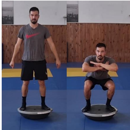
Slika 19. Čučanj na balans ploči

Iz sunožnog stava na balans ploči spuštanje u čučanj s rukama ispred tijela. Cilj ove vježbe je kontrolirati tijelo u izvođenju kompleksne vježbe prilikom izvedbe na nestabilnoj podlozi a i samim tim jačati mišiće donjeg dijela tijela. Varijacija ovog čučnja izvodi se 10 puta. Nestabilna podloga poput balans ploče pruža veći stres na zglobove koljena i gležnje te im omogućuje adekvatnu pripremu za razne doskoke koji očekuju tijelo prilikom rukometne igre.