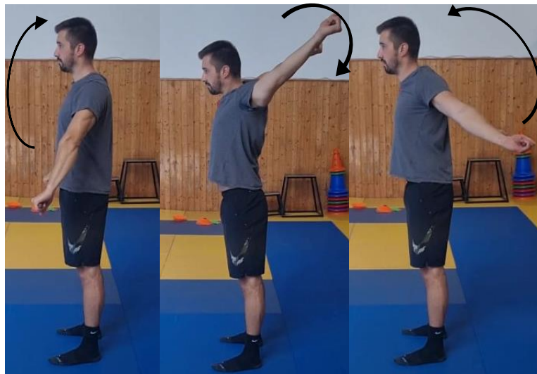
Slika 62. Iskret štapom

Prikazan je iskret štapom prema natrag. U početnom položaju štap se nalazi ispred tijela u visini kukova a ruke su isprežene u laktu, te iskretom prema natrag ruke se dovode do stražnje pozicije s tim da se dlanovima štap drži čvrsto za svo vrijeme pokreta, te nakon dostizanja krajnje pozicije kontrolirani povratak u početnu poziciju. Cilj ove vježbe je povećati opseg pokreta u ramenom zglobu te samim tim utjecati na stabilnost ramena pri opterećenjima koje ga očekuju u igri. Ovu vježbu ponoviti 8 puta.