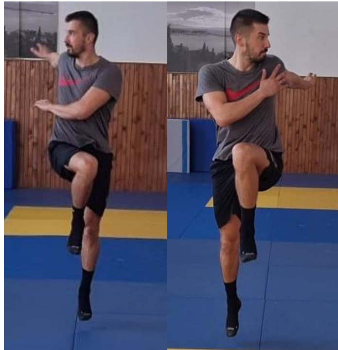
Slika 6. Zasuci rukama u kretanju

Iz trčanje prema naprijed radimo odraz s jednom nogom te istovremeno podižemo drugo koljeno, i radimo zasuk gornjim dijelom tijela na stranu podignute noge tako da nam se ruka nalazi pod kutom od 90^\circ , a glava prati kretanju ruke. Ova vježbu koristimo kako bi zagrijali zglob kuka i torakalni dio kralježnice jer ovaj pokret koristimo kao pripremu za skok šut u rukometnom treningu.