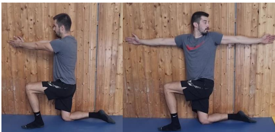
Slika 64. Rotacija trupa i ruke iz klečećeg stava

Iz klečećeg položaja zauzeti položaj iskoraka tako da je noga bliže zidu stražnja noga s koljenom na podu dok je druga noga u prednjem položaju gdje je kut između potkoljenice i natkoljenice 90^\circ . Ruke su opružene u laktu u visini ramena. Radi se rotacija trupom tako da ruka koja je dalje od zida prati kretnju trupa dok ne dođe do potpune rotacije nakon