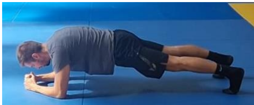
Slika 51. Plank

Iz ležećeg stava na prsima na znak trenera se oslanja na podlaktice i nožne prste te aktivacijom trbušnih mišića i mišića nogu postavlja kukove u visini trupa. Položaj planka zahtijeva aktivaciju cijelog tijela a najviše abdominalnih mišića. Ova vježba se izvodi u trajanju od 1 minute. Cilj ove vježbe je aktivirati trbušne mišiće.