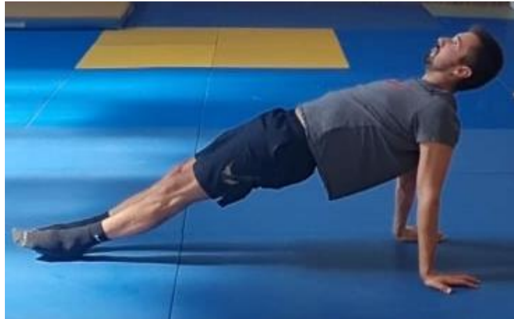
Slika 53. Upor stražnji

Početna pozicija je ležeći stav na leđima. Na znak trenera sportaš radi upor oslanjajući se na dlanove i pete dok je ostatak tijela u ravnini uz aktivaciju mišića nogu i trupa. Greška koja se javlja prilikom izvođenja ove vježbe je da kukovi budu prenisko ili previsoko u odnosu na noge i trup. Ovu vježbu raditi 45 sekundi.