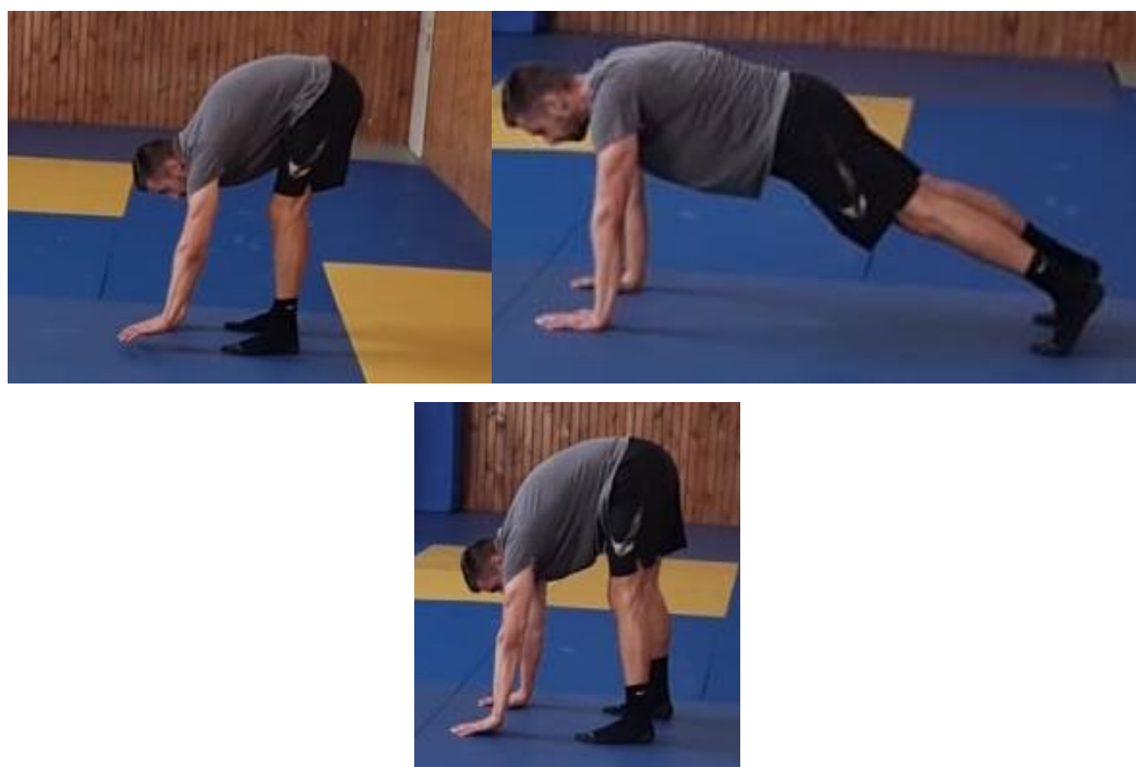
Slika 11. Kretnja iz pretklona do upora prednjeg

Iz predklona oslanjajući se rukama o podlogu kreće se prema naprijed dok se zauzme pozicija upora prednjeg. Zatim nogama se ide prema naprijed do ponovnog dolaska u predklon. Ovakva naizmjenična radnja se ponavlja do suprotne strane igrališta, zatim sljedi okret i povratak na početnu liniju. Cilj ove vježbe je stabilizacija trupa i istežanje mišića zadnje lože.