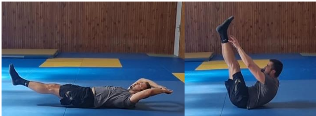
Slika 56. Sklopke

Iz ležećeg položaja na leđima i rukama u uzručenje aktiviraju se trbušni mišići i zauzima se pozicija 1 odvajanjem ruku i nogu od poda. Dodatnom kontrakcijom trbušnih mišića radi se fleksija u zglobu kuka te istovremenom kretnjom ruku i nogu dolazi do njihovog spajanja u poziciji 2. Taj položaj zadržati 1 sekundu te kontrolira povratak u poziciju 1. Ovu vježbu ponoviti 15 puta. Cilj ove vježbe je razviti trbušne mišiće te povećati njihovu jakost. Ovu vježbu može se otežati na način da sportaš u ruke primi vanjsko opterećenje te s njim izvodi ovu vježbu.