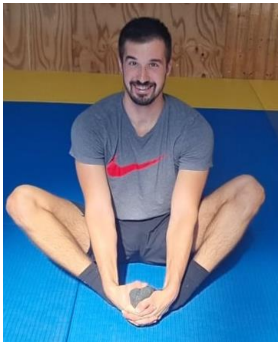
Slika 70. Leptir u pokretu

Iz sjedećeg stava fleksija u zglobu koljena, stopala su spojena, a položaj ruku je na stopalima. Iz tog položaja radi se maksimalna abdukcija nogu, te pri maksimalnom