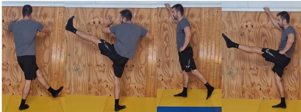
Slika 69. Zamasi nogom prema naprijed i u stranu

Početni položaj je raskoračni stav rukama oslonjeni na zid. Zamah se izvodi na način da noga s kojom se radi zamah je odvojena od poda dok je druga oslonac. Radi se zamah nogom preko noge oslonca te maksimalna abdukcija noge i zatim povratak u početnu poziciju. Cilj ove vježbe je probijanje maksimalnog raspona pokreta u zglobu kuka kroz dinamičnu vježbu a samim tim i povećanje mobilnosti kukova.