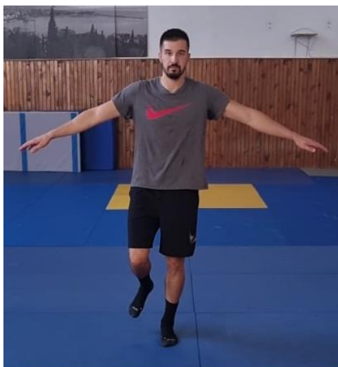
Slika 15. Stajanje na jednoj nozi

Iz sunožnog raskoračnog stava podignuti jednu nogu s poda i održati balans s osloncem na jednu nogu. Ova vježba koristi se na početku proprioceptivnog treninga zbog njenog laganog izvođenja a cilj ima osvijestiti tijelo za održavanje balansa.