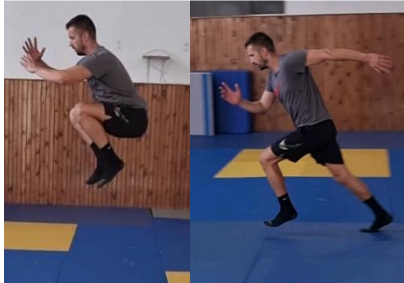
Slika 13. Sunožni skok + sprint

Iz raskoračnog stava na znak trenera rade se sunožni skokovi tako da se maksimalno odrazimo o podlogu, nakon 5 skokova radi se sprint do suprotne strane igrališta. Ova vježba se izvodi 2 – 4 puta. Cilj ove vježbe je zagrijati kukove, koljeno i gležanj te ih pripremiti za skokove i amortizacije skokova koje ih očekuju u rukometnoj igri.