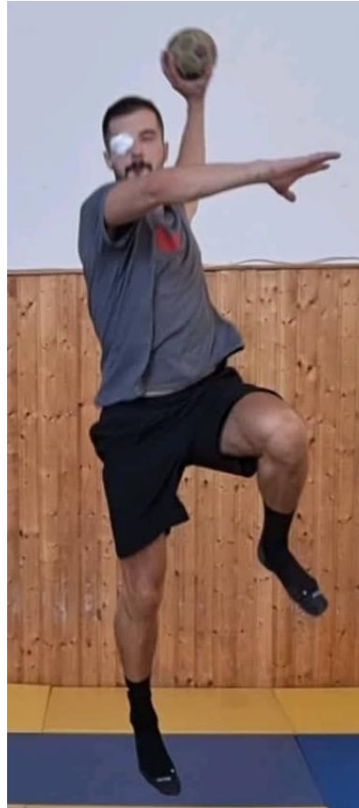
Slika 34. Skok šut uz zaklopljeno jedno oko

Nakon dodavanja u mjestu i kretanju slijedi šutiranje na gol. Igrač iz kretanja prema naprijed radi skok šut te šutira na gol uz zaklopljeno jedno oko. Cilj ove vježbe je da igrač maksimalno osvijesti kontrolu svojim tijelom te snalaženje u prostoru kako bi mogao šutirati jednako efikasno kao i u idealnim uvjetima. Kada igrači savladaju dodavanje i šutiranje uz zatvoreno oko naprednija vježba bi bila simulacija igre 3 na 3 s tim da igrači koji su u napadu imaju zaklopljeno oko dok igrači u obrani nemaju. Cilj te vježbe bi bio maksimalno otežati napadu igru kako bi u utakmici mogli odgovoriti na sve neočekivane situacije koje ih očekuju.