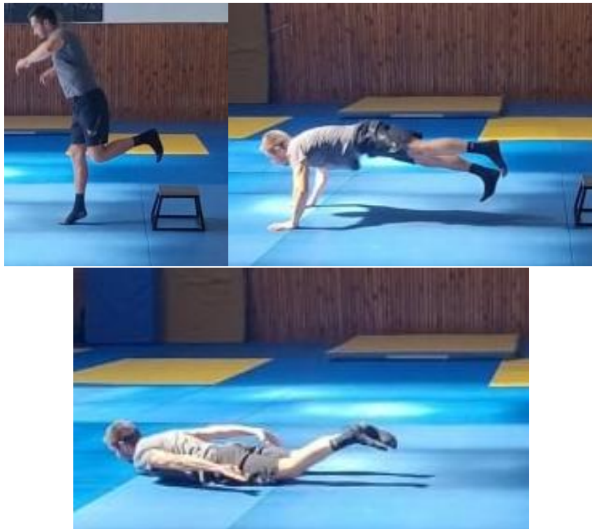
Slika 49. Prizemljenje upijačem

Prizemljenje upijačem najčešće se koristi prilikom narušavanja ravnoteže prema naprijed a trup je uspravan. Tijekom pada trup je ispružen prema naprijed a kontakt s podlogom se ostvaruje otvorenim dlanovima i rukama blago pogrčenim u laktu (Rogulj, 2007). Gravitacijska sila usporava se kontrakcijom mišića ruku do položaja skleka, te zbog velike inercije igrač najčešće na prsima klizi do potpunog zaustavljanja. Ova vrsta amortizacije se najčešće koristi pri amortizaciji padova pri izvođenju kretnji punom brzinom.