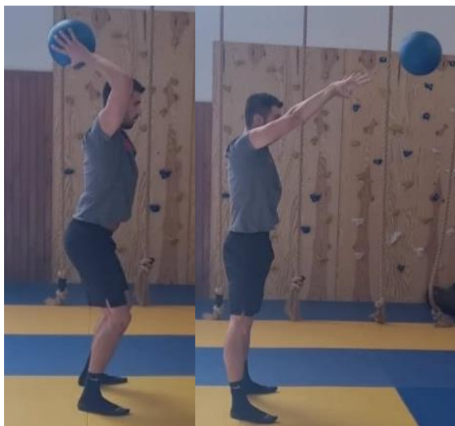
Slika 37. udarac medicinkom s obje ruke o zid

Početna pozicija je raskoračni stav držeći medicinku s dvije ruke u visini prsnog koša na udaljenosti od 3 metra od zida. Slijedi spuštanje u poziciju polučučnja i podizanje lopte iznad glave te eksplozivna kretnja istovremenog opružanja u zglobu koljena i kuka te udarca loptom prema naprijed od zid. Cilj ove vježbe je razvijanje eksplozivne snage i jakosti mišića ramena. Ovu vježbu ponoviti 10 puta.