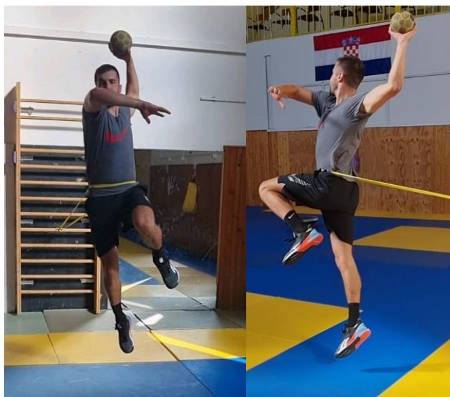
Slika 26. Skok šut uz otpor gumom

Iz početne pozicije gdje je otpor gume najmanji igrač radi 3 koraka prema naprijed, čini jednonožni odraz i izvodi skok šut u fazi gdje je otpor gume najveći. Nakon izbacivanja lopte iz ruke vraća se u početnu poziciju te spreman čeka na primanje lopte od suigrača te zatim ponavlja istu radnju. Ovu vježbu potrebno je odraditi 10 puta. Cilj vježbe je kontrolirati skok i preciznost lopte prilikom vanjskog ometanja za vrijeme izvođenja skok šuta.