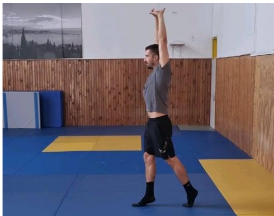
Slika 3. Hodanje na prstima, ruke u uzručenju

Početna pozicija je raskoračni stav, zatim se podižemo na nožne prste, a ruke postavljamo u položaj uzručenja te u tom položaju hodamo do suprotne strane igrališta zatim se okrećemo i nastavljamo s radom do uzdužne crte s koje smo krenuli. U ovoj vježbi primarno aktiviramo m.gastrocnemius.