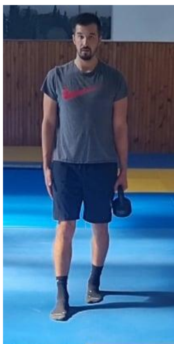
Slika 60. Hodanje s opterećenjem u jednoj ruci