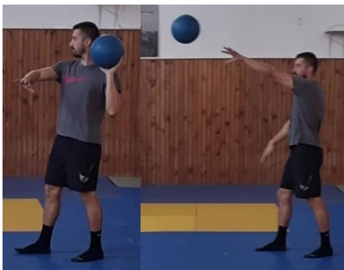
Slika 30. Dodavanje medicinke jednom rukom

Početna pozicija je raskoračni stav, medicinka se nalazi u dvije ruke u visini prsnog koša. Kada je igrač spreman za dodavanje, loptu prima jednom rukom te čini korak naprijed suprotnom nogom a loptu podiže u visinu ramena. Prilikom izbačaja loptu usmjerava