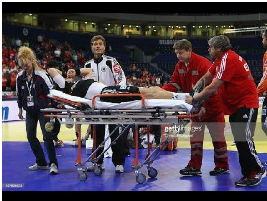
Slika 2. Ozljeda prilikom rukometne utakmice