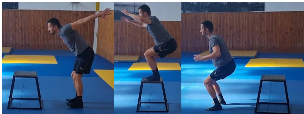
Slika 46. Sunožni skok na klupicu

Iz sunožnog raskoračnog stava izvesti skok na kutiju tako da se igrač spusti u polučučanj te uz upotrebu ruku napravi jaki odraz o podlogu, nakon amortizacije doskoka sunožno saskočiti s kutije. Ovu vježbu poviti 10 puta. Cilj ove vježbe je razvoj eksplozivne snage i jakosti donjih ekstremiteta.