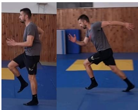
Slika 12. Niski skip + sprint