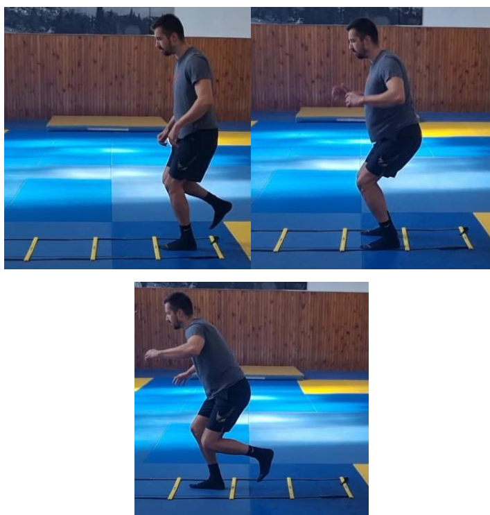
Slika 41. Naizmjenično sunožni i jednonožni skokovi na podnim ljestvama