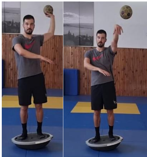
Slika 23. Jednoručno dodavanje na balans ploči