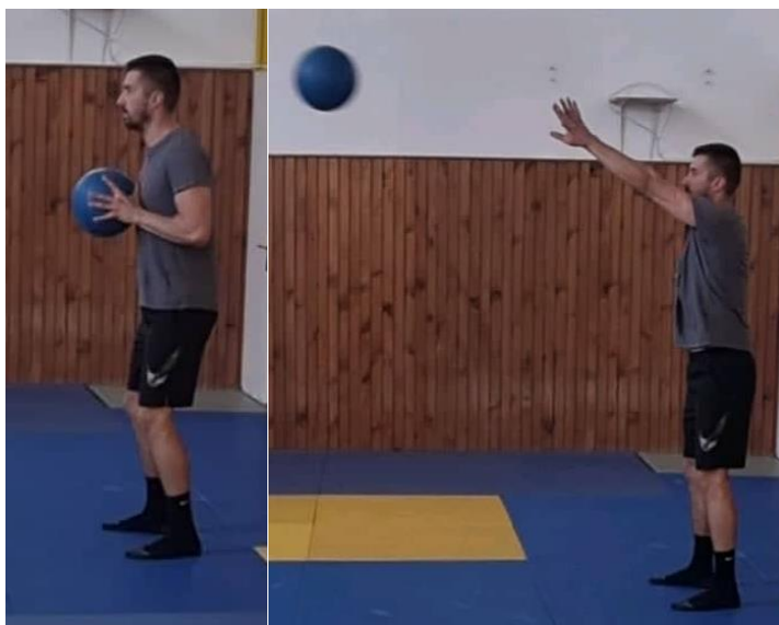
Slika 29. Dodavanje medicinke s dvije ruke

U raskoračnom stavu medicinka se prima s dvije ruke u razini prsnog koša, radi se polučučanj te na znak izbačaj medicinke gurajući je prema naprijed i gore. Ova vježba izvodi se maksimalnom snagom kako bi sportaš razvijao snagu i eksplozivnost što će mu doprinijeti kod šutiranja u rukometu. Ova vježba izvodi se 10 puta.