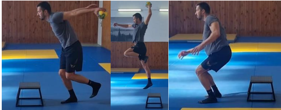
Slika 45. Skok na klupicu i skok šut

Igrač drži loptu u dominantnoj ruci i radi jednonožni odraz na klupicu, nakon amortizacije doskoka izvodi skok šut s klupice te sunožno doskače ispred klupice. Ovu vježbu ponoviti 10 puta. Cilj ove vježbe je spoj rukometnih elemenata s pliometrijskim elementima kako bi igrač što bolje kontrolirao svoje tijelo prilikom skokova i udaraca te raznih doskoka koji za vrijeme rukometne igre nisu u idealnim uvjetima.