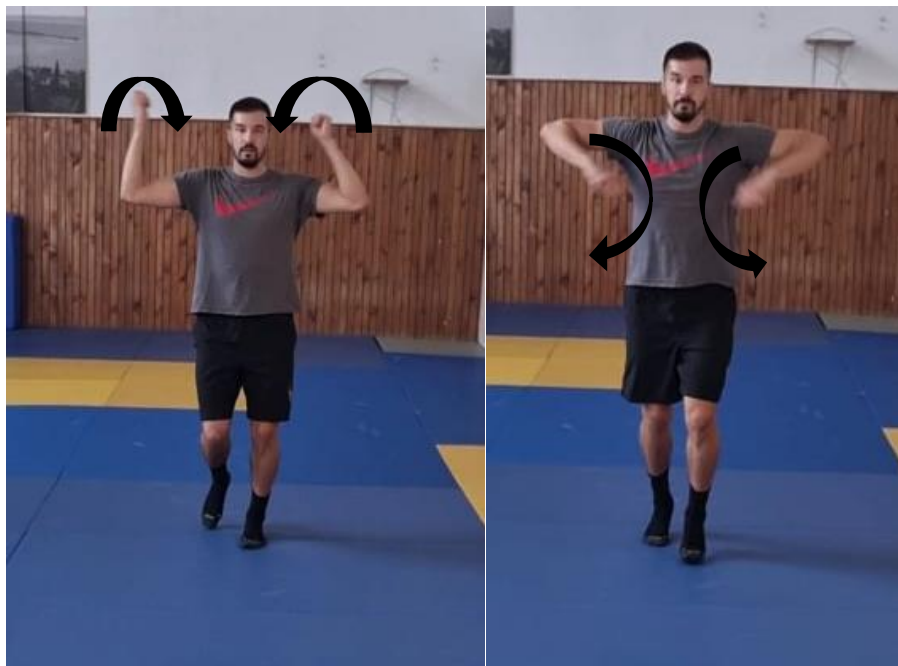
Slika 5. kruženje laktovima prema unutra i vani

Iz početnog raskoračnog stava, ruku su u odručenju pod kutom od 90^\circ i laktovi savijeni također pod kutom od 90^\circ . Krećemo u lagano trčanje prema naprijed istovremeno