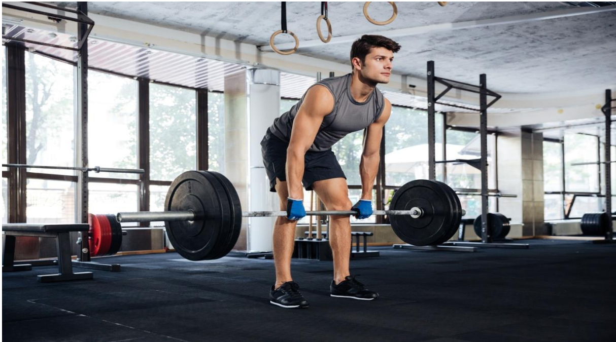
Slika 1. Trening s utezima

Trening s vanjskim opterećenjem može se primjenjivati na svim dobnim skupinama ako je kvalitetno planiran, a rezultati njegovog djelovanja na vježbača su pozitivni. Kod djece u naglom razvoju od 10 do 15 godina primjenom ovog treninga dolazi do ujednačavanja rasta u visinu i širinu. U srednjoškolskoj dobi mogu se primjenjivati jači treninzi s vanjskim opterećenjem (utezi, sprave za vježbanje) i donose dobre rezultate jačanja organizma u toj dobi.