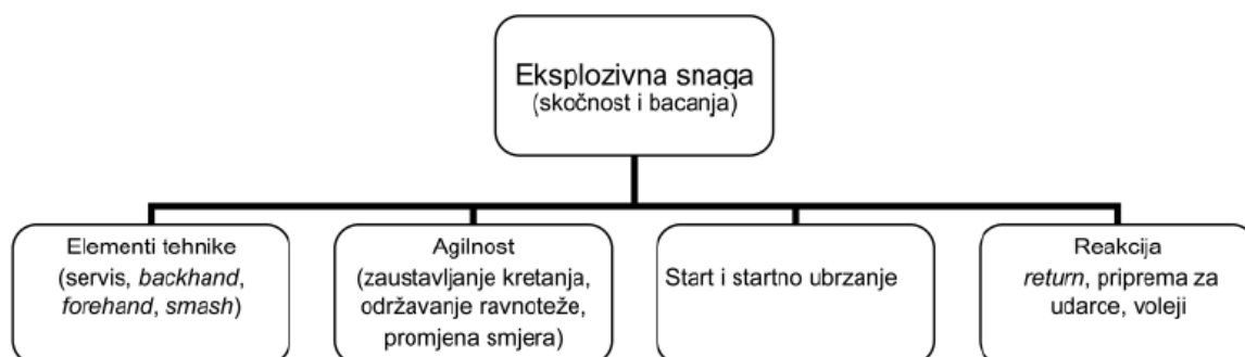
Shema 1. Interakcija eksplozivne snage i tehničko-taktičkih elemenata

Struktura motoričkih sposobnosti važnih za uspjeh u tenisu svakako uključuje eksplozivnu snagu, koja se razvija i održava vježbama skočnosti i bacanja. Eksplozivna snaga manifestira se za vrijeme izvođenja gotovo svih udaraca i neophodna je za optimalno kretanje tenisača na terenu. U smislu primjene vježbi eksplozivnog tipa (skokovi i bacanja) moguća je ovakva podjela: