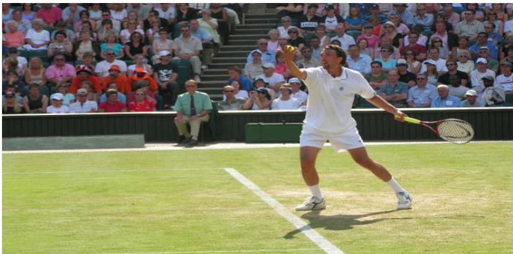
Slika 1. Goran Ivanišević na Wimbledonu

Tenis se ubraja u skupinu tehnički složenijih sportova koji od natjecatelja zahtijeva izrazitu tehničko-taktičku, kondicijsku i psihičku pripremljenost. To pogotovo jer je u njemu više od ostalih sportova svakodnevno zastupljena konstanta koja se zove – promjenjivost. Ona je uzrokovana izrazito velikim brojem parametara od kojih su samo neki: vrsta podloge, vrsta loptica, okruženje, prekid meča, odigravanje meča u bilo koje doba dana, taktika igre natjecatelja A i B u meču X itd.