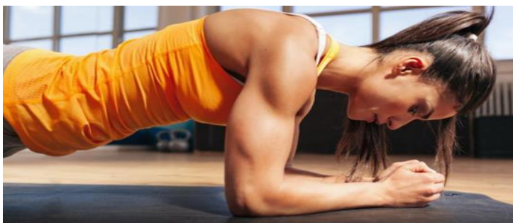
Slika 6. Primjer vježbe izdržljivosti (plank)

Cilj je povećanje otpora na umor i ubrzanje oporavka između poena na treninzima i mečevima. Za aktivnost većinom odabiremo trčanje iako se ponekad u pripremnom periodu mogu koristiti i druge aktivnosti poput biciklergometra, veslanja i plivanja.