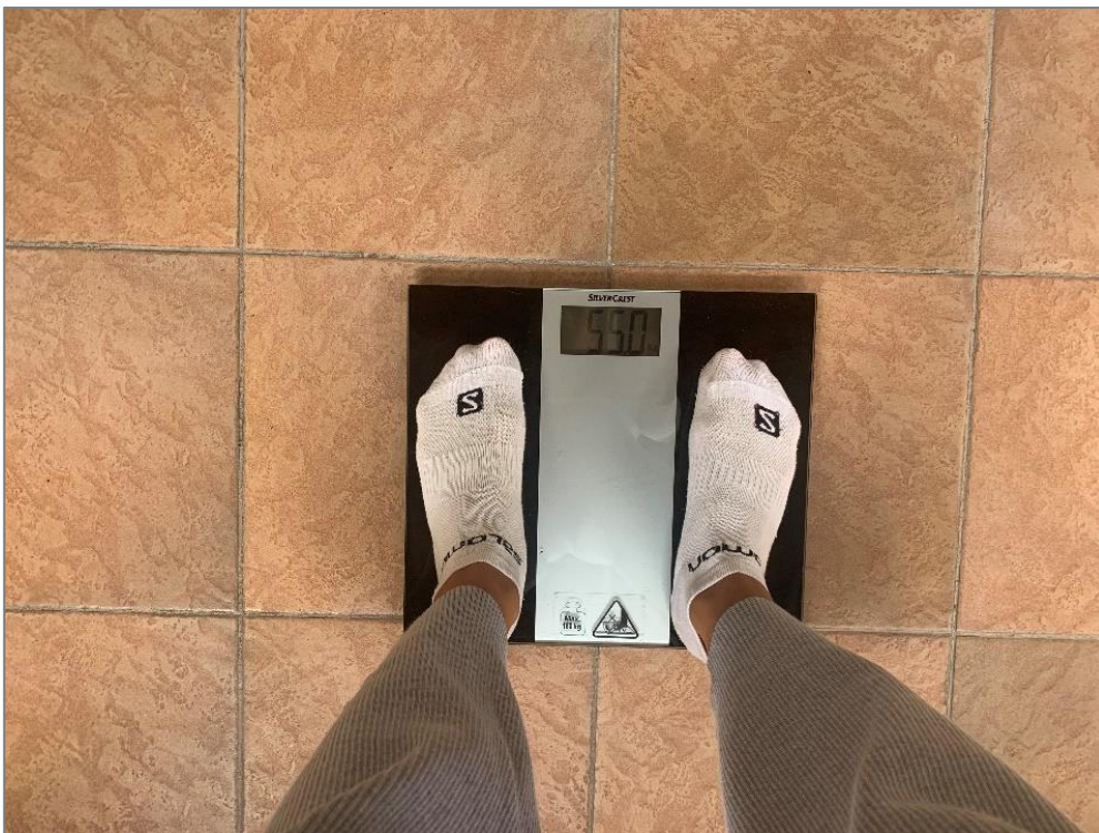
Slika 1. Mjerenje tjelesne težine

Tjelesna masa (TM) – mjerila se digitalnom vagom. Ispitanik je bio bos, obučen u donje rublje.