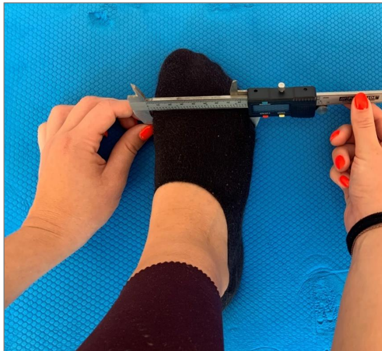
Slika 3. Mjerenje širine stopala

Širina stopala (ŠIRST) – kliznim šestarom mjerila se udaljenost između metatarsale tibiale i metatarsale fibulare