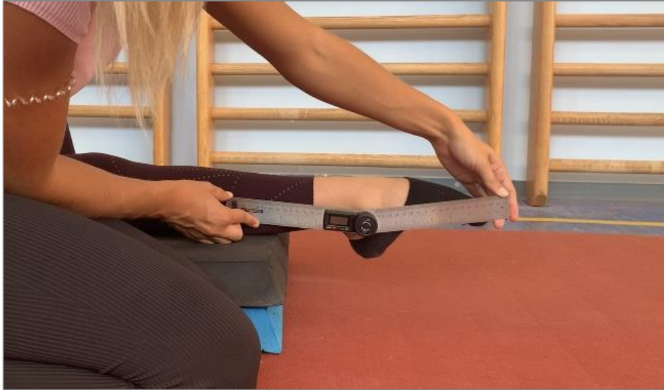
Slika 7. Mjerenje mobilnosti skočnog zgloba – plantarna fleksija