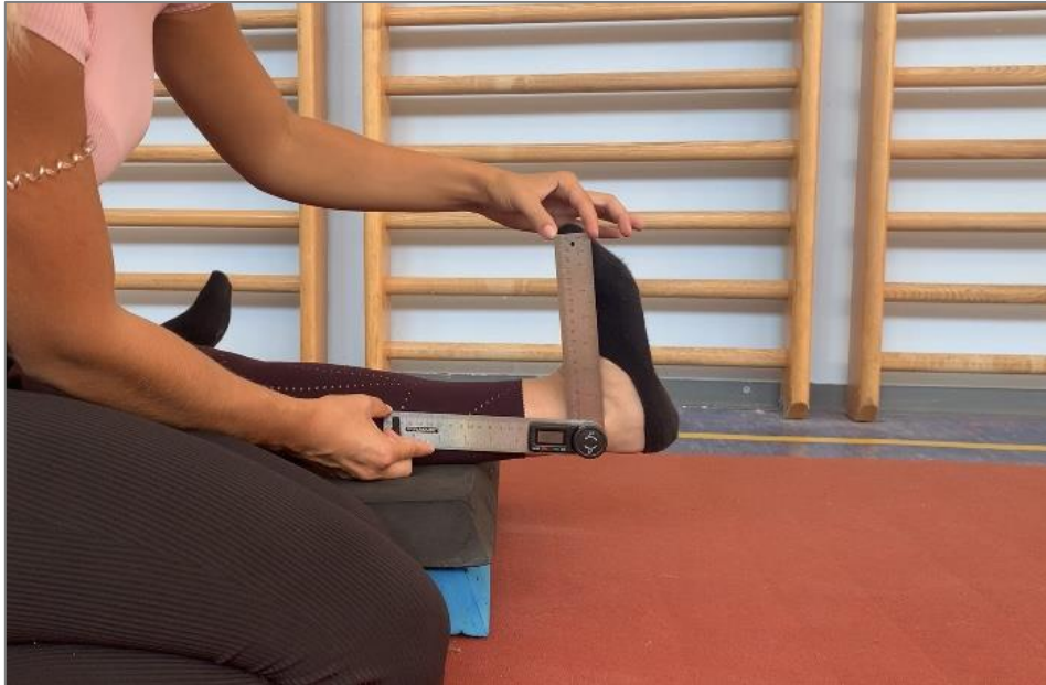
Slika 6. Mjerenje mobilnosti skočnog zgloba – dorzalna fleksija

MSZ D – Mobilnost skočnog zgloba/dorzalno - kod mjerenja dorzalne fleksije goniometar se postavlja na lateralnu stranu maleolusa uz fibulu. Paralelno s lateralnom srednjom linijom prema glavi fibule postavlja se nepomični krak, dok se paralelno s lateralnom srednjom linijom calcaneusa postavlja pomični krak. Nakon izvođenja pasivnog pokreta u ispitanika, dobivene su vrijednosti izražene u stupnjevima. Posebnu pozornost treba obratiti na kuk da nije u rotaciji, potkoljenica ispitanika treba biti fiksirana, te ne smije doći do pokreta inverzije i everzije stopala.