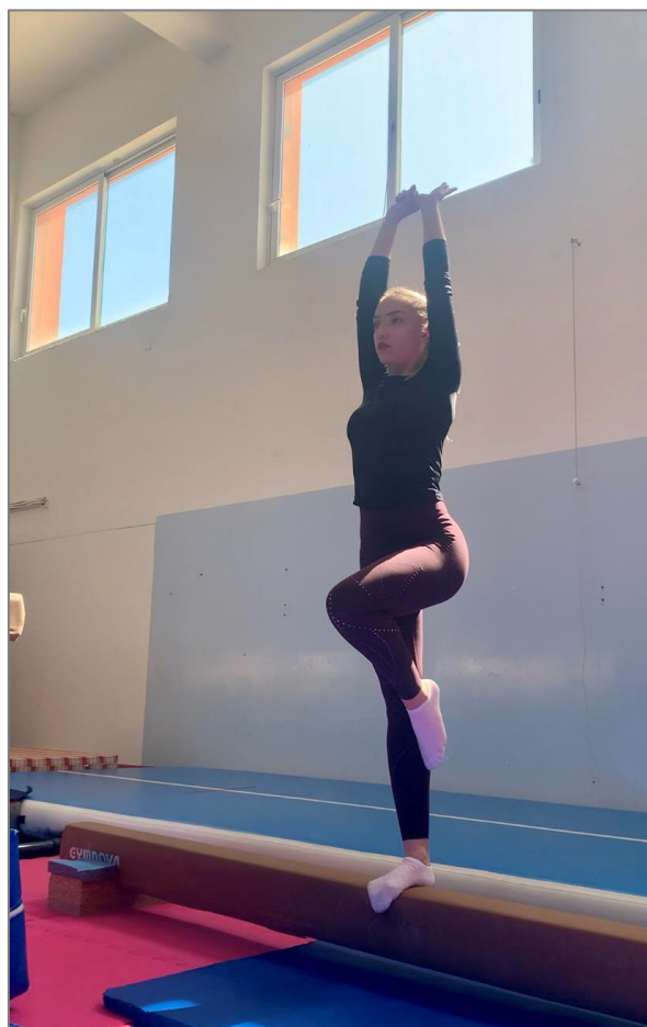
Slika 5. Mjerenje novog sport-specifičnog gimnastičkog testa na gredi

Ispitanik ruke postavlja u uzručenje, držeći se za palac suprotne ruke, dok istovremeno postavlja nogu u poziciju zatvorenog passe-a (noga je prednožno pogrčena). U tom trenutku započinje mjerenje testa. Mjeritelj štopericom mjeri vrijeme provedeno u navedenom položaju. Zadatak je što duže održati specifični položaj na gredi. Mjeri se ravnoteža lijeve i desne noge, te se test izvodi tri puta s lijevom i desnom nogom. Kao rezultat testa uzima se najbolji rezultat postignut kod tri mjerenja. Svrha testa je izmjeriti specifičnu gimnastičku ravnotežu, dok cilj testa podrazumijeva što duže održati ravnotežu u specifičnom položaju. Mjeritelj zaustavlja vrijeme na štoperici ukoliko ispitanik izvodi veće oscilacije trupom, odmakne nogu iz položaja „passe“, spusti ruke, odvoji ruke ili padne s grede.