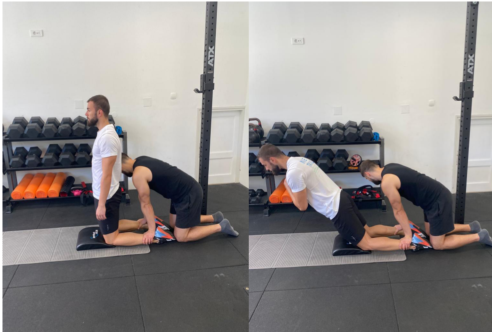
Slika 19. Jednonožni pregib ložom