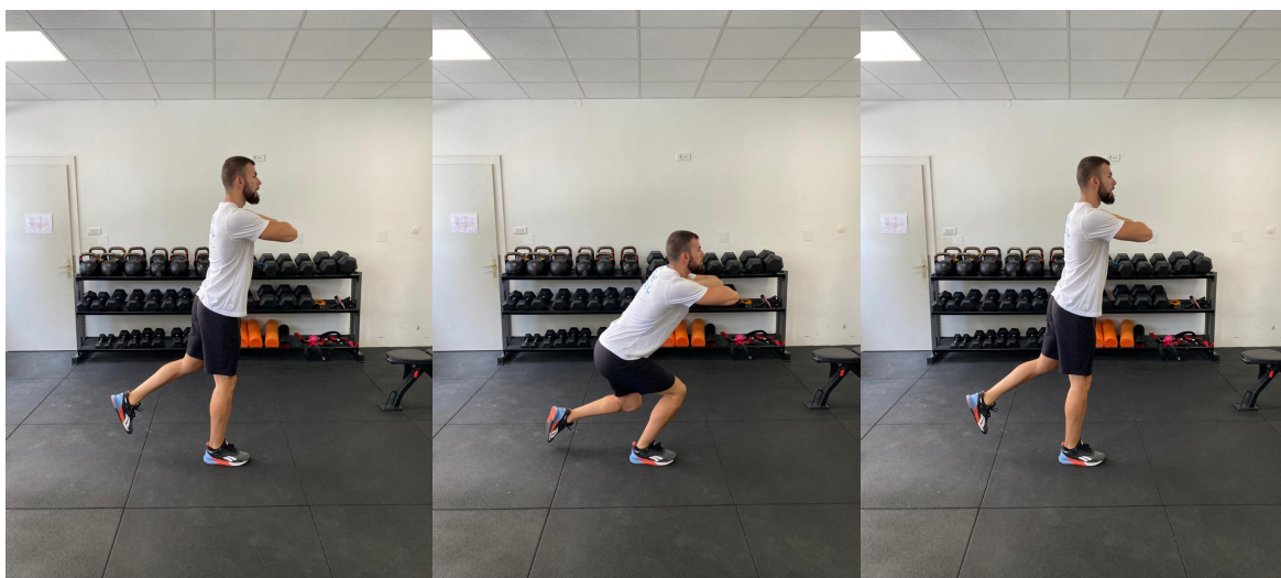
Slika 22. Čučanj na jednoj nozi

Sportaš stojeći na jednoj nozi s rukama prekriženim na prsima treba čučnuti pod kutom od 60 stupnjeva. Cilj vježbe je održati pravilni položaj i ravnotežu 5 sekundi. Sportaš vježbom treba pokazati sposobnost održavanja leđa bokova i stražnjice u uspravnom položaju tijekom spuštanja u čučanj. 5 ponavljanja za svaku nogu.