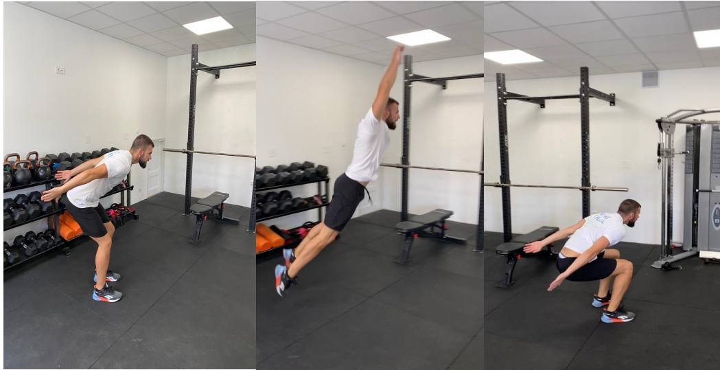
Slika 23. Skok u dalj