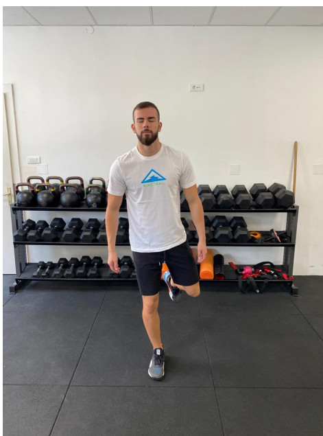
Slika 28. Jednonožno održavanje ravnoteže sa zatvorenim očima

Sportaš stoji na jednoj nozi sa blago flektiranim koljenom te drugom nogom zgrčenom u koljenu za oko 75 stupnjeva i zatvorenim očima. Ovu poziciju mora zadržati 30 sekundi za uspješno izvršen test.