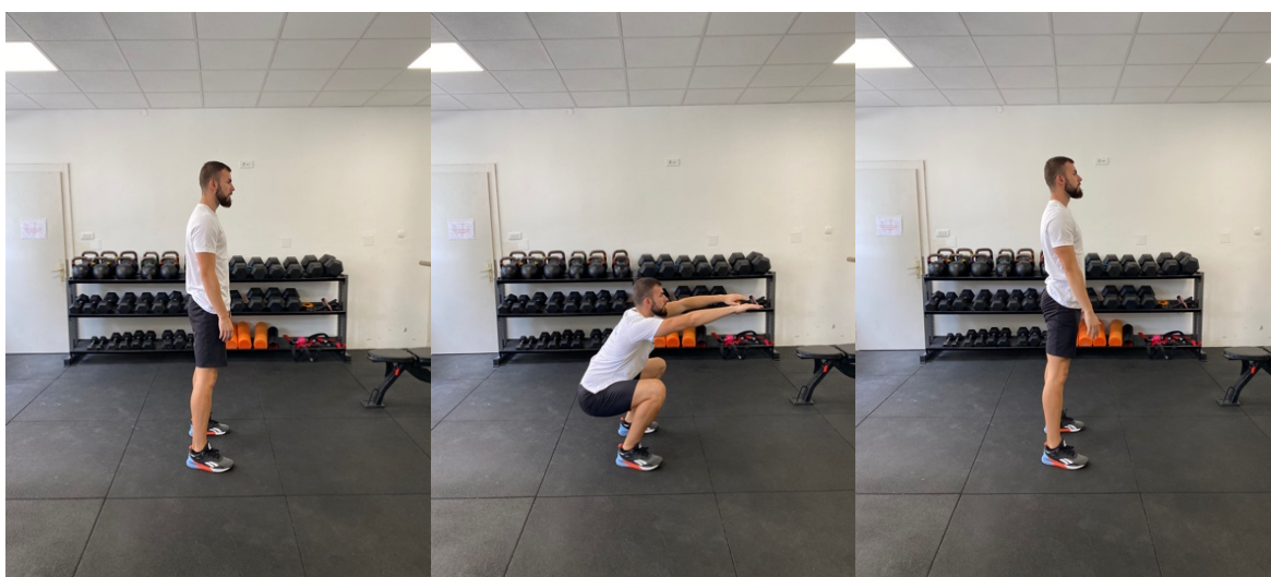
Slika 21. Bilateralni čučanj

Sportaš postavlja poziciju stopala u širini ramena te se spušta u položaj čučnja. Tijekom izvođenja vježbe leđa moraju ostati ravna dok natkoljenica ne bude paralelna sa podlogom. Test je uspješno odrađen kad vježbač izvede uspješnih 8 od 10 ponavljanja.