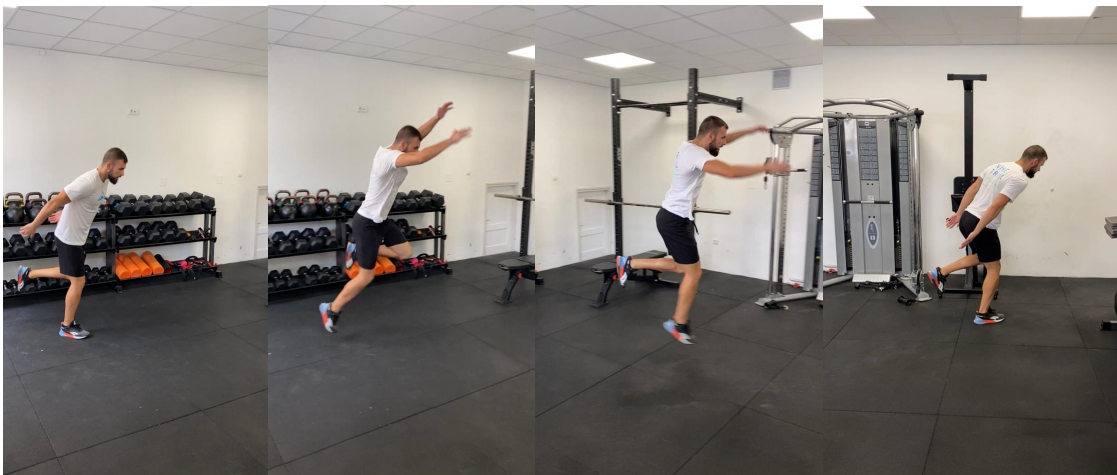
Slika 24. Skok u dalj na jednoj nozi

Sportaš na liniji stoji na jednoj nozi s rukama iza leđa. Nužno je završiti skok na istoj nozi kao na polasku te održati ravnotežu.