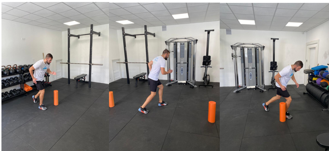
Slika 29. Trčanje u obliku broja osam

Na udaljenosti od 10 metara postavljaju se čunjevi te sportaš mora trčati dva puta oko njih u obliku broja osam. Sportaš ne smije srušiti čunjeve i ima dva pokušaja za izvedbu testa.