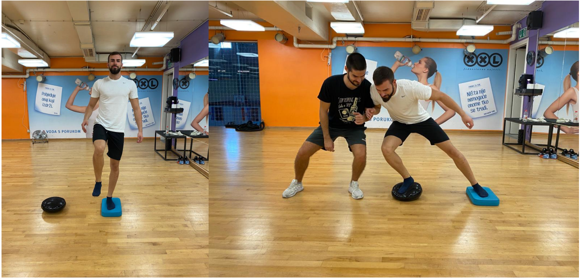
Slika 11. Propriocepcija – ravnoteža