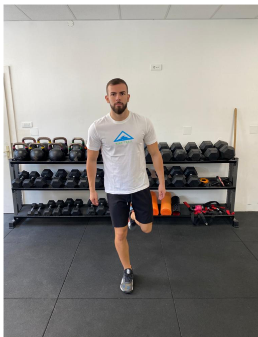
Slika 27. Jednonožno održavanje ravnoteže sa otvorenim očima

Sportaš stoji na jednoj nozi sa blago flektiranim koljenom te mora održati taj položaj 30 sekundi na svakoj nozi da bi uspješno izveo test.