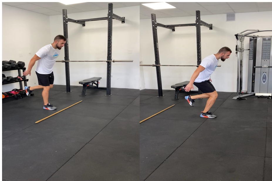
Slika 25. Jednonožni troskoci preko linije

Sportaš stoji na jednoj nozi s rukama postavljenim iza leđa, skok i doskok na istu nogu izvodeći tri uzastopna skoka preko linije što je dalje moguće. Mjeri se udaljenost.