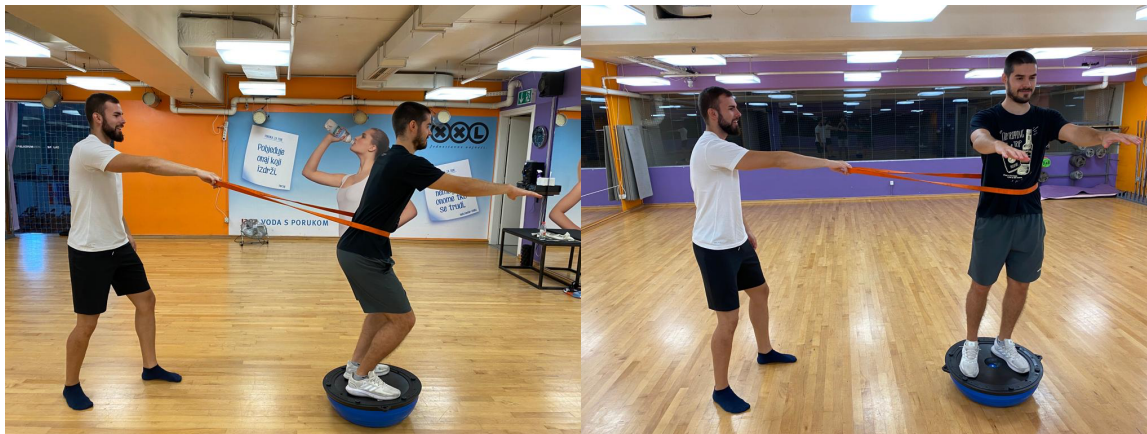
Slika 9. Propriocepcija - ravnoteža