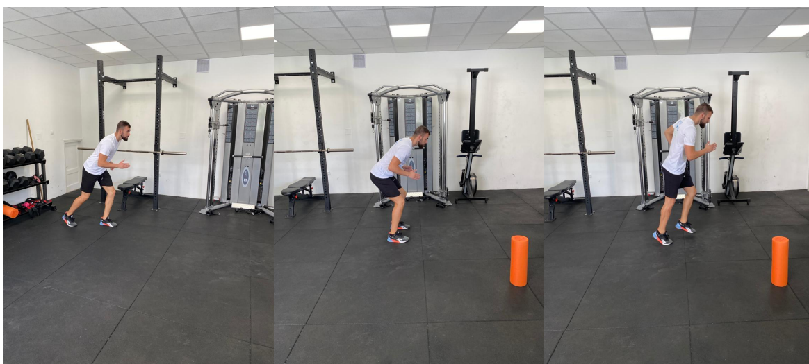
Slika 30. Start – stop šprintevi

Sportaš trči maksimalnom brzinom 40 metara te na verbalni znak „stop“ mora se zaustaviti u mjestu bez dodatnih koraka ili očitog gubitka ravnoteže. Test je uspješno izvršen ako se sportaš 5 puta uspješno zaustavi.