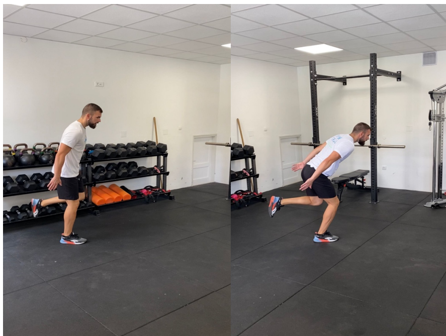
Slika 26. Jednonožni poskoci s pauzama

Sportaš stoji na jednoj nozi, izvodi jednonožni submaksimalni trostruki skok, a zadržavanje položaja nakon doskoka je 5 sekundi i ponavlja se pet puta ja za svaku nogu.