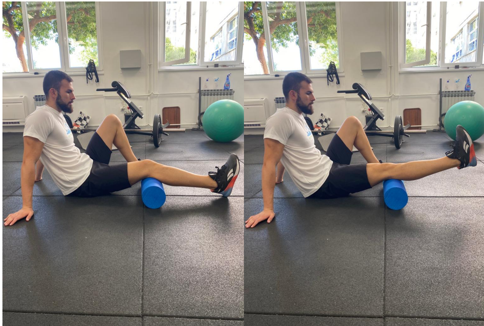
Slika 12. Ekstenzija koljena