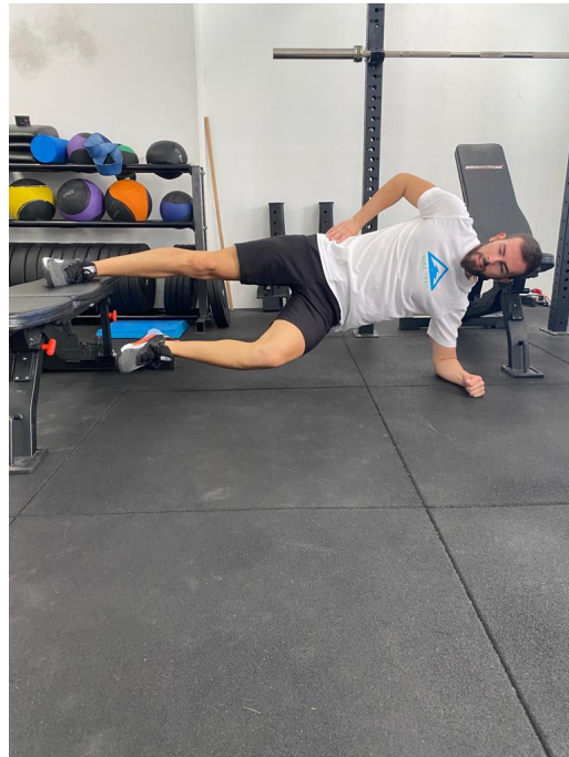
Slika 7. Propriocepcija - ravnoteža