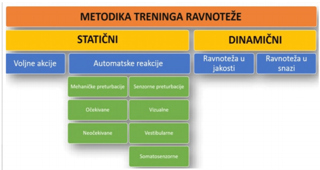
Slika 13. Metodika treninga ravnoteže

Vježbe proprioceptije i ravnoteže krojimo kroz navedenu tablicu: najprije krećemo od jednostavnijih prema kompleksnijim, te od statičkih prema dinamičkim.