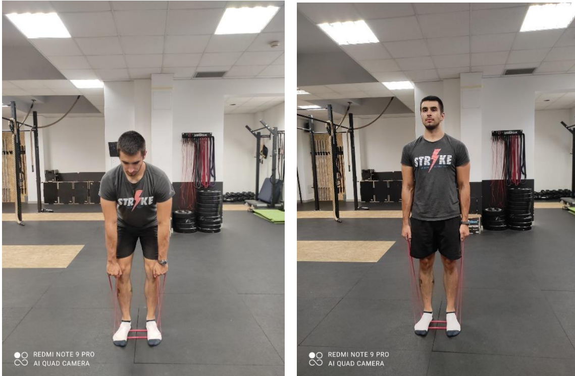
Slika 18.a., b. Predvježba za mrtvo vučenje

Tijekom treće faze kineziterapijskog tretmana radi se i predvježba za mrtvo vučenje (slika 18.a, b.). Klijent drži stopala u razini kukova te postavlja elastičnu traku prema prikazu na slici 18.a. Izvodi pregib tijela naprijed s istovremenim guranjem kukova natrag te se podiže u uspravan položaj.