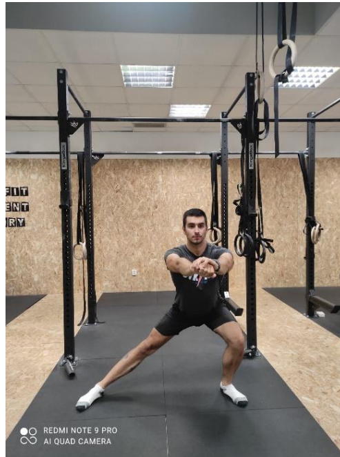
Slika 11. Istezanje čučnjem u stranu

Tijekom vježbe istezanje čučnjem u jednu stranu (slika 11) klijent radi širok korak u jednu stranu. Zakoračnu nogu savija, a drugu nogu ostavlja ispruženom. Trup ostaje uspravan, a zdjelicu pomiče unazad.