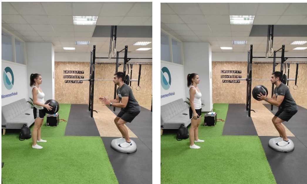
Slika 26 a., b. Hvatanje lopte na nestabilnoj površini

Tijekom vježbe četveronožno ispružanje ruke i noge (slika 27 a., b.) klijent je na podu oslonjen na ruke i prste noge. Klijent se postavlja u pozu četveronoške te podiže koljena 10 cm od poda. Istovremeno ispruža suprotnu ruku i nogu uz očuvanje ravnoteže, bez narušavanja zauzetog položaja.