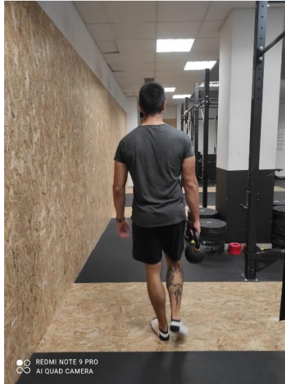
Slika 23. Hodanje s girjom u jednoj ruci

Vježba hodanje s girjom u jednoj ruci (slika 23) izvodi se na načina da klijent hoda određenu duljinu držeći girju u jednoj ruci. Cilj vježbe je hodati bez naginjanja trupa u stranu kao da se hoda bez girje.