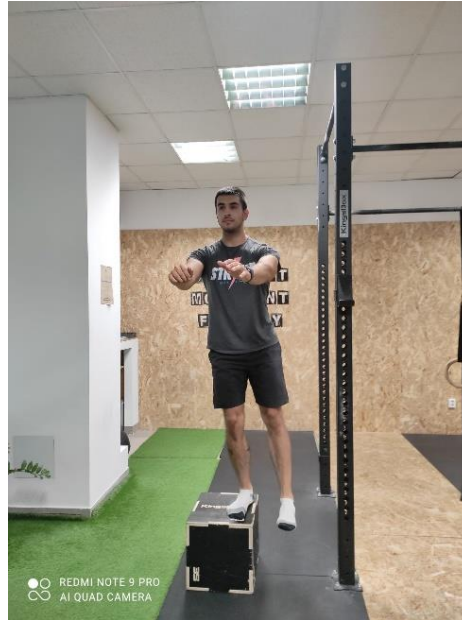
Slika 19 a., b. Jednonožno spuštanje pete

Tijekom vježbe mrtvo vučenje (slika 20.a., b.) klijent vrši podizanje šipke s utezima s poda. Noge su raskoraku širine kukova, pregib se radi trupom, kukovi se guraju natrag, ispruženim rukama uzima šipku. S ravnim leđima se uspravlja.