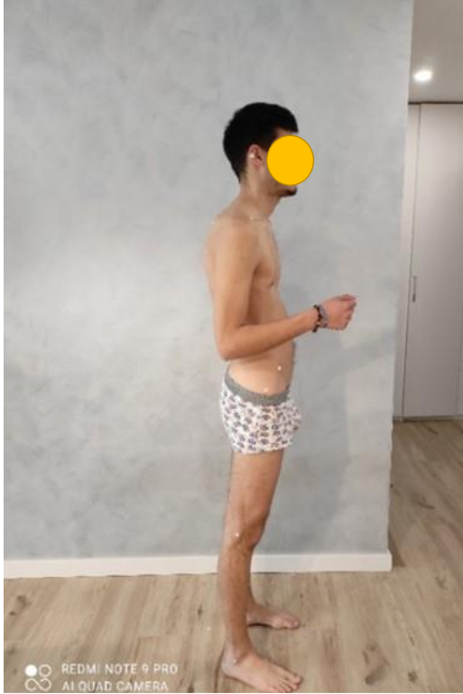
Slika 5. lateralna analiza posture