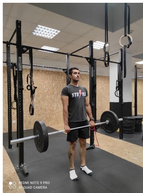
Slika 20 a., b. Mrtvo vučenje