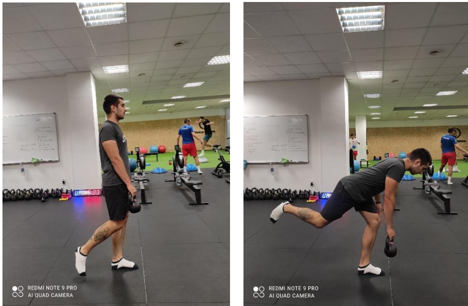
Slika 21 a., b. Jednoonožna vaga

Izvođeći vježbu jednoonožna vaga (slika 21 a., b.) klijent izvodi vagu na jednoj nozi istovremeno držeći girju u suprotnoj ruci. Trup treba približiti podu kako bi zauzeo što paralelniji položaj s podom uz istovremeno podizanje jedne noge prema natrag i gore, a savijanjem koljena stajajuće noge.