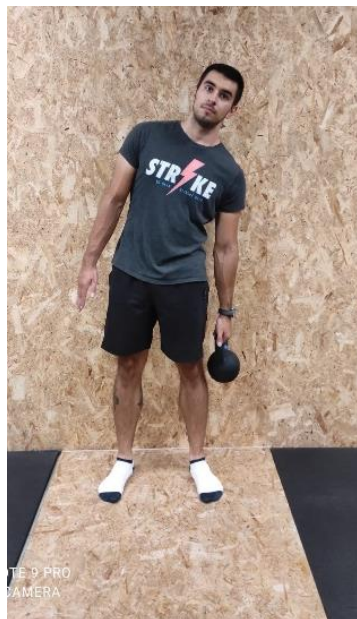
Slika 17. Lateralni pregib trupa

Lateralni pregib trupa (slika 17) klijent izvodi tako da stoji u uspravnom položaju držeći girju u jednoj ruci te se polagano pregiba u tu stranu, i onda naglo podiže nazad u početni položaj.