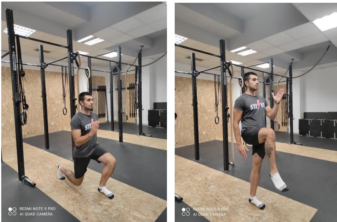
13. a., b. Iskorak s podizanjem noge

Faza 2 usmjerava se na aktivaciju površinskih stabilizatora – koordinaciju pokreta te progresiju u korištenju više ravnina i nestabilnih površina te uspostavi brzih pokreta. Tijekom provođenja kineziterapijskog tretmana u fazi 2 preporučuje se izvoditi vježbe: iskorak s podizanjem noge, „deadbug“ s guranjem koljena, korak u stranu, spuštanje kukova u bočnu plenku, lateralni pregib trupa, predvježbe za mrtvo vučenje. Prva vježba ove faze je iskorak s podizanjem noge (slika 13 a., b).