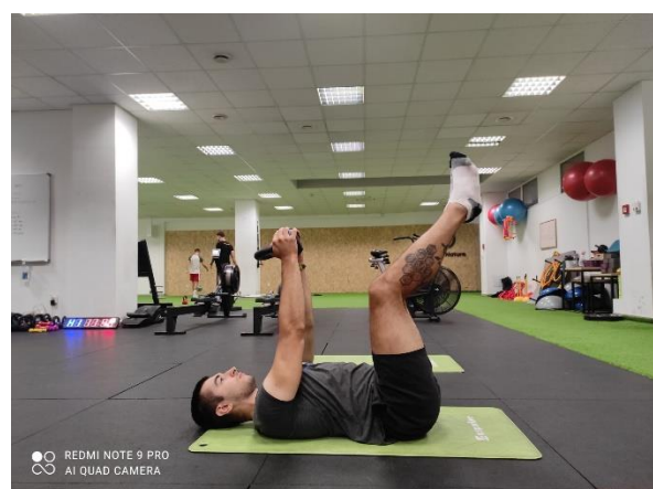
Slika 12.a., b Spuštanje noge u „deadbug“