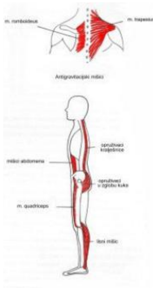
Slika 2: Posturalni antigravitacijski mišići

Uspravan položaj tijela i ravnoteža ostvaruju se djelovanjem posturalnog refleksa koji ubrajamo u mehanizme za održavanje uspravnog tjelesnog stava. Mišići koji su zaduženi za provođenje posturalnog refleksa, zovu se posturalni ili antigravitacijski mišići (Paušić, 2007).