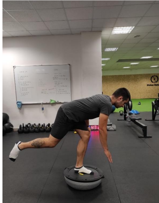
Slika 29. a., b. Jednonožna vaga na nestabilnoj površini