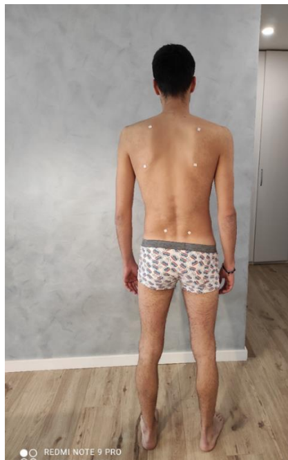
Slika 4. Posteriorna analiza posture

Kod pacijenta uočena je urođena skolioza (slika 4) i deformitet prsnog koša (slika 5). Osim navedenoga uočene su funkcionalne nepravilnosti: gornji ukriženi sindrom, elevaciju lijeve lopatice, hiperlordozu zdjelice i lateralni tilt zdjelice (slika 6). Uočene su također i funkcionalne poteškoće u zglobovima kuka i koljena. Fokus kineziterapijskog tretmana biti će na lateralnom tiltu zdjelice.