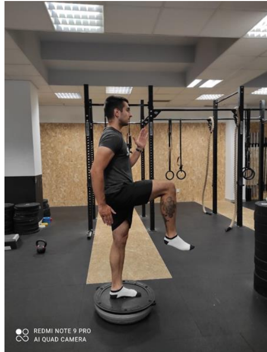
Slika 28 a., b. Iskorak na nestabilnoj podlozi

Jednonožna vaga na nestabilnoj podlozi (slika 29 a., b.) izvodi se na način da klijent jednom nogom stoji na nestabilnoj površini dok je istovremeno druga noga u zraku. Uz savijanje koljena stajaće noge pregiba trup prema naprijed pokušavajući ga dovesti u položaj paralelan s tlom, a druga noga istovremeno ide natrag i gore.