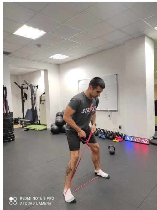
Slika 15. Korak u stranu

Tijekom izvođenja vježbe korak u stranu (slika 15) klijent postavlja elastičnu traku prema prikazu, s nogama u razini kukova blago savije koljena i napravi preгиb u trupu te radi korake u stranu.