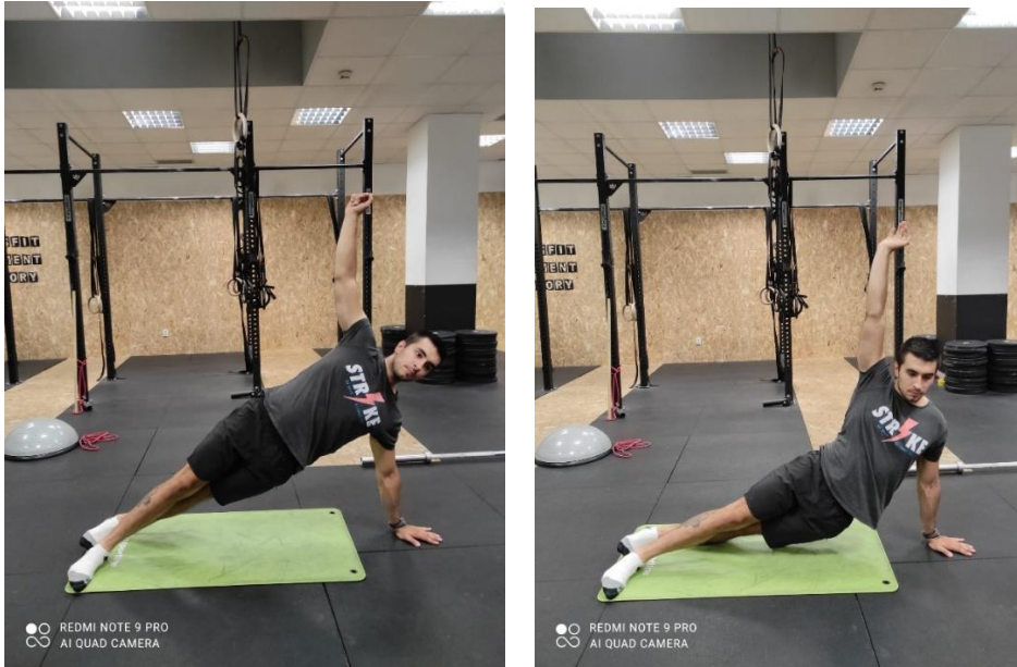
Slika 16.a., b. Spuštanje kukova u bočnu plenk

Tijekom vježbe spuštanje bokova u bočnom plenk (slika 16 a., b.) klijent stoji prema izgledu prikazanom na slici 16.a te polagano spušta kukove što bliže podu bez doticanja poda te se naglo podiže nazad u početni položaj.