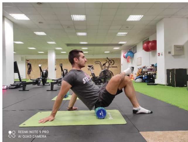
Slika 10. Istezanje uz pomoć valjka

Tijekom vježbe istezanje uz pomoć valjka (slika 10) klijent sjeda na valjak na bočnu stranu gluteusa i postavlja stopalo jedne noge na koljeno druge noge. Cilj je istegnuti medijalni i lateralni gluteus.