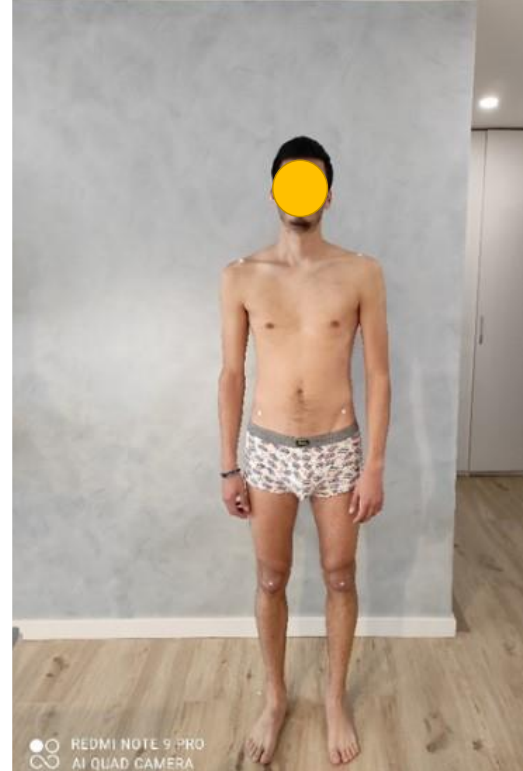
Slika 6. Anteriorna analiza posture