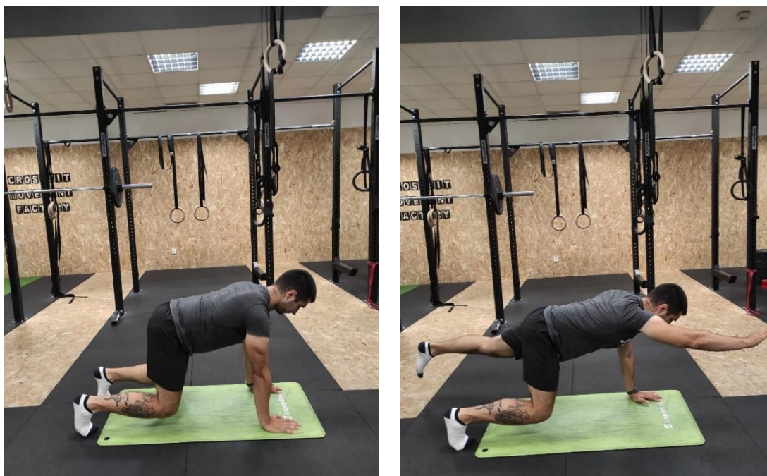
Slika 27 a., b. Četveronožno ispružanje ruke i noge

Tijekom vježbe četveronožno ispružanje ruke i noge (slika 27 a., b.) klijent je na podu oslonjen na ruke i prste noge. Klijent se postavlja u pozu četveronoške te podiže koljena 10 cm od poda. Istovremeno ispruža suprotnu ruku i nogu uz očuvanje ravnoteže, bez narušavanja zauzetog položaja.