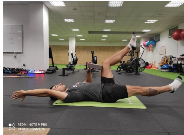
Slika 14.a, b. Deadbug s guranjem koljena

Tijekom izvođenja vježbe korak u stranu (slika 15) klijent postavlja elastičnu traku prema prikazu, s nogama u razini kukova blago savije koljena i napravi preгиb u trupu te radi korake u stranu.