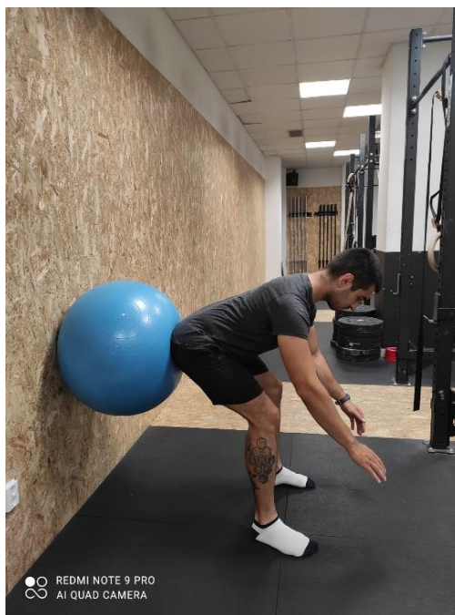
Slika 8. Sjed na loptu uz zid

Druga vježba u fazi 1 je sjed na loptu uz zid (slika 8). Klijent s blago raširenim nogama, i leđima okrenutima lopti i zidu, sjeda na loptu izvođeci pretklon u trupu. Zatim pokušava pomicati zdjelicu lijevo-desno pazeći da ne dođe do pomicanja koljena.