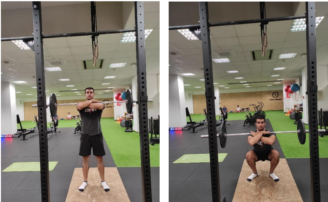
Slika 25. a., b. Prednji čučanj

Tijekom vježbe prednji čučanj (slika 25 a., b) klijent držeći šipku ispred tijela na ramenima (slika 25a.) izvodi vježbu čučanj na način da spušta kukove ispod zgloba koljena te održava uspravan položaj tijela.