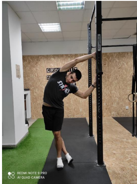
Slika 9. Istezanje u stranu

Treća vježba u prvoj fazi kineziterapijskog tretmana je istezanje u stranu (slika 9). Klijent se drži rukama za metalnu šipku smještenu postranično. Nogu postavlja iza druge, radeći luk tijelom istežući m. quadratus lumborum , m. gluteus medialis i TFL.