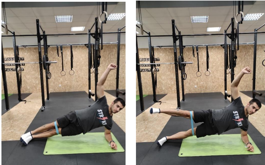
Slika 24. Škare u bočnom plenkicu

Klijent zauzima pozu bočnog plenkica (slika 24) s elastičnom gumom zavezanom iznad koljena te održavajući tu pozu podiže gornju nogu što više može te je polagano vraća natrag.