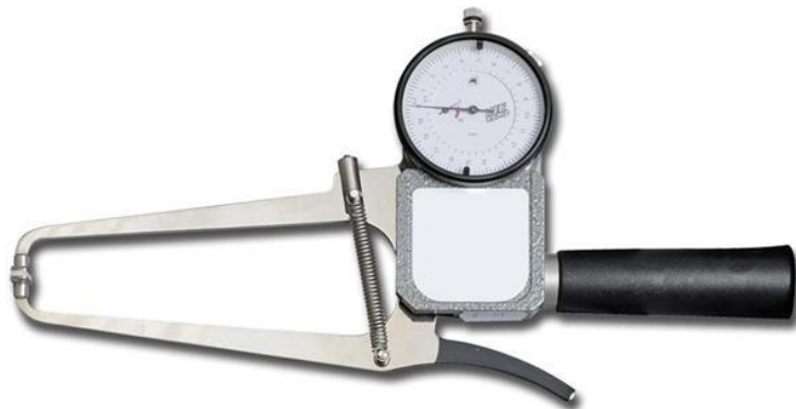
Slika 2. Kaliper, uređaj za mjerenje kožnih nabora