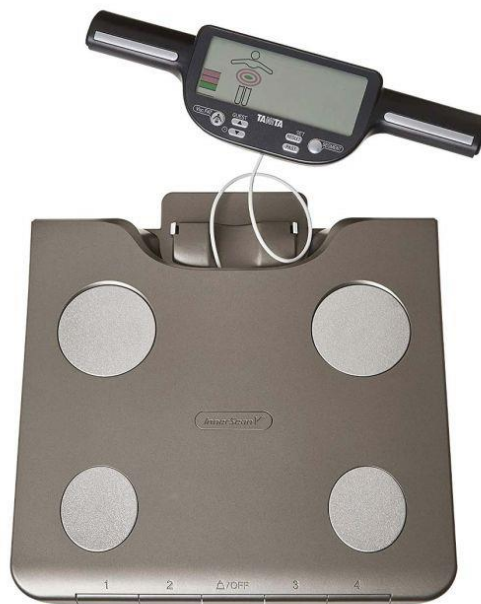
Slika 4. Vaga koja radi na principu bioelektrične impedancijske analize [izvor: https://www.physiosupplies.eu/tanita-bc601 , posjećeno: 10.09.2021.]