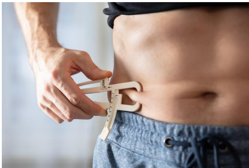
Slika 3. Mjerenje kožnih nabora trbuha kaliperom (izvor: https://www.fitness.com.hr/mrsavljenje/savjeti/Metode-za-mjerenje-postotka-masti-u-tijelu.aspx posjećeno: 02.09.2021.)