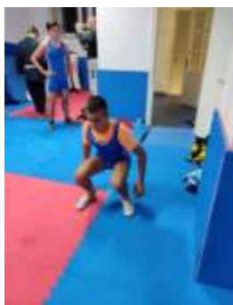
Stoj ispucavanje 34.