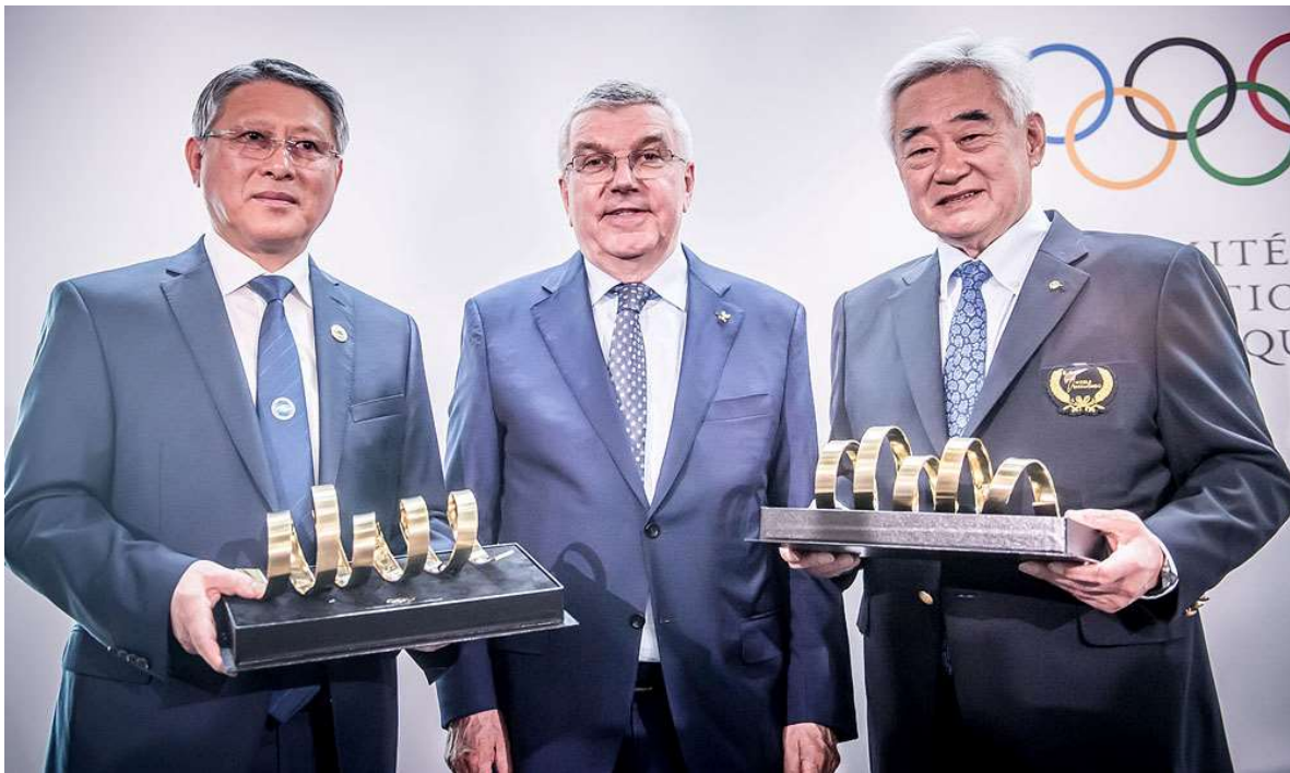
Slika 6. Obilježavanje 25. godina uvrštavanja Taekwondo u Olimpijski program, Lousanne, Švicarska (11. travnja 2019.)

2019. godinu obilježava proslava 25. godišnjice uključivanja Taekwondo u Olimpijski program. U sklopu obilježavanja obljetnice održane su zajedničke demonstracije tijekom travnja u Olimpijskom muzeju u Lausannei (11. travnja) na simboličan datum uz prisustvo Predsjednika MOKa, prostorima UNa kao simbolu jedinstva, suradnje i mira u Ženevi (12. travnja) i Beču (5. travnja). Ideju za ovakav zajednički nastup dao je WT predsjednik Chungwon Choue a podržao ju je ITF predsjednik Ri Yong Son. Moto ovih nastupa je “Jedan svijet, jedan Taekwondo”.