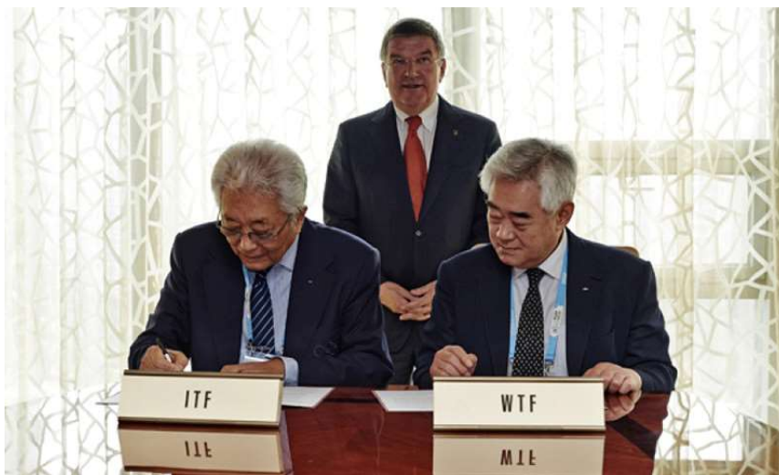
Slika 1. Potpisivanje Protocol of Accord, Nanjing, Kina (21. kolovoz 2014.)

Bacha potpisao je sporazum kojim se formalno definira sve dogovoreno na sastanku u Hamburgu. Sporazum je otvorio put konkretnim aktivnostima a često je bio iterpretiran i kao početak ujedinjavanja dviju federacija. No ipka, Predsjednik WTFa dao je odmah jasnu informaciju kako potpisano sporazum ni u kojem segment ne podrazumijeva ujedinjavanje ITFa i WTFa u bilo kojem obliku. Naglasio je kako postoji niz problema koje treba riješiti između ITFa i WTFa prije nego osnove navedenog sporazuma budu u potpunosti implementirane. No ipak sporazum u svojem obliku, sa svojim ciljem i politički izvrsnom tajmingu predstavlja izrazito važan korak naprijed u ispunjavanju vizije Taekwondo pokreta.