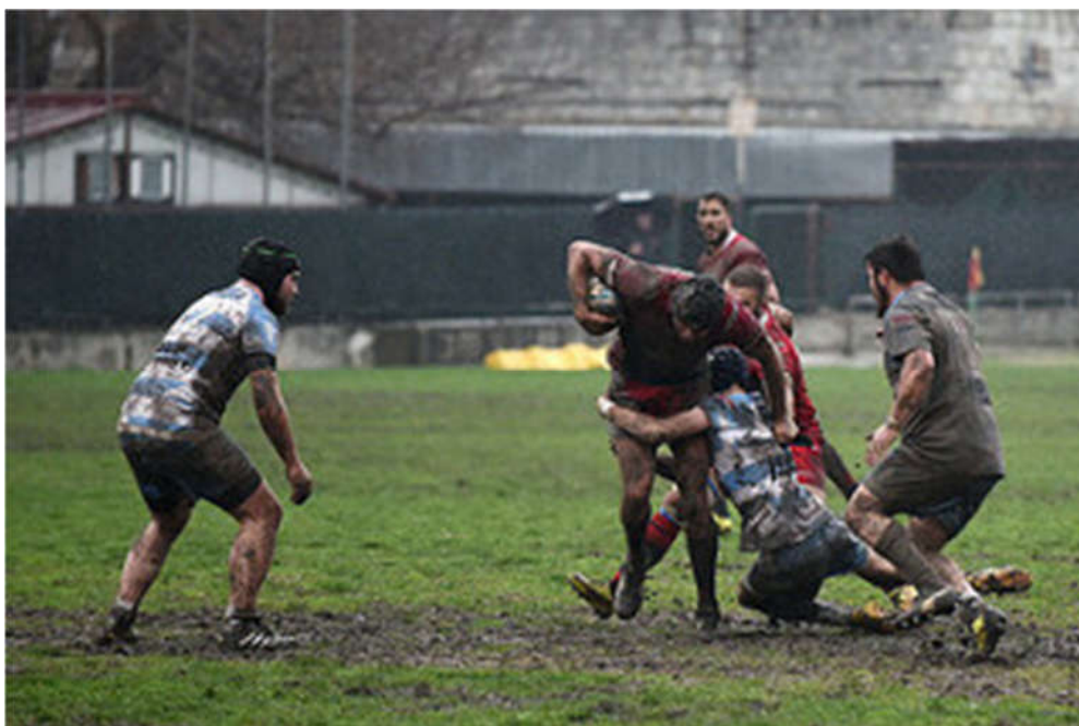
Slika 7. Obaranje

utakmice). U ovom istraživanju 56,76 % ozljeda dogodilo se pri obaranju što odgovara rezultatima u sličnim već objavljenim istraživanjima koja se bave ozljedama u ragbiju. U prospektivnom istraživanju amaterskih ragbi igrača na Novom Zelandu 47,9 % ozljeda dogodilo se pri obaranju (Schneiders i sur., 2009). Čak 28,8 % posto ozljeda zadobili su obarači (oni igrači koji obaraju), što je slično rezultatima i ovdje prikazane studije (29,73%). Oboreni igrači su oni koji su zadobili 19,0 % svih ozljeda dok se u prikazanom istraživanju 27,03 % ozljeda dogodilo oborenom igraču. U nešto starijem istraživanju novozelandskih amatera (Bird i sur., 1998) 40 % svih ozljeda je počinjeno u obaranju. U retrospektivnom domaćem istraživanju hrvatskih i slovenskih ragbijaša ukupno 47,62 % svih ozljeda dogodilo se pri obaranju, od toga su obarači zadobili 26,99 %, a oboreni igrači 20,63% svih ozljeda (Babic i sur., 2001). Kako je ovo bilo retrospektivno istraživanje, možemo pretpostaviti da su igrači zaboravili kako su se zapravo ozlijedili, a vjerujemo da se u gotovo dvadeset godina između ova dva istraživanja i broj obaranja na utakmicama povećao pa samim tim i broj ozljeda uzrokovanih obaranjem. U istraživanju australskih profesionalaca postoji ozlijeđenih igrača pri obaranju su još su veći (58,7%) (Bathgate i sur., 2002).