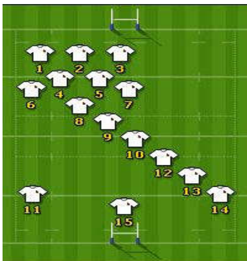
Slika 5. Prikaz igrača na terenu