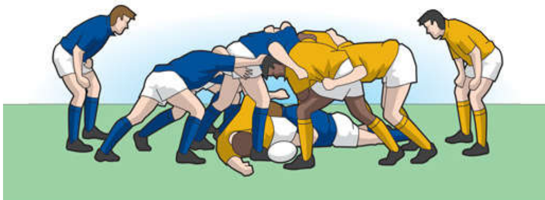
Slika 2. Otvoreni skup

Postizanje zgoditka onemogućava 15 protivničkih igrača koji mogu obarati samo onog igrača koji nosi loptu. Kada je igrač s loptom oboren na tlo, on loptu mora pustiti (ili je prije dodati) tako da se može ostvariti princip borbe za loptu. Ako su suigrači igrača koji je oboren u blizini, oni će pokušati spriječiti protivnike da dođu do lopte i tako nastaje otvoreni skup ( ruck ). U otvorenom skupu protivnici pokušavaju odgurati jedni druge preko igrača koji ostavio loptu i leži na tlu da bi tako ponovno došli u posjed lopte.