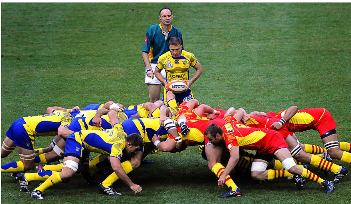
Slika 4. Skup