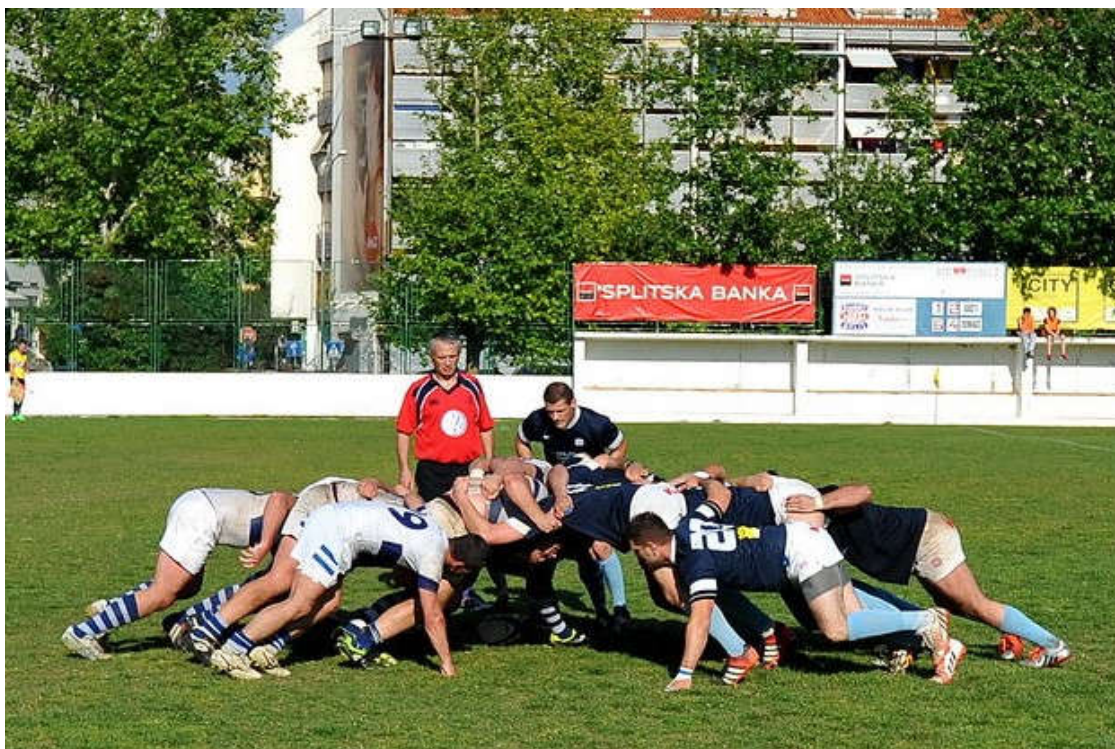
Slika 8. Ubacivanje lopte u skup

su u skupu jedini u kontaktu s protivničkim igračima pa tako češće ozljeđuju rame (Headey i sur., 2007) kojim se i obara.