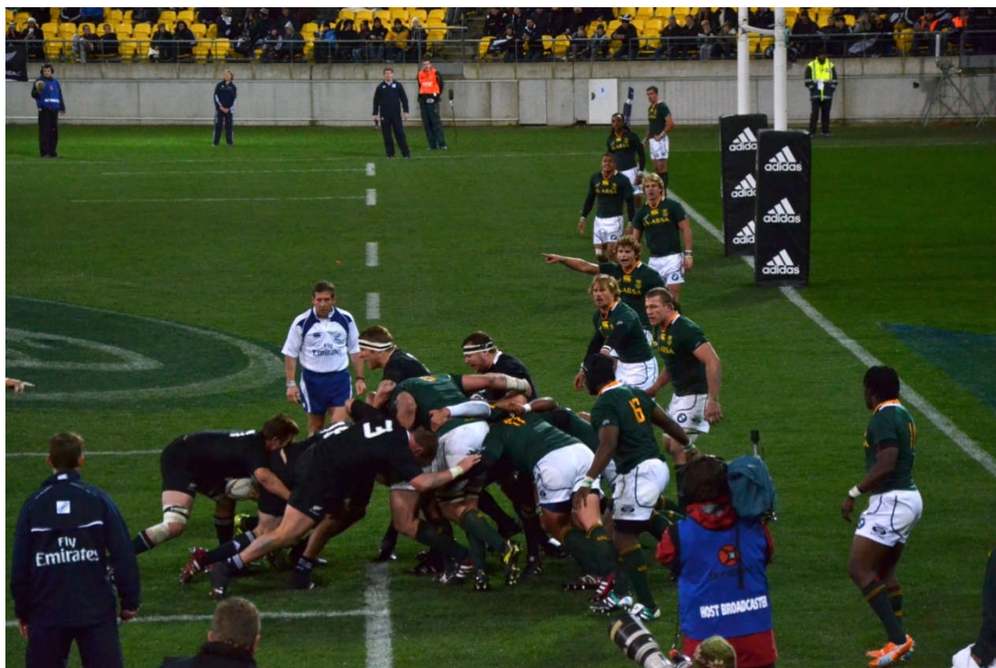
Slika 3. Mlin

Skup je način ponovnog započinjanja igre nakon zaustavljanja uzrokovanog manjom povredom Pravila (naprimjer, naprijed dodana lopta ili lopta koja se naprijed odbila od tijelao) ili ako u otvorenom skupu ili mlinu ništa nije moguće napraviti s loptom. Skup služi da sakupi sve igrače skupa i spojke na jednome mjestu na terenu, otvarajući igračima linije mogućnost da organiziraju napad koristeći se prostorom koji se stvara na drugim dijelovima terena. Momčad koja ubaci loptu u skup obično zadržava loptu jer sidraš i spojka mogu uskladiti svoje postupke (WR, 2015a). Skup čine po 8 igrača skupa svake ekipe koji se onda natječu za loptu koja mora biti ubačena u kanal po sredini formiranog skupa između prvih redova. Kada jedna momčad dođe u posjed lopte (gurajući cijeli skup ili spretnom igrom sidraša) onda momčad koja je u posjedu može napredovati guranjem protivnika ili kada lopta dođe do igrača druge linije ili samog posljednjeg igrača skupa (čepa), onda je on može uzeti i igrati, a najčešća je opcija je da je spojka uzme i igra dalje s njom.