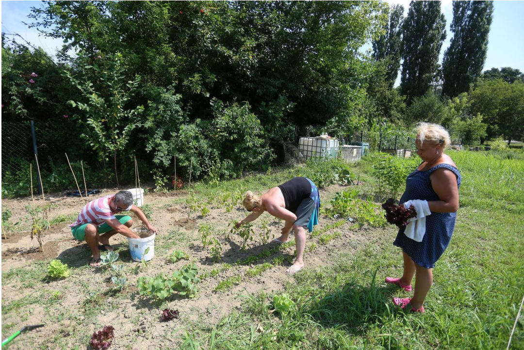
Slika 7 Vrtlarenje