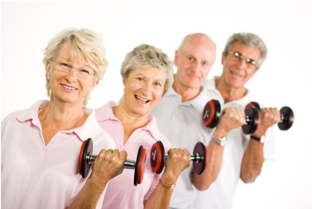
Slika 10 Vježbe snage