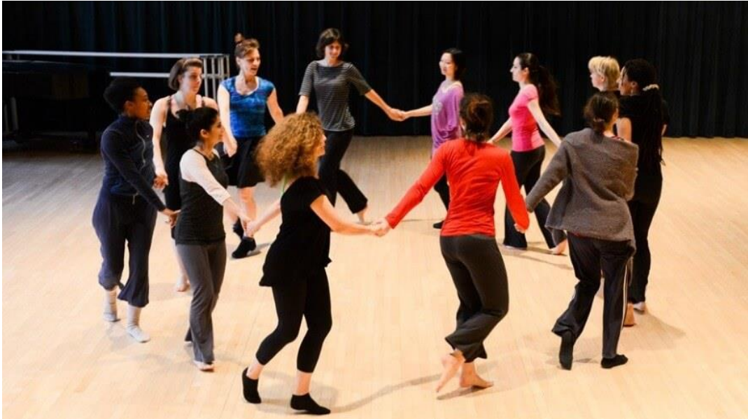
Slika 9 Ples