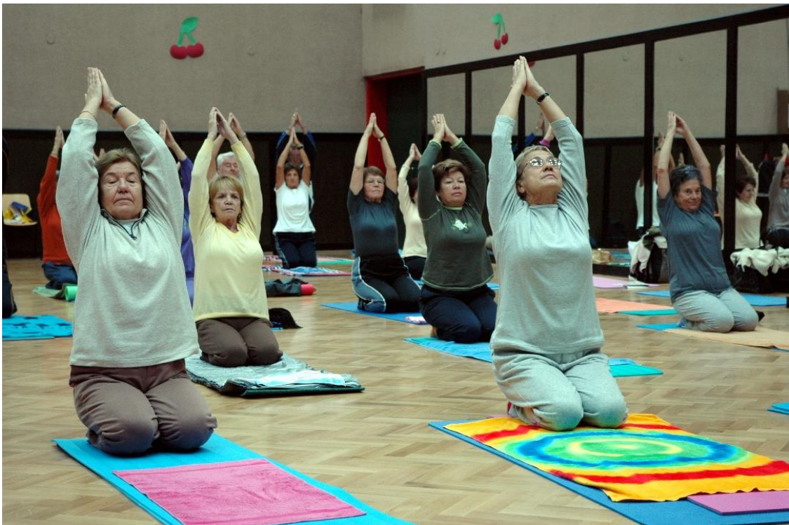
Slika 8 Joga za starije osobe