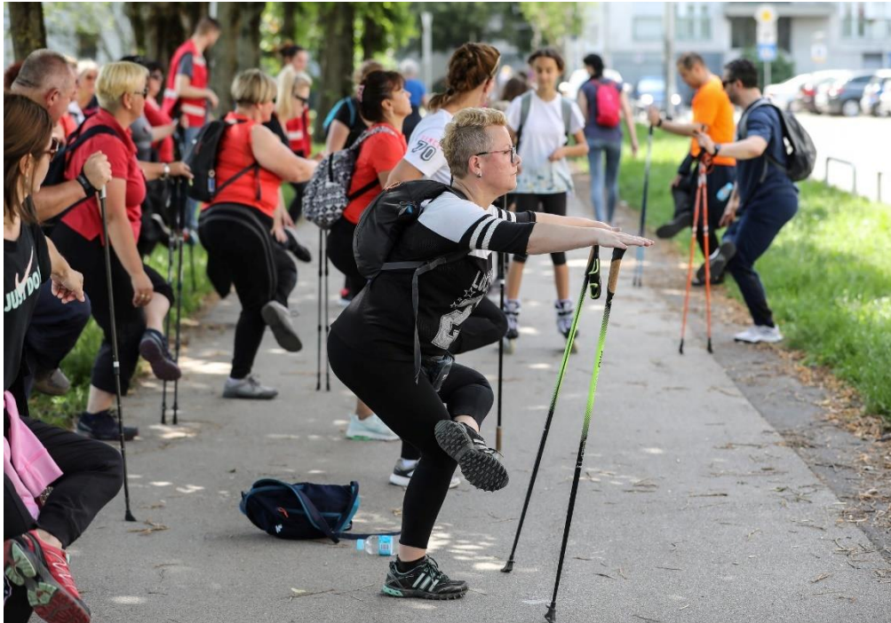
Slika 2 Nordijsko hodanje