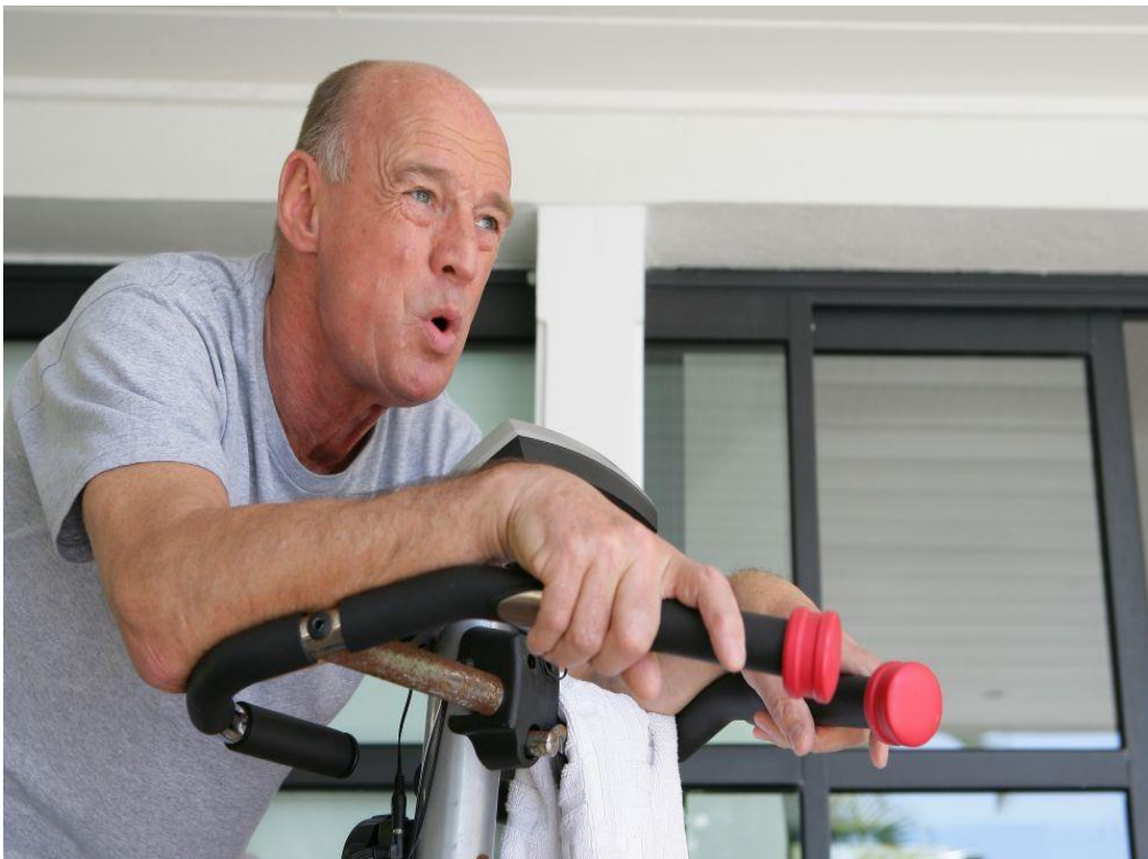
Slika 4 Bicikliranje na sobnom biciklu