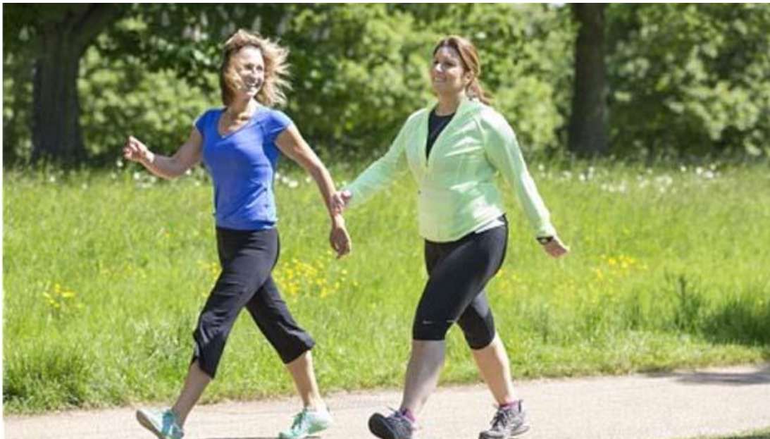
Slika 1 Hodanje