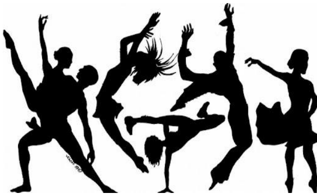
Slika 3. Ples