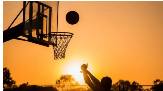
Slika 9. Košarka