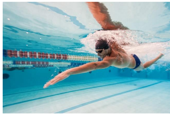
Slika 4. Plivanje