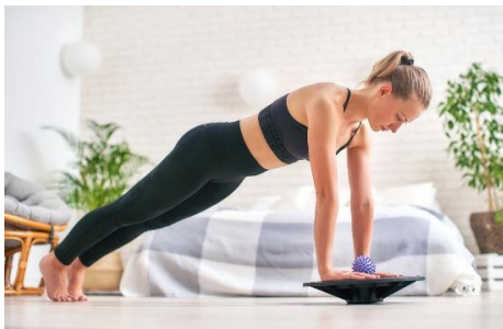
Slika 12. Plank na balns ploči

bi se poboljšala sposobnost održavanja ravnoteže u stacionarnim i dinamičnim situacijama. Jedna od osnovnih vježbi je stajanje na jednoj nozi, koje se može unaprijediti zatvaranjem očiju ili stajanjem na nestabilnoj površini poput balansne ploče ili jastuka, čime se dodatno izazivaju mišići stabilizatori kralježnice. Hodanje po zamišljenoj ravnoj liniji (tandem hod) zahtijeva koncentraciju i preciznost, te poboljšava kontrolu nad tijelom. Vježbe poput "joge drvo" (Tree Pose) gdje se stoji na jednoj nozi dok se druga noga oslanja na unutarnju stranu bedra ili lista, istovremeno podižući ruke iznad glave, povećavaju statičku ravnotežu i fokus. Dinamične vježbe, poput podizanja koljena naizmjenično do visine kuka dok se stoji na jednoj nozi ili iskoraka naprijed i nazad, poboljšavaju ravnotežu u pokretu i jačaju mišiće nogu. Korištenje rekvizita, kao što su balansne ploče ili elastične trake, dodatno izaziva ravnotežu i angažira duboke mišiće trupa. Plesne vježbe i aktivnosti koje uključuju brze promjene smjera također su učinkovite pri poboljšanju ravnoteže, koordinacije i fleksibilnosti. Integriranjem vježbi ravnoteže u redoviti fitness program može se značajno poboljšati ukupna tjelesna kontrola, smanjiti rizik od padova i ozljeda te povećati sposobnost za obavljanje svakodnevnih aktivnosti s većom sigurnošću i učinkovitošću.