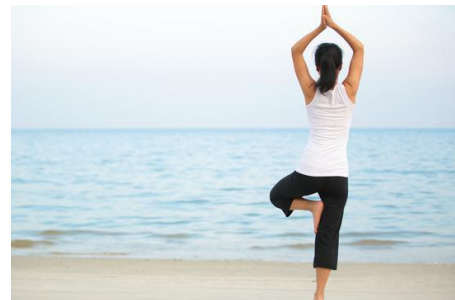
Slika 13. Yoga Tree Pose