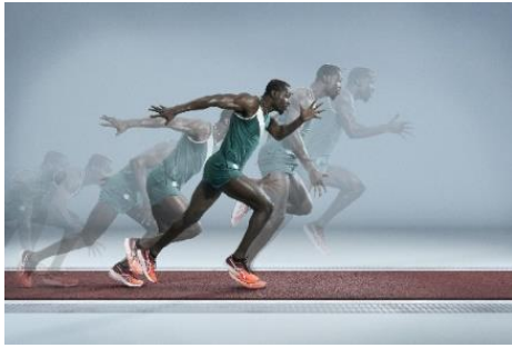
Slika 5. Sprint