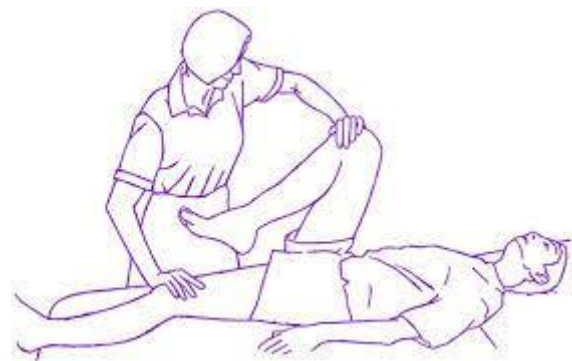
Slika 11. PNF Istezanje