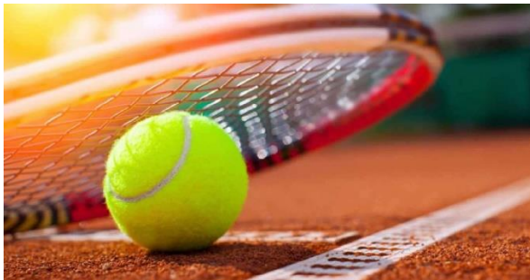
Slika 8. Tenis

Također, sportovi poput tenisa, košarke i plesa pomažu u jačanju mišićno-vezivnog tkiva jer uključuju brze promjene smjera i skakanje, što dodatno opterećuje kosti. Redovito vježbanje snaženja mišićno-koštanog sustava važno je za sve dobne skupine, posebno za djecu i adolescente tijekom faze rasta, te za starije osobe radi prevencije osteoporoze i smanjenja rizika od prijeloma. Optimalni učinak postiže se kombiniranjem različitih vrsta vježbi kako bi se osigurala ravnomjerna raspodjela stresa na različite dijelove skeleta, čime se potiče ravnomjeran rast i jačanje kostiju. Osim fizičke aktivnosti, dovoljan unos kalcija i vitamina D ključan je za zdravlje kostiju, čime se dodatno podržava učinak vježbi snaženja mišićno-koštanog sustava.