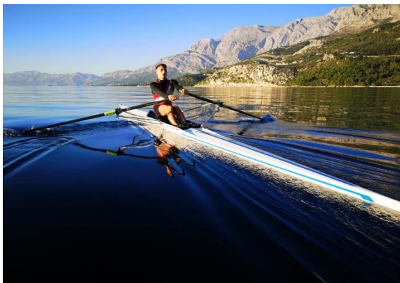
Slika 1. Veslanje

Aerobna tjelesna aktivnost, poznata i kao kardio vježba, uključuje kontinuirane, ritmičke aktivnosti koje povećavaju otkucaje srca i disanje tijekom duljeg vremenskog razdoblja. Ove aktivnosti primarno koriste velike mišićne skupine te su ključne za održavanje kardiovaskularnog zdravlja i cjelokupne fizičke kondicije. Preporučuje se barem 20 minuta tjelesne aktivnosti visokog intenziteta ili 30 minuta umjerenog intenziteta što ovisi o fizičkoj spremi i ciljevima vježbača. Hodanje, trčanje, plivanje, vožnja bicikla, veslanje ili ples samo su jedne od mogućih aktivnosti koje spadaju u ovu kategoriju. Aktivno bavljenje njima generalno utječe na poboljšanje kardiovaskularnog sustava, respiratornog sustava, mentalnog zdravlja, izdržljivosti, snage mišića, kondicije te pospješuje metabolizam, odnosno potiče sagorijevanje masti i kalorija. Redovita aerobna aktivnost može značajno poboljšati kvalitetu života i smanjiti rizik od mnogih kroničnih bolesti kao što su kardiovaskularne bolesti, neki oblici karcinoma, osteoporoze i osteoartritisa, pretilosti te autoimunih bolesti i stanja (npr. depresija). WHO preporučuje ukupno 150 minuta tjelesne aktivnosti umjerenog intenziteta ili 75 minuta visokog intenziteta tjedno.