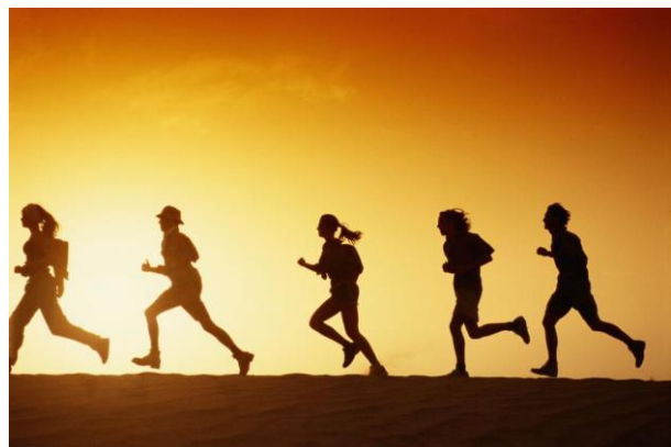
Slika 2. Trčanje