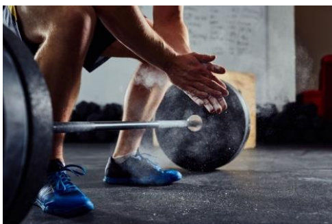
Slika 7. Dizanje utega

Aktivnosti snaženja mišićno-koštanog sustava uključuju vježbe koje primjenjuju stres na kosti, potičući ih na jačanje i povećanje gustoće. Ove aktivnosti uključuju treninge s utezima, kao što su dizanje utega i vježbe otpora, te aktivnosti s vlastitom težinom, poput hodanja, trčanja, skakanja, čučnjeva i iskoraka. „Kada sportaš tijelo optereti s velikim vanjskim opterećenjem (utezima), ono se postepeno prilagođava na višu razinu mišićne jakosti. S druge strane, ako trenira s manjim opterećenjima i većim brojem ponavljanja, razvijat će lokalnu mišićnu izdržljivost.“ „Kako bi sposobnosti napredovale, odnosno kako bi se postigle optimalne fizičke, fiziološke i izvedbene adaptacije, opterećenje treba progresivno i konstantno podizati.“ (Foretić, Veršić). Shodno tome, dolazi do promjena kod sportaša te se one mogu iščitati iz perspektive: stabilizacije, mišićne izdržljivosti, jakosti, snage i hipertrofije. Sve to omogućuje optimalnu potporu zglobovima, pravilnu posturu, proizvodnju i održavanje sile duži vremenski period te povećanje broja mišićnih vlakana i njihovog poprečnog presjeka.