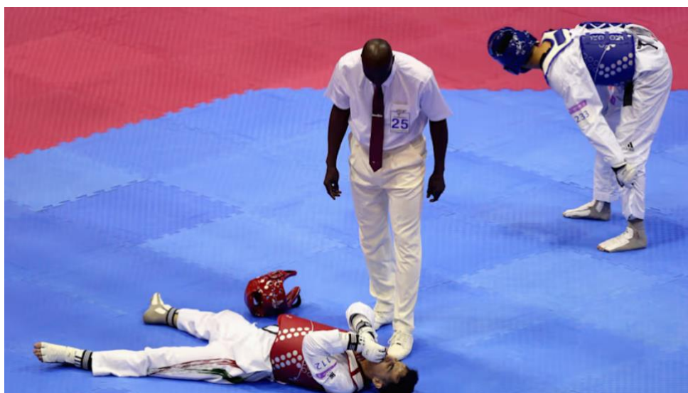
Slika 10. Sudac može zaustaviti borbu zbog ozljede natjecatelja

Sudac može prekinuti natjecanje ako je natjecatelj oboren protivnikovom legitimnom tehnikom i ne može nastaviti natjecanje ili radi zaštite natjecateljeve sigurnosti. Liječnička komisija također može prekinuti meč zbog ozljede natjecatelja.