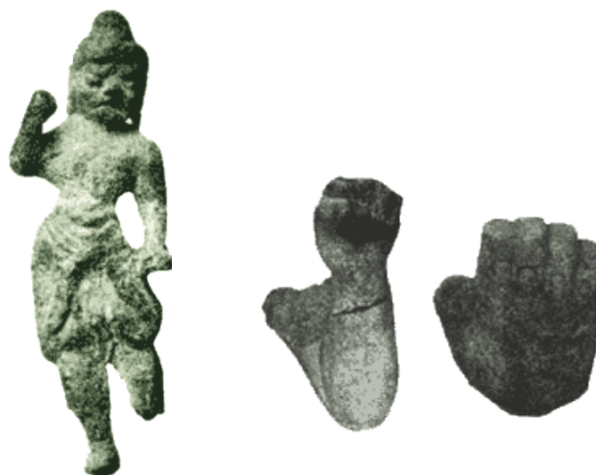
Slika 4. Brončana statua Kungang ratnika i oblici šake istog ratnika