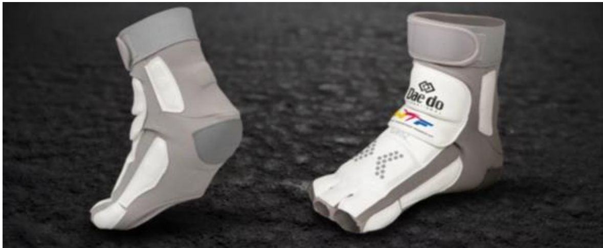
Slika 1. E-Foot Protector

Ovaj sustav znači da je borcu potrebna ispravna tehnika prilikom izvođenja udarca kako bi se "uključio senzor" i potrebna mu je odgovarajuća snaga za registraciju udarca. Uklanja točke koje se registriraju s koljenima, tijelima koja se sudaraju i mekim sensorima koji samo dodiruju štitnik. Minimalna snaga također se može prilagoditi podjelom težine.