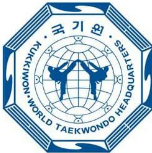
Slika 6. Kukkiwon, južnokorejska nacionalna Taekwondo akademija

Postoji teorija s dosta sljedbenika koja istražuje temelje taekwondo u japanskoj borilačkoj vještini karateu. Tvrdnje se temelje na činjenicama da je tijekom japanske aneksije nametnuta zabrana prakticiranja korejskih borilačkih vještina. Još jedna glavna linija koja slijedi teoriju i koja je ranije navedena je da je većina ranih kwan majstora trenirala karate. Pobornici teorije nalaze sličnosti između dviju borilačkih vještina kako u udarcima, tako i u strukturi i pokretima u formama - sustavu blokova, udaraca rukama i nogama koji se izvode u strogom slijedu. Termin koji se koristi za profiliranu školu borbe "Kwan" odgovara nazivu prve karate škole – Shotokan (na korejskom Song-do-kwan). W. Kang i K. Lee (1999) sažimaju da su sve borilačke vještine koje se trenutno prakticiraju u Koreji ili japanske ili kineske, s iznimkom Taekwondo. Song Hyeong-sok u svojim djelima tvrdi da korijen taekwondo možemo povezati s karateom, no u svom razvoju korejska borilačka vještina gradi vlastiti identitet i jedinstvenost. Primjenom retrospektivnog pristupa nalazimo dosta sličnosti između karatea i taekwondo. Možemo ih pronaći u uniformama koje se koriste za trening, nalazimo ih u sustavu tehnike za blokiranje, udarac šakom, udarac i udarac nogom. Također ih možemo pronaći u terminologiji tehnika i više. Istražujući teoriju o podrijetlu taekwondo iz japanskog karatea dolazi se do brojnih podataka koji potvrđuju tvrdnje povijesno, kronološki i činjenično.