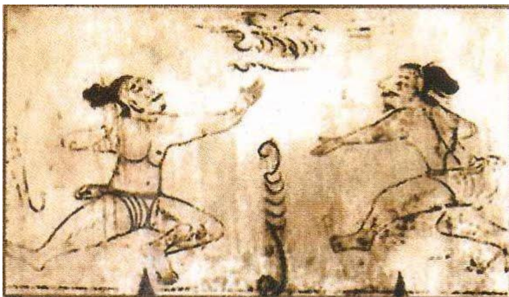
Slika 3. Mural na Samsil grobnici prikazuje dvojicu ratnika koji se bore licem u lice u taekkyon (taekwondo) stavu

Glavni povijesni aspekt je percepcija da je taekwondo borilačka vještina koja je očuvala tradiciju drevnih korejskih borilačkih sustava koji su se prenosili generacijama. Zidne slike, kipovi, stari književni izvori, freske i druga otkrića arheoloških aktivnosti koriste se kao temelj za te tvrdnje. Tijekom 6. stoljeća formira se posebna skupina. Oslanjala se na moralni i etički kodeks – osobnu disciplinu, humanost, moralnost, religiju, služenje domovini itd. Jedinica se zvala Hwarang “briljantni vitezovi dinastije Silla” (Green, 2001). Prema H. Yeonu i J. Gerrardu (2000), članovi Hwaranga imali su iznimno znanje u društvenim, vjerskim, medicinskim i drugim područjima. Uz obavljanje svojih glavnih zadaća, Hwarang je javnosti prezentirao i zabavne igre. Elementi jedne od ovih igara – Taekkyon rezoniraju s Taekwondo. Cilj igre je održati ravnotežu i oboriti protivnika na tlo isključivo nožnim tehnikama. Još jedna borilačka vještina povezana s nastankom Taekwonda je Subak. U prijevodu znači "borbene tehnike rukama". U prilog tezi o drevnom podrijetlu Taekwonda piše da je on proizvod dugogodišnje tradicije i transformacije Sunbae (iz vremena Goguryeo kraljevstva), Subaka (Goryeo kraljevstva) i Taekkyona, uveden na kraju dinastije Chosun.