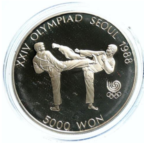
Slika 7. Korejski novac s motivom taekwondoa i Olimpijskih igara u Seulu

( https://www.ebay.com/itm/325007266140 )