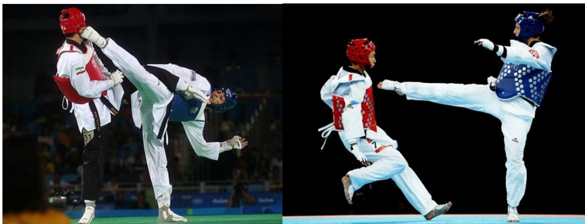
Slika 8. Udarac nogom u glavu i trup

1 bod se dodjeljuje za svaki "gam-jeom" dat protivniku