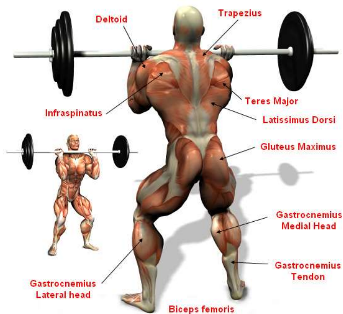
Slika br. 7 (Anatomska struktura nabačaja)

Što se tiče anatomske analize nabačaja koriste se različite grupe mišića. Agonisti su m. erector spinae i m. quadriceps femoris. Od sinergista u nabačaju sudjeluju m. triceps surae, m. trapezius i m. gluteus maximus, a stabilizatori su m. deltoides, p. deltoides i gornji dio leđa.