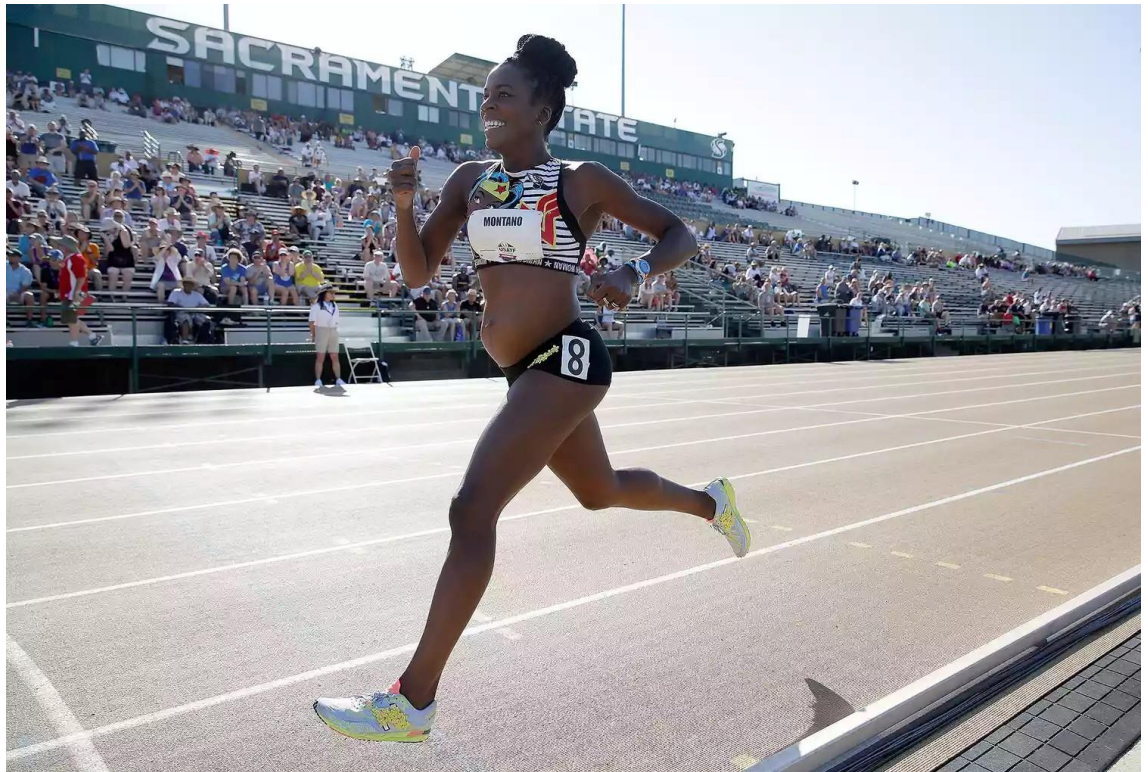
Slika 5. Alysia Montaña

https://people.com/thmb/qJRwBbLZEim8xvGKIT3l6R485nM=/1500x0/filters:no_upscale():max_bytes(150000):strip_icc():focal(999x0:1001x2):format(webp)/alysia-montano-2-1-4678bcd274704b3392118efbbe60af13.jpg