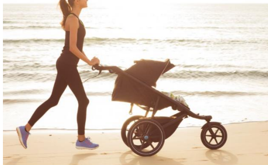
Slika 4. Trčanje s kolicima i obje ručno pridržavanje

https://encrypted-tbn0.gstatic.com/images?q=tbn:ANd9GcSMOgReO_UJcmdFLAqSejNKiW3-fu7Zm69YE6dHdvy1Z5j3Qual93L4w8gYNwnOwLEJvVI&usqp=CAU