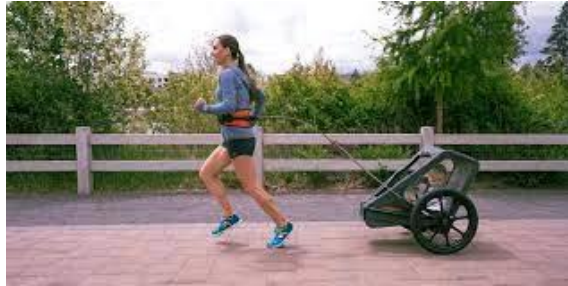
Slika 3. Trčanje s kolicima iza sebe (nemogućnost komunikacije s djetetom)

djece do godinu dana u trkaćim treninzima, pogotovo ako se radi o podlogama koje su neravne. Naravno, povratak trčanju ovisi o vrsti poroda, rezu i ostalim komplikacijama.