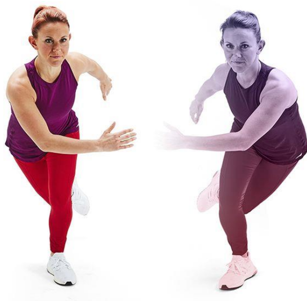
Slika 4 Primjer vježbe brzi klizač