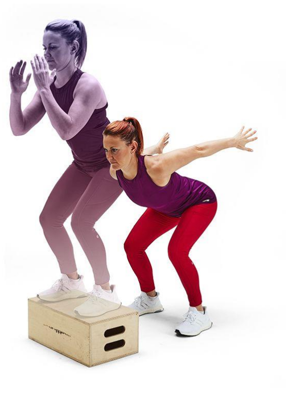
Slika 5 Primjer vježbe skok na kutiju