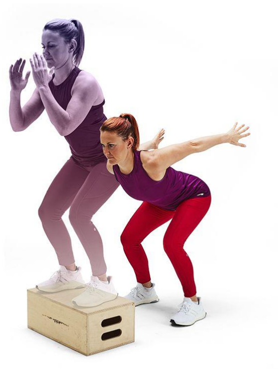
Slika 5 Primjer vježbe skok na kutiju