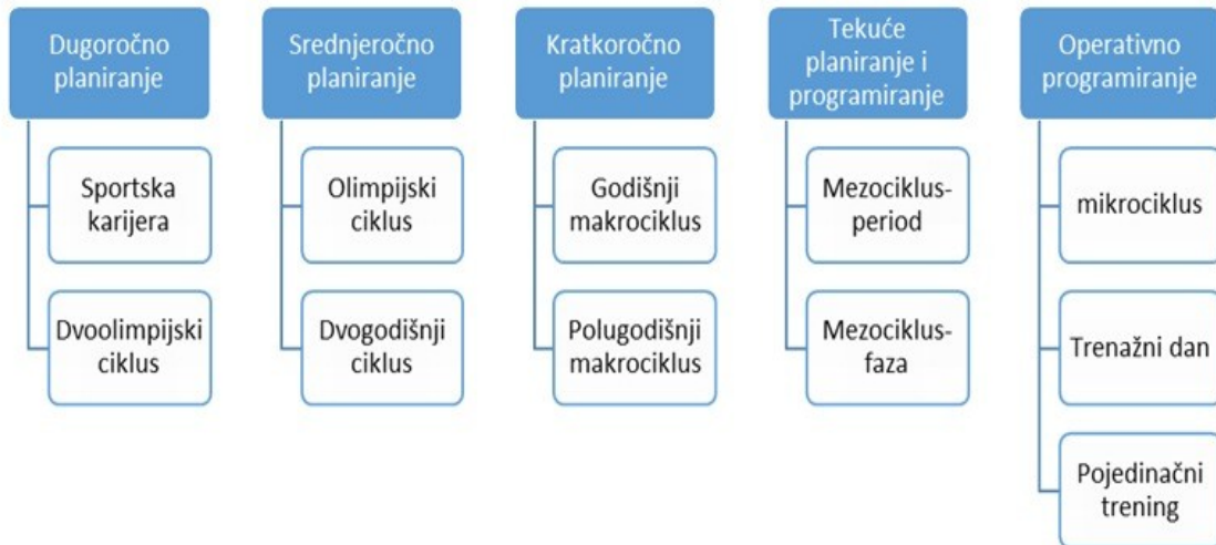
Prikaz 3. Dugogodišnje planiranje i programiranje treninga (Milanović 2009.)

Planiranje i programiranje se provodi na 5 nivoa sa njihovim podkategorijama: