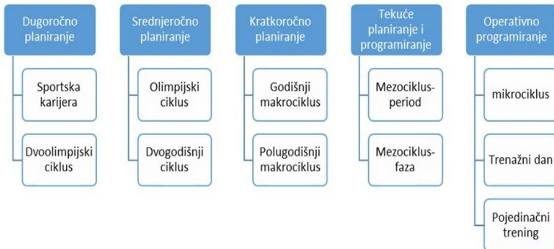
Prikaz 3. Dugogodišnje planiranje i programiranje treninga (Milanović 2009.)

Planiranje i programiranje se provodi na 5 nivoa sa njihovim podkategorijama: