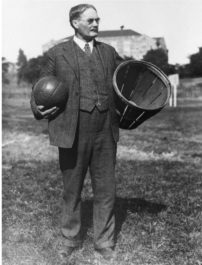
Slika 1. Tvorac košarke dr. James Naismith s košarkaškom loptom i jednom od prvih izvedenica koša (Anonymus, 2016)

Nastavnik tjelesnog odgoja, tada 30-godišnji Naismith, zajedno je s diplomantima Young Men's Catholic Association (YMCA) trenerske škole, putovao po svijetu i upoznao ljude s novonastalim sportom (Kermeci, 2017). Prilikom stvaranja nove igre, tvorac se morao voditi sljedećim uvjetima: može se igrati na svim školskim igralištima, igra mora biti privlačna radi lopte, mora imati stalni cilj te naizmjenično razvijati elemente napada i obrane. Prva struktura igre koju je Naismith osmislio sadržavala je neke osnovne elemente, prateći uvjete koje je postavio Gullick: dvije ekipe; lopta kojom se igra; igralište; planirano kretanje lopte prema cilju kao akcija napada; obrambene akcije; kazne zbog kršenja pravila igre (Fritz, 2019). Uz iznimku pravila vođenja lopte (uvedenog 1898.), 13 početnih pravila košarke nisu se značajno promijenila do danas: