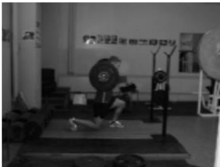
Slika 6. Iskoraci

4. Iskoraci - vježba se izvodi na način da šipku držimo na leđima. Jedna noga je ispred druge, i spuštamo dolje, pritom pazeći da nam koljeno prednje noge ne prelazi granicu prstiju na nogama. (Slika 6.)