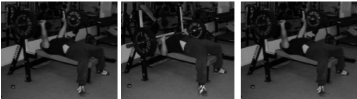
Slika 3. Bench press

1. Bench press ( 1RM = 100kg) – vježba se izvodi na način da sportaš legne na klupicu okrenut licem prema šipki, noge se nalaze uz klupicu. Šipku hvatamo ispruženih ruku malo šire od širine ramena, podižemo ju i spuštamo malo ispod prsa. Cilj je podignuti šipku gore i natrag u zadanom tempu i broju ponavljanja. (Slika 3.)