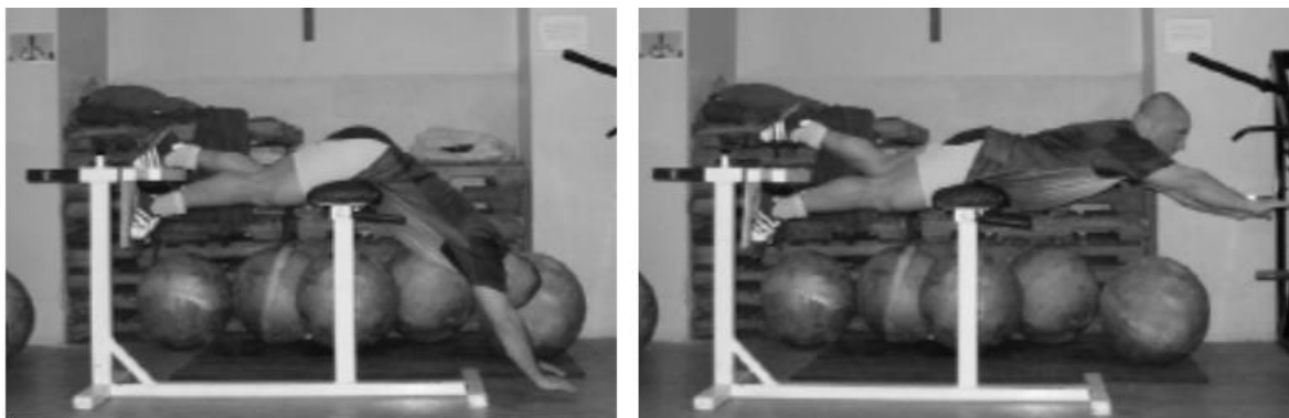
Slika 5. Jednonožna ekstenzija donjeg dijela leđa

3. Jednonožna ekstenzija donjeg dijela leđa – vježba se izvodi na način da sportaš leži na prsima na klupi, i jedna noga je zakačena na klupu. Laganim spuštanjem trupa prema tlu kontrahiramo stražnju stranu natkoljениčnih mišića. (Slika 5.)