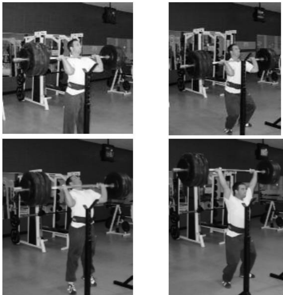
Slika 4. Push press

3. Jednonožna ekstenzija donjeg dijela leđa – vježba se izvodi na način da sportaš leži na prsima na klupi, i jedna noga je zakačena na klupu. Laganim spuštanjem trupa prema tlu kontrahiramo stražnju stranu natkoljениčnih mišića. (Slika 5.)