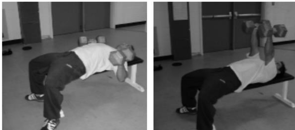
Slika 8. Bench press sa utezima

2. Bench press s utezima – vježba se izvodi ležeći na klupi, svaka ruka ima svoj uteg i držimo ih u razini donjeg dijela prsnog koša. Cilj je utege „ispaliti“ gore pod kontrolom tempa. (Slika 8.)