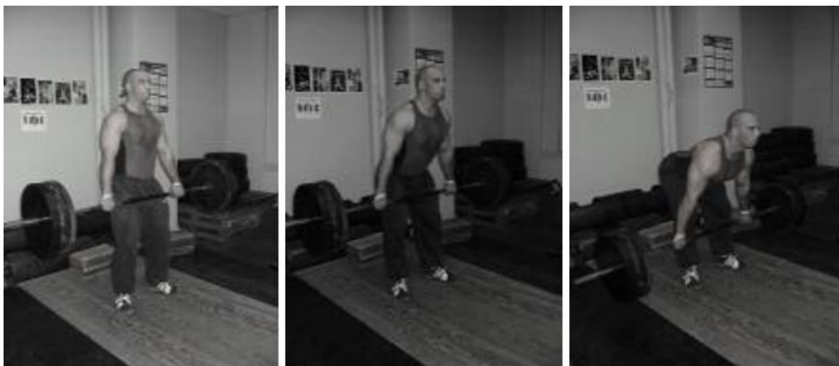
Slika 9. Rumunjsko „mrtvo“ dizanje

3. Rumunjsko „mrtvo“ dizanje – vježbu izvodimo na način da šipku držimo ispred tijela u razini kukova, malo šire od širine ramena. Šipku spuštamo put dolje na način da trup nagnemo naprijed, a kukove guramo natrag. Cilj je da šipku spustimo malo ispod koljena bez fleksije koljena. (Slika 9.)