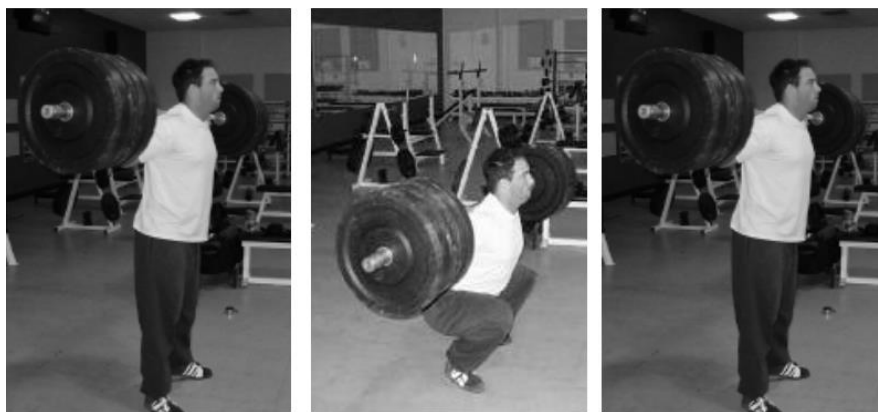
Slika 7. Stražnji čučanj

1. Stražnji čučanj – vježba se izvodi tako što šipku držimo na leđima, noge su malo šire od širine kukova ili u razni kukova ovisno o mobilnosti. Spuštamo stražnjicu dole i natrag (2), zadržavamo poziciju čučnja (3), a zatim se što brže vratimo u prvotni položaj (x). (Slika 7.)