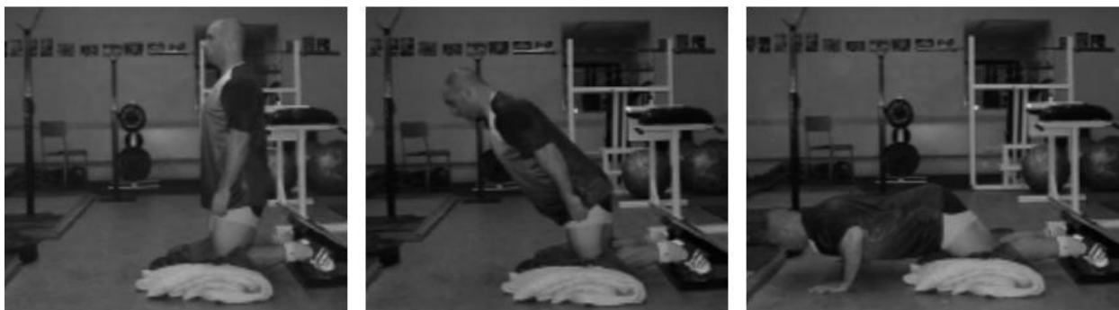
Slika 10. Nordic curl

1. Nordic curl – vježba se izvodi tako što noge zakačimo na spravu ili ako radimo sa grupom kao što su nogometaši, podijelimo ih u parove pa će međusobno jedan drugom pridržavati noge. Kontrolirano spuštamo trup prema tlu, aktivirajući stražnje lože. Kad dođemo do tla, rukama se odguramo kako bi se vratili u početni položaj. (Slika 10.)