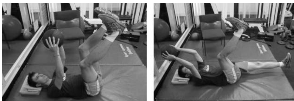
Slika 13. „Dead bugg“ sa medicinkom

4. „Dead bugg“ sa medicinkom – iz položaja „dead bugg“ dok držimo medicinku s obje ruke iznad glave, opružamo jednu nogu i ruke. Cilj je gurati nogu i ruke što dalje od tijela, aktivirajući abdominalne mišiće koji su zaduženi za stabilizaciju kralježnice. (Slika 13.)