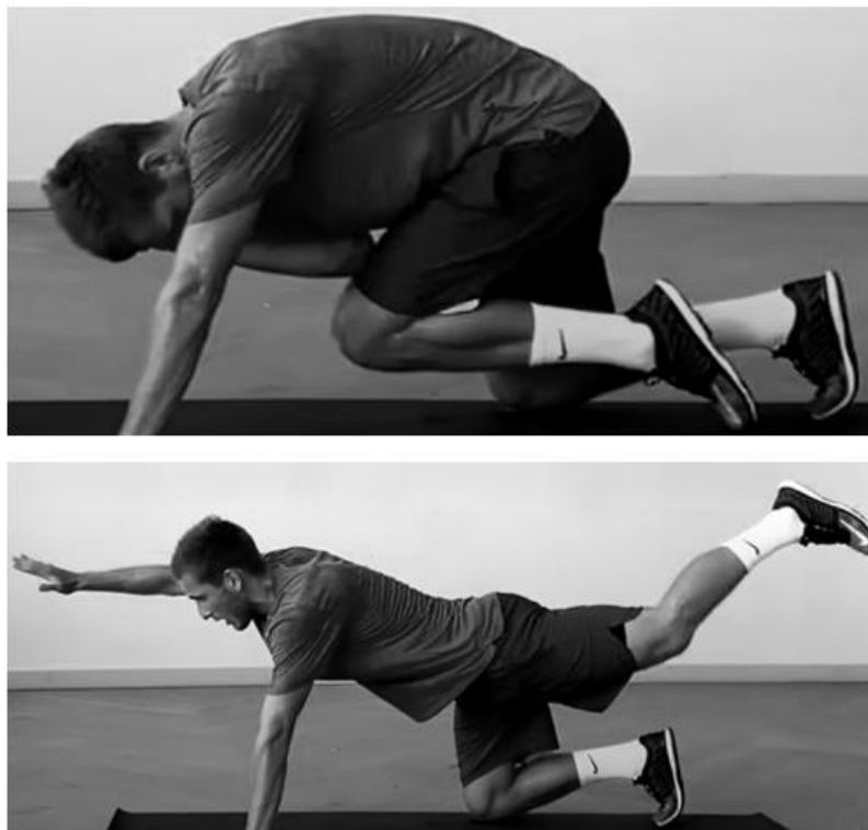
Slika 12. Supermen trbušnjaci

3. Supermen trbušnjaci – u početnom položaju smo naslonjeni na ruke i koljena, licem prema tlu. Ispružaju se suprotna ruka i noga i cilj je spojiti lakat ruke sa koljenom ispružene noge, i ponovno se opružiti. Nogometaš treba zadržati ravnotežu i paziti na stabilan položaj lumbalnog dijela kralježnice u trenutku opružanja. (Slika 12.)