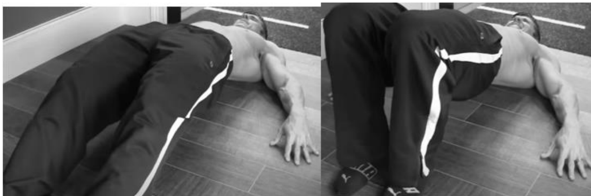
Slika 11. Privlaci klizanjem stražnjim dijelom natkoljenice

2. Privlaci klizanjem stražnjim dijelom natkoljenice - vježba se izvodi ležeći na tlu, noge su u širini kukova, a ruke sa strane tijela dodiruju tlo. Pete stopala privlačimo kukovima i kukove podižemo put gore, aktiviramo stražnjicu i trbušni zid kako ne bi došlo do nepoželjnog položaja kralježnice. Cilj vježbe je klizati nogama po tlu do opruženog položaja, bez da stražnjica dodirne tlo. (Slika 11.)