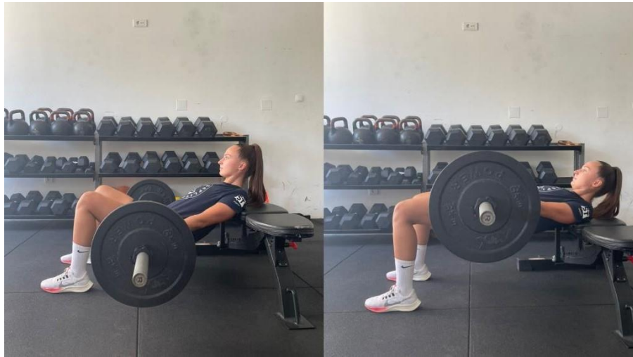
Slika 4 Hip thrust