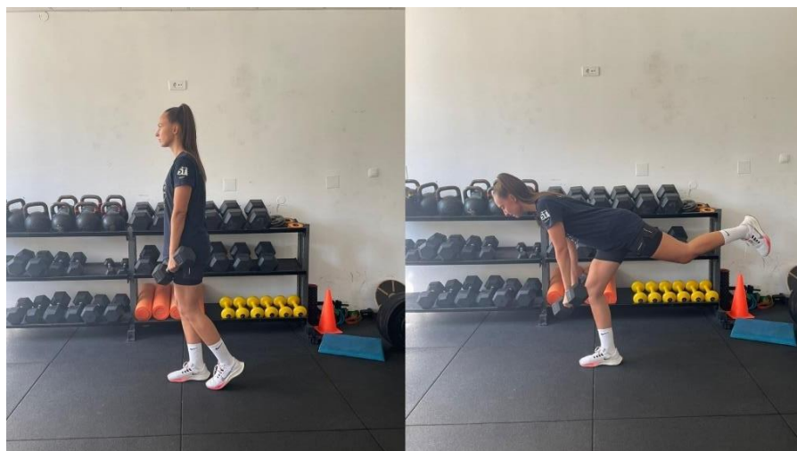
Slika 7 Jednonožno mrtvo dizanje

Osim rada na jakosti mišića nogu, unutar ove faze možemo odrađivati vježbe za jakost gornjeg dijela tijela bez ograničenja. Vježbe mogu biti balističke pri čemu se daje maksimalno ubrzanje tijelu, dijelu tijela ili vanjskom otporu, dominantno u koncentričnom načinu rada mišića.