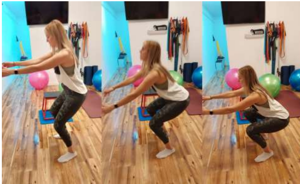
Slika 5: repetitivna snaga nogu

Čučnjevi u 60 sekundi. Vježba se izvodi na način da ispitanik drži noge u širini bokova, a broji se ponavljanje u kojem se ispitanik spusti u čučanj, do položaja sjeda. Cilj je napraviti što veći broj ponavljanja unutar 60 sekundi.