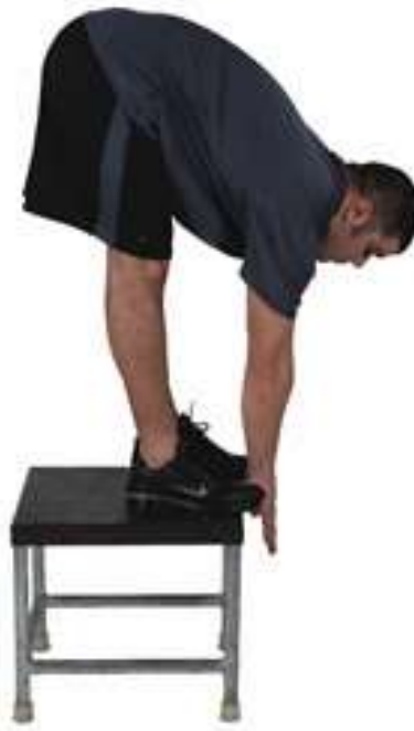
Slika 5: test fleksibilnosti – pretklon stojeći

Pretklon stojeći. Svrha ovog testa je testiranje fleksibilnosti donjeg dijela leđa i mišića stražnje lože. Potrebni rekviziti su klupica i centimetarska traka. Test se izvodi na način da ispitanik stoji potpuno ispruženih nogu, saginje se prema dole i dohvaća mjernu liniju koja se nalazi ispod stopala. Nakon 3 probna pokušaja, u četvrtom se zadrži u položaju najmanje 2 sekunde.