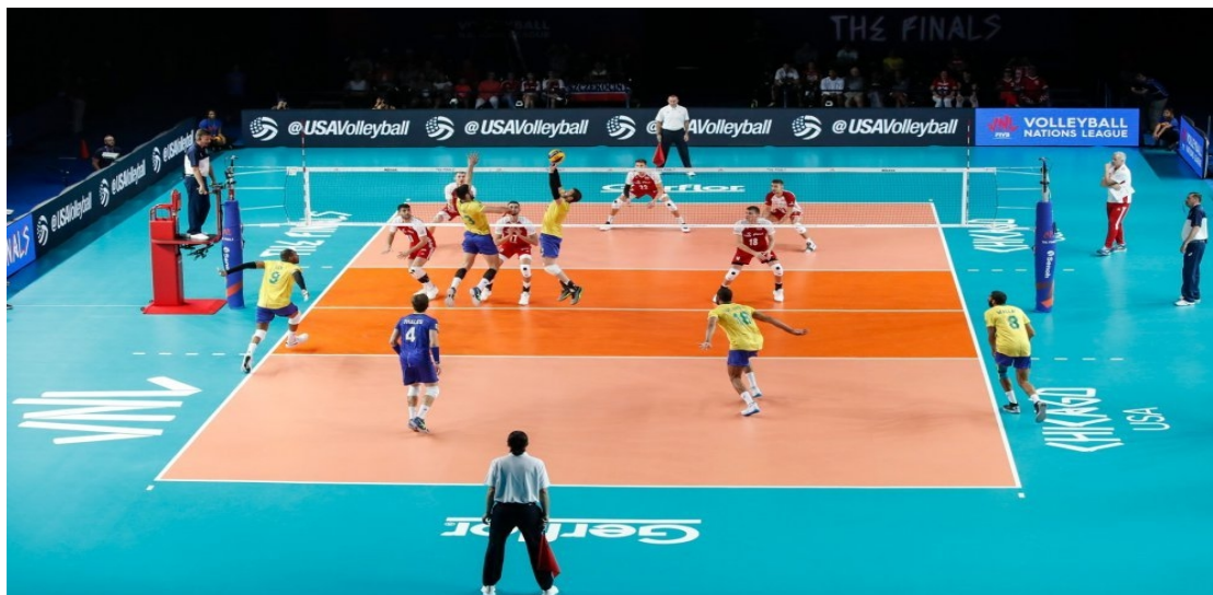
Slika 1. Odbojka

Koordinacija je sposobnost vremenski i prostorno efikasnog, te energetski racionalnog izvođenja kompleksnih motoričkih zadataka (Sekulić & Metikoš, 2007). To je sposobnost upravljanja pokretima tijela ili njegovih dijelova koja se očituje brzom i preciznom izvedbom složenih motoričkih zadataka te brzim rješavanju motoričkih problema. Akcijski faktori koordinacije su brzinska koordinacija, ritmička koordinacija, brzina učenja novih motoričkih zadataka, pravodobnost, prostorno-vremenska orijentacija, agilnost i ravnoteža (Findak i Prskalo, 2004). Sportaši koji imaju bolju koordinaciju, za izvođenje istog elementa troše manje energije. Na razvoj koordinacije može se utjecati učenjem novih raznolikih motoričkih struktura i izvođenjem poznatih pokreta u promjenjivim uvjetima, što zahtijeva reorganizaciju postojećih motoričkih sposobnosti. Najbolje vrijeme za razvoj koordinacije je u pred-pubertetu, između 6 i 10 godine. U tom razdoblju razvija se bazična koordinacija, koja se kasnije nadovezuje na sve kompleksnije i odbojkaški-specifičnije kretne strukture. Na svakom treningu bi trebalo odvojiti barem 10 - 15 minuta na razvoj koordinacije.