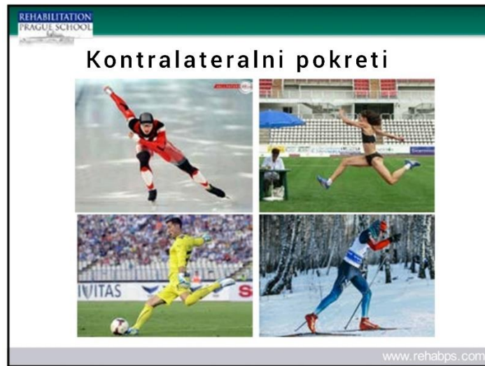
Slika 5. Kontralateralni pokreti

razvojne faze i pozicije tijela, koje se u DNS-u koriste kao testovi ili pozicije za vježbanje, također ih se naziva razvojnim pozicijama .