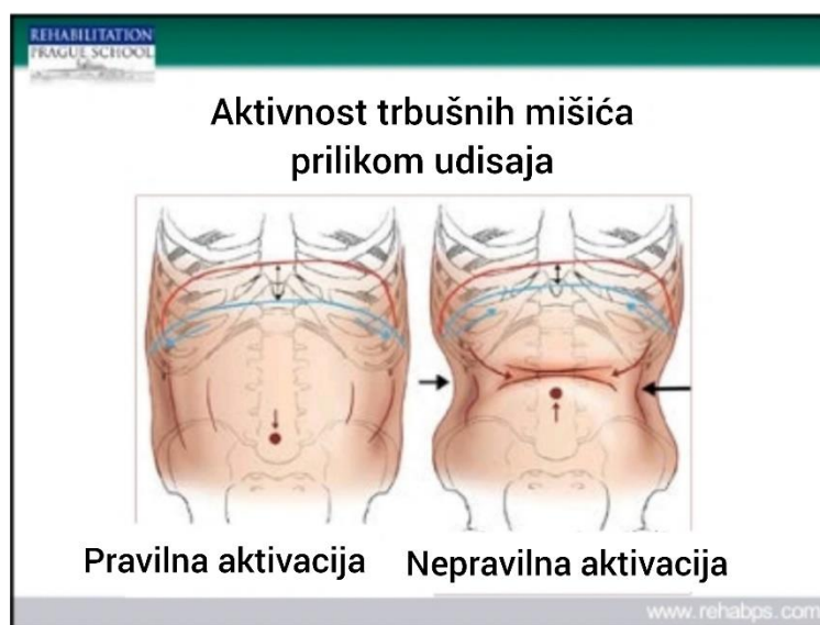
Slika 3. Aktivacija trbušnih mišića prilikom udisaja

Idealan, odnosno pravilan način disanja podrazumijeva depresiju dijafragme pri udisaju, koja svojom kretnjom stvara IAP u trbušnoj šupljini, transversus abdominis je u ekscentričnoj kontrakciji, a cijeli trbušni zid tvori kvalitetan i cilindričan oblik. Prilikom udisaja trup bi se trebao širiti sa svih strana, a ključne kosti i prsa ne bi smjeli ići u elevaciju, odnosno sagitalnu ekstenziju.