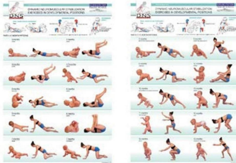
Slika 6. DNS razvojne faze