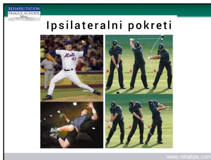
Slika 4. Ipsilateralni pokreti

tzv. homološki pokreti . To su kretne ekstremiteta u sagitalnoj ravnini, pokreti fleksije i ekstenzije u supiniranoj poziciji, a u proniranom položaju to su pozicije u kojima je oslonac na sva 4 ekstremiteta. Konačno, zadnja faza razvoja lokomotornog sustava je faza lokomocije . Kada dođe osmi mjesec života, dijete počinje pokazivati prve pokrete tranzicije i kretanja u prostoru. Kako bi iz supinirane pozicije došla u proniranu poziciju, beba vrši ipsilateralni pokret okretanja. Taj pokret specifičan je po tome što se zdjelica i rebra kreću u istom smjeru u transverzalnoj ravnini, odnosno smjer rotacije je isti. Potporna funkcija lokomocije je ista, odnosno ista ruka i noga rade potporu trupa, dok druga strana tijela, odnosno druga ruka i noga vrše dinamičku funkciju, pokret rotacije. Kroz cijelo vrijeme trajanja pokreta zdjelica i rebra ostaju paralelna i trup ne gubi svoju stabilnost. Primjer ipsilateralnih pokreta su: okretanje i ležeće pozicije, šutiranje lopte u rukometu, zamah u golfu, teniski udarac, udaranje ili bacanje lopte u bejzbolu.