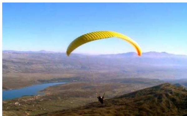
Slika 2. Paragliding u okolici Sinja

Za primorsku Hrvatsku značajna ponuda sportskog turizma jesu jedriličarske usluge, Bungee jumping, Rafting, Paragliding i dr. Kako bi se mogli organizirati natjecateljski sportovi u Republici Hrvatskoj nužan je određen stupanj raspoloživosti infrastrukture kojom bi se udovoljilo specifičnim zahtjevima.