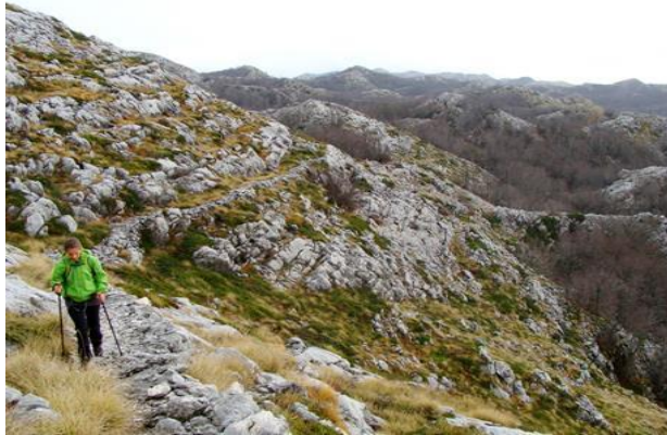
Slika 7. Planinarenje na Mosor

Planinarenje je također aktivnost koja je vrlo zastupljena u turističkoj ponudi. U parku prirode Biokovo održava se individualno i organizirano planinarenje gdje posjetitelji prema planinarsko-turističkoj karti obilaze više od 40 markiranih puteva i staza. Ponuda aktivnog odmora uključuje jahanje koje se veže uz područje Sinja, Splita i Triljagdje postoje konjički klubovi koji organiziraju jahanje za početnike ili rekreativno jahanje ( http://www.jutarnji.hr/arhiva/top-10-sportskih-aktivnosti-srednje-dalmacije/2115531/ ).