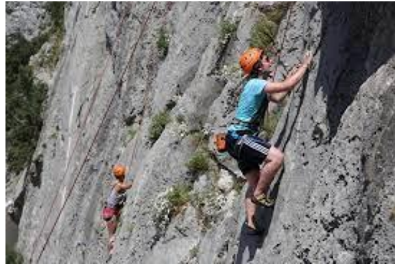
Slika 5. Sportsko penjalište Omiš

Jedno od najrazvijenijih područja slobodnog penjanja je Dalmacija. U Splitsko-dalmatinskoj županiji su najuređenija penjališta Hvar i Omiš. U Omišu se nalazi preko 140 uređenih smjerova, sportskih ili višedužinaca. Penjanje je omogućeno tijekom cijele godine. Penjalište se nalazi na obalama rijeke Cetine i vrlo je popularno ljeti. Omiš je jedno od najposjećenijih ljetnih penjališta. Uz penjalište se nalaze i neki drugi oblici sportskog turizma: zipline te kanjoning.