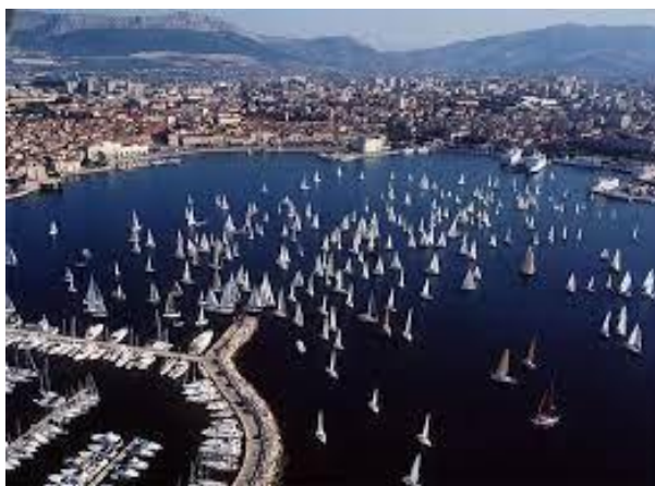
Slika 3. Mrdujska regata

Što se tiče ključnih sportskih događanja u primorskoj Hrvatskoj mogu se navesti prepoznatljivi sportski događaji koji privlače turiste iz cijelog svijeta. Svakako je prepoznatljivo i značajno održavanje jedne od najstarijih jedriličarskih regata u Europi Mrdujska regata. Zatim dva prepoznatljiva teniska turnira u Croatia open i Croatia Bol open.