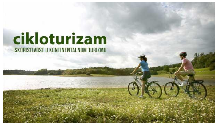
Slika 1. Cikloturizam u kontinentalnoj Hrvatskoj

Sportska događanja vezana uz kontinentalnu Hrvatsku su brojna, a jedno od značajnijih je Murska i Dravska biciklistička ruta koja već godinama privlači cikloturiste na višednevne vožnje od izvora do ušća tih dviju rijeka. Zatim prepoznatljiv sportski događaj koji privlači posjetitelje iz inozemstva je Pannonian Challenge. To je najveće hrvatsko natjecanje u ekstremnim sportovima. U kontinentalnoj Hrvatskoj je održana treća etapa Svjetskog prvenstva u Relliju u Zagrebu te Svjetski kup u gimnastici koji se održava već 10 godina u Osijeku. Napredak u vidu sportskog turizma na kontinentu trebao bi biti od najvećeg značaja jer i sam sport se svakodnevno razvija i postaje sve popularniji.