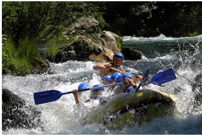
Slika 4. Rafting na Cetini

U Splitsko-dalmatinskoj županiji se može izdvojiti niz poznatih sportaša koji su postigli svjetski uspjeh. Uspješni sportaši su iz raznih sportova kao što je nogomet, plivanje, atletičari, tenisači, veslači, košarkaši i jedriličari. Splitsko-dalmatinska županija ima velike predispozicije za sportske pripreme sa sportskim sadržajima u većim hotelskim naseljima. Splitsko-dalmatinska županija je izuzetno povoljno područje za spoj turizma i sporta. Rafting na Cetini je prepoznatljiva sportsko-turistička ponuda u Splitsko-dalmatinskoj županiji. Traje tri do četiri sata dugo rafting putovanje kroz 12 kilometara dugog dijela staze Cetina.