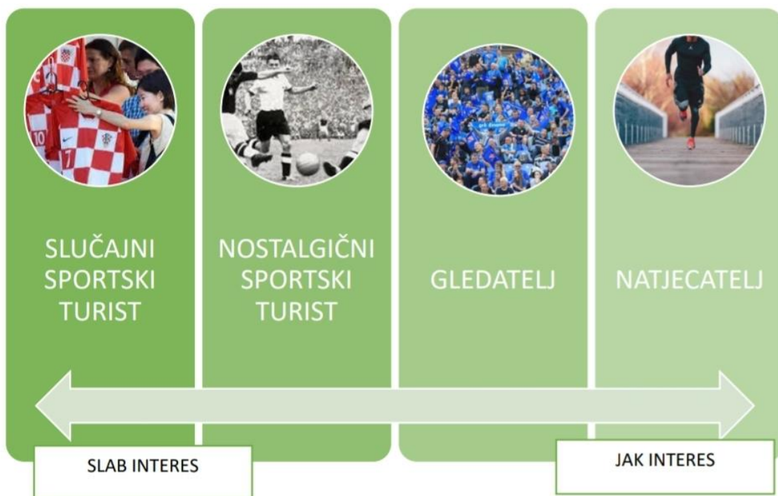
Slika 1. Distribucija turista prema intenzitetu korisnika usluga sportskog turizma (preuzeto od Jovanović, 2015)