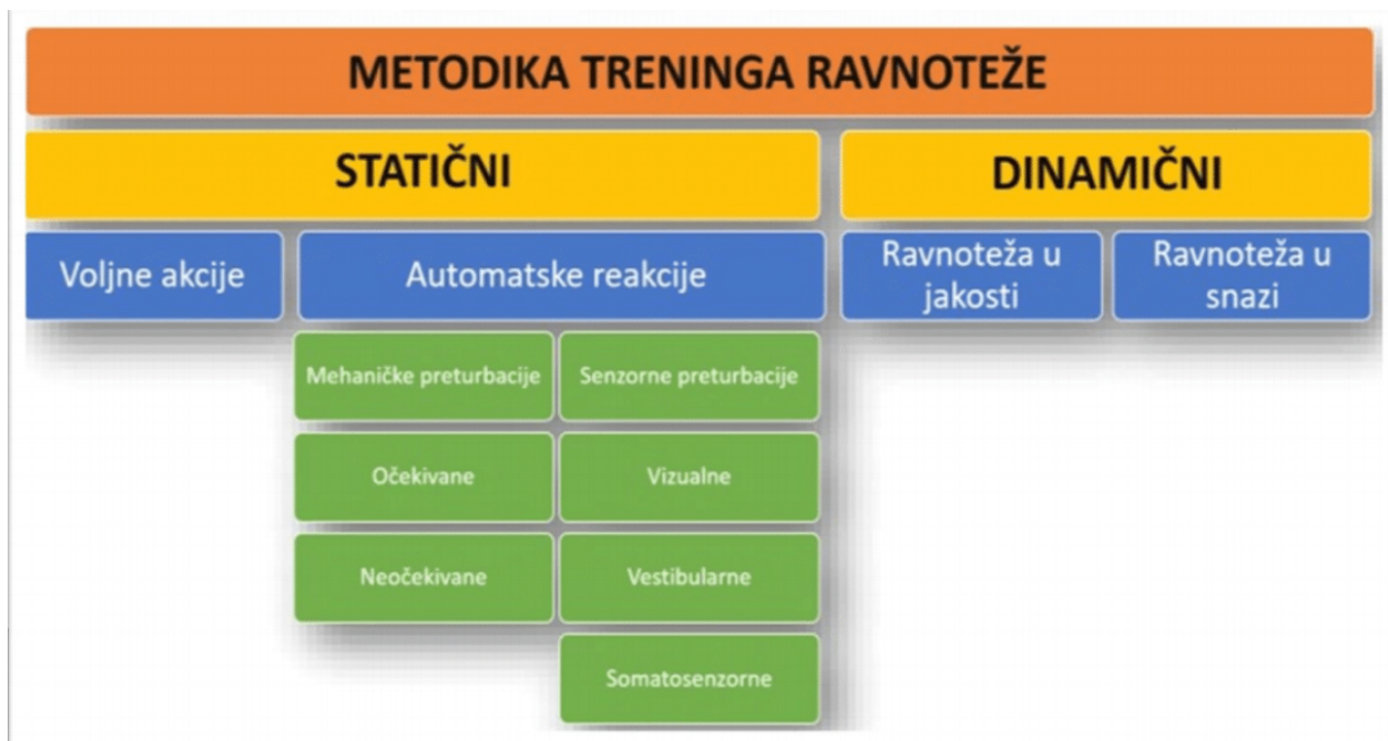
Slika 13. Metodika treninga ravnoteže

Vježbe proprioceptije i ravnoteže krojimo kroz navedenu tablicu: najprije krećemo od jednostavnijih prema kompleksnijim, te od statičkih prema dinamičkim.