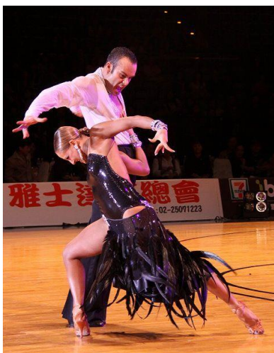
10.Slika: Paso doble