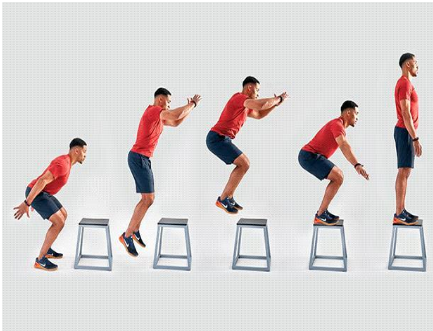
Slika 3. Pliometrijski skokovi

Pliometrijski treninzi su raznoliki te se mogu odrađivati u dvoranama ili na otvorenom. Prednost pliometrijskog treninga je i taj što ne zahtjeva puno opreme (štapovi, kutije, prepone, medicinke) (Donald A. Chu, 1992.).