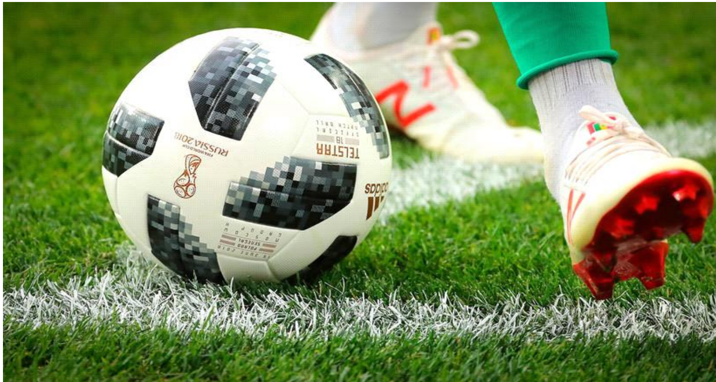
Slika 1. Nogomet