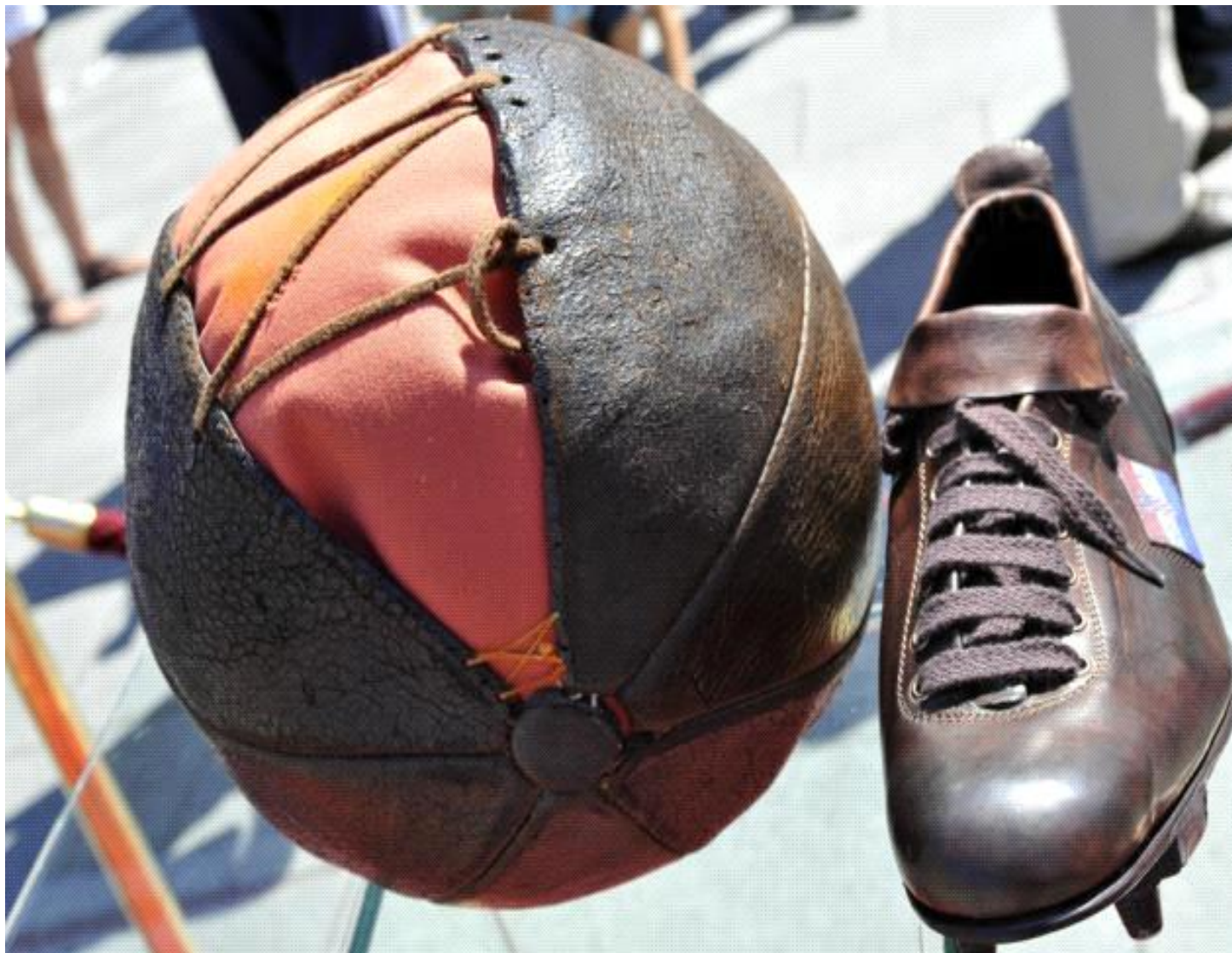
Slika 2. Prva nogometna lopta u Hrvatskoj