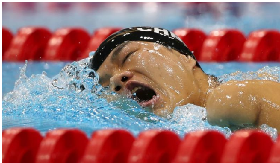
Slika 1. Primjer fizičkog oštećenja

Svjetsko para plivanje služi za tri skupine oštećenja - fizičko, intelektualno i vidno.