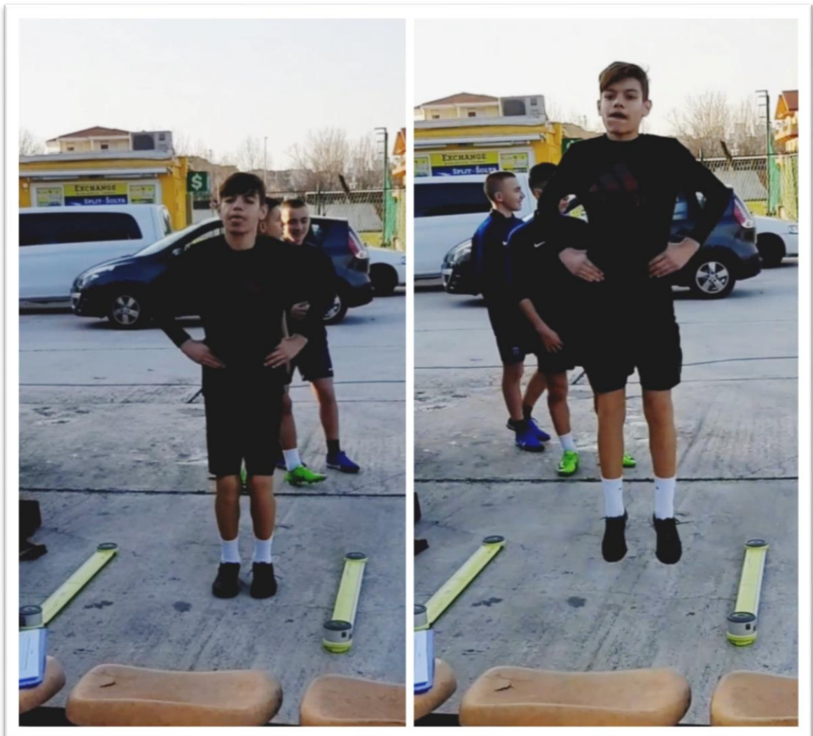
Slika 1. skok nasuprotnim kretanjem

Statička ravnoteža (OI) – test se izvodi na platformi za ravnotežu ( Biodex Balance System ). Test je konstruiran tako da procjenjuje ispitanikovu sposobnost zadržavanja i održavanja centra težišta. Rezultati na testu procjenjuju udaljenost od centra koji je