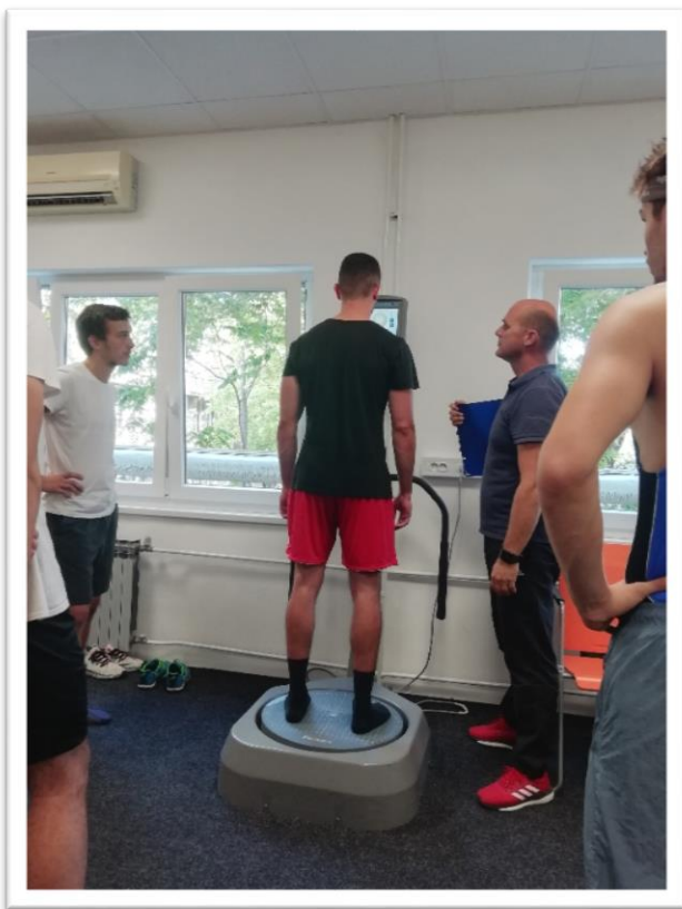
Slika 2. Izvođenje testa statičke ravnoteže na Biodex mašini

Osmica sagibanjem (8SAGIBANJEM) - mjerio se u dvorani sa podlogom koja je prethodno očišćena kako se ispitanici ne bi poskliznuli tijekom izvođenja testa. Dva stalka su postavljena na razmaku od 4 metra i između njih je rastegnuta elastična traka. Visina trake je korigirana za svakog ispitanika a mjera je bila visina kuka. Početni položaj je visoki start. Zadatak se sastojao od najbržeg mogućeg kretanja ispitanika između stalaka u obliku broja osam. Prilikom svakog zaobilaženja stalka ispitanik se morao provući ispod elastične trake. Test završava kada ispitanik napravi 4 ciklusa i prijeđe preko startne/ciljne crte. Test se ponavlja 3 puta sa minimalnim vremenskim odmorom od 3