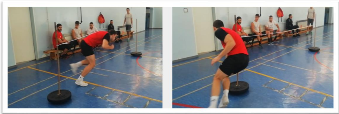
Slika 3. Izvođenje testa osmica sagibanjem

Test specifične skakačke agilnosti za skijanje (SJS 15-23) – na ravnoj podlozi postavljeno je jedanaest (11) prepona. Prepone su postavljene tako da ih ispitanik preskače prema naprijed i u stranu. Povezane su u poligon u kojem su poprečne prepone više (23cm) a uzdužne niže (15cm). Poprečne prepone postavljaju se nakon svake uzdužne sa svake strane naizmjenice. Na početku testa ispitanik stoji sa dvije noge na podlozi i sam bira prvi skok. U trenutku njegovog prvog doskoka i kontakta sa podlogom, mjeritelj uključuje štopericu. Kreće se sa poprečnim skokom. Ukupno ispitanik izvodi šest skokova u vis i pet lateralnih skokova od čega tri s lijeva na desno i dva s desna na lijevo. Test završava u trenutku kada ispitanik preskoči zadnju poprečnu preponu i dotakne podlogu. Također za potrebe ove studije test se izvodio lijevom (SJS 15-23-L), desnom (SJS 15-23-D) i s obje noge (SJS 15-23 S). Test se izvodi tri puta. Prema mišljenju autora test bi trebao procjenjivati kombinaciju specifičnih skijaških sposobnosti – koordinacije, ravnoteže i agilnosti.