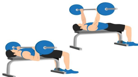
Slika 4: Izvođenje potiska s klupice

Test snage gornjeg dijela tijela će biti potisak s klupice sa šipkom. Ilustracija izvođenja potiska s klupice je prikazana na slici 4. Ova vježba se izvodi ležeći na klupici s tjelesnim kontaktom glave, ramena, stražnjice i stopala. Ovisno o ugodnosti, sudionik hvata šipku otprilike šire od širine ramena te ravnih laktova. Potom šipku odvaja od držača te prinosi iznad razine prsnog koša. Nadalje, savijanjem u zglobu lakta te retrofleksijom ramenog zgloba šipku spušta do kontakta s prsnim košom. Nakon ostvarenog kontakta sa prsima, sudionik gura šipku ekstenzijom lakta i antefleksijom ramena prema početnoj poziciji. Agonist u ovoj vježbi jest m. pectoralis major, a sinergisti m. triceps brachii i m. deltoideus. Ulogu stabilizatora imaju m. erector spinae te m. latissimus dorsi.