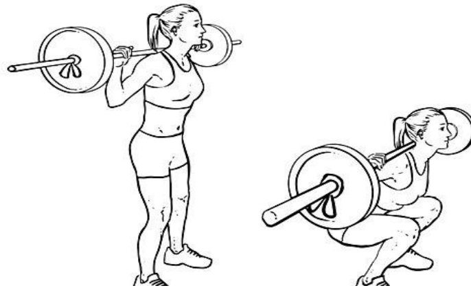
Slika 3: Izvođenje čučnja