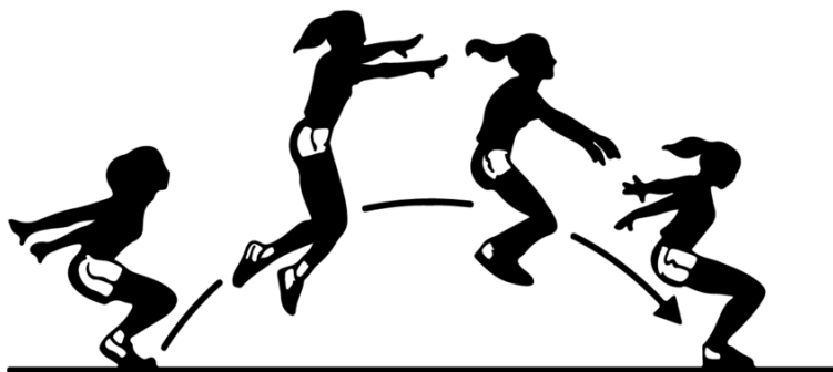
Slika 1: Izvođenje skoka u dalj