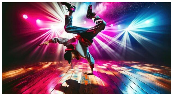
Slika 5. Dance Battle

Konačno, kreativnost i izražavanje u urbanim plesovima omogućuju plesačima da transcendiraju tehniku i učine ples sredstvom osobnog izraza i umjetničke komunikacije.