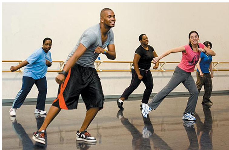
Slika 2. Kondicijski plesni trening

Plesni treninzi: Integracija plesnih rutina s fokusom na održavanje visoke razine intenziteta, što pomaže u izgradnji kondicije specifične za ples.