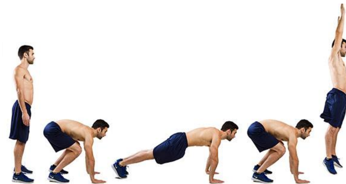
Slika 4. Pliometrijske vježbe

Pliometrijski treninzi: Ovi treninzi uključuju eksplozivne pokrete koji pomažu u razvoju moći, kao što su skokovi, sprintovi i brze promjene smjera.