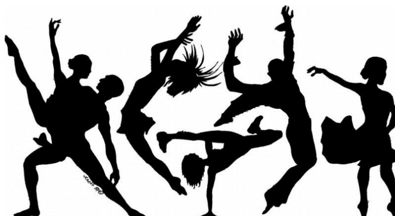
Slika 1. Plesne figure

Kroz ovo istraživanje, očekuje se doprinijeti boljem razumijevanju izazova i mogućnosti s kojima se plesači suočavaju, kao i pružiti smjernice za daljnji razvoj i unapređenje praksi u urbanim plesovima. S obzirom na rastuću popularnost urbanih plesova i njihov utjecaj na kulturu mladih, razumijevanje funkcionalnih sposobnosti i njihovog razvoja postaje ključno za osiguranje zdravlja i uspjeha plesača u ovoj dinamičnoj umjetničkoj formi.