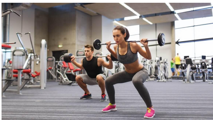
Slika 3. Trening snage

Treninzi snage: Plesači mogu koristiti vlastitu tjelesnu težinu ili dodatne utege za poboljšanje snage. Uključujući vježbe poput čučnjeva, sklekova i mrtvog dizanja, treninzi mogu razviti ključne mišićne skupine.