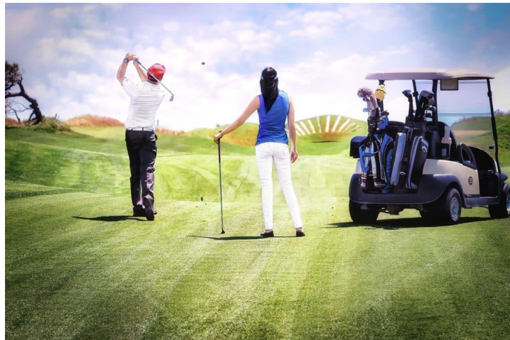
Slika 6. Golf kao sportsko-rekreacijska aktivnost niskog intenziteta