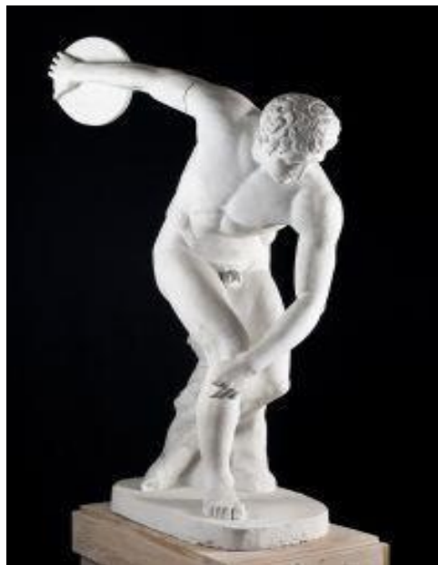
Slika 1. "Diskobol", Miron, 450.g.pr.Kr., Rim

odnosno borilišta s gledalištem iz razdoblja kretske kulture.“ ( https://www.enciklopedija.hr/clanak/sport ; 2.9.2024.). Takva borilišta izgledala su poput arena i na njima su se održavala razna natjecanja. Grci su sportske aktivnosti pretvorili u sastavni dio plemenskih i vjerskih svečanosti te su počeli održavati olimpijske igre, koje i danas postoje. Na tim olimpijskim igrama već su postojali i različiti predmeti, poput štapa, lopte i drugih pa su se sportovi polako počeli klasificirati.