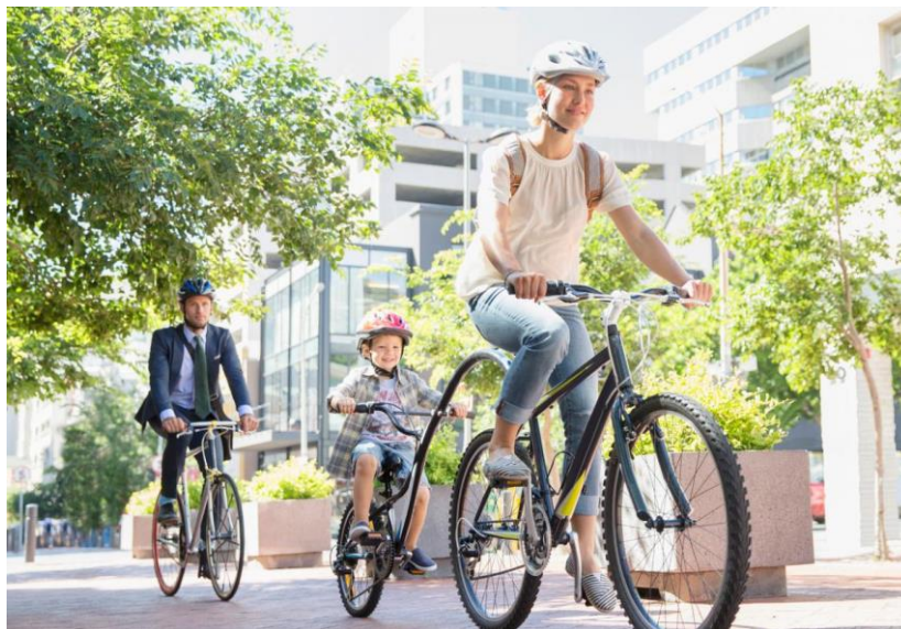
Slika 2. Bicikliranje kao ciklička aktivnost

Izvor: https://stampar.hr/hr/dogadanja/bicikliranje-aktivnost-koja-pozitivno-utjece-na-mentalno-i-fizicko-zdravlje (6.9.2024.)