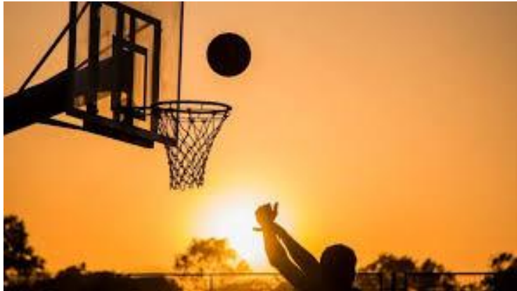
Slika 3. Košarka kao sportska igra loptom