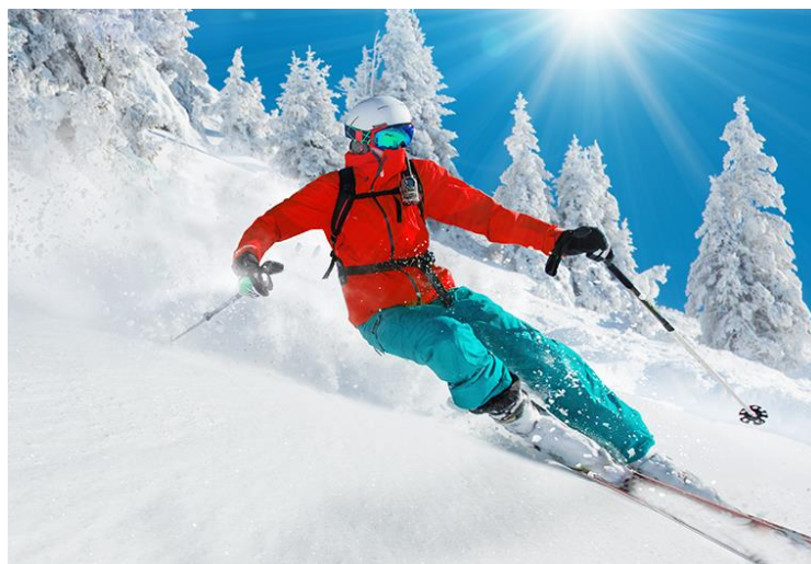
Slika 5. Skijanje kao sezonska sportska aktivnost