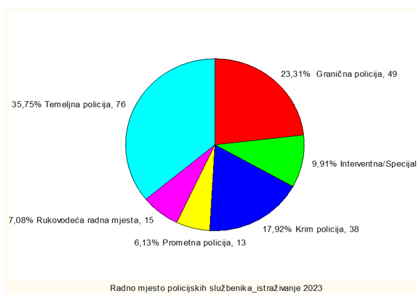
Graf 1. Radna mjesta policijskih službenika uključenih u ovo istraživanje

S obzirom na vrstu policijske organizacije, najveći broj policijskih službenika, njih 76 ili 35,75%, pripada Temeljnoj policiji ; zatim 49 ili 23,31% policijskih službenika, zaposleni su na radnom mjestu u Graničnoj policiji ; službenika Krim policije ukupno je 38 ispitanika ili 17,92%; predstavnika Interventne/Specijalne policije koji su obuhvaćeni ovim istraživanjem je 21 ili 9,91% ukupnog uzorka; dok najmanji broj policijskih službenika, njih 13 ili 6,13% pripada Prometnoj policiji , odnosno 15 policijskih službenika ili 7,08% obavljaju neki od Rukovodećih radnih mjesta (Graf 1).