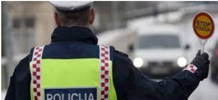
Slika 1. Prometni policajac

Ovim odlomkom Lauš zapravo usmjerava na problem sa tjelesnom aktivnosti kod policijskih službenika bilo da se očekuje veća aktivnost tokom ili održavanje tjelesne aktivnosti poslije radnog vremena. Policijski službenici bi trebali shvatiti problematiku koju donosi ovo poražavajuće istraživanje te bi isti morali podići svijest o svojoj tjelesnoj aktivnosti, a s time i koliko to utječe na unaprjeđenje zdravlja. ( https://danas.hr/hrvatska/hrvatski-policajci-cak-6-sati-na-dan-provedu-sjedeci-trecina-ne-odradi-ni-dva-umjerena-treninga-tjedno-62bf6e4c-b9f3-11ec-b8f3-0242ac12003c )