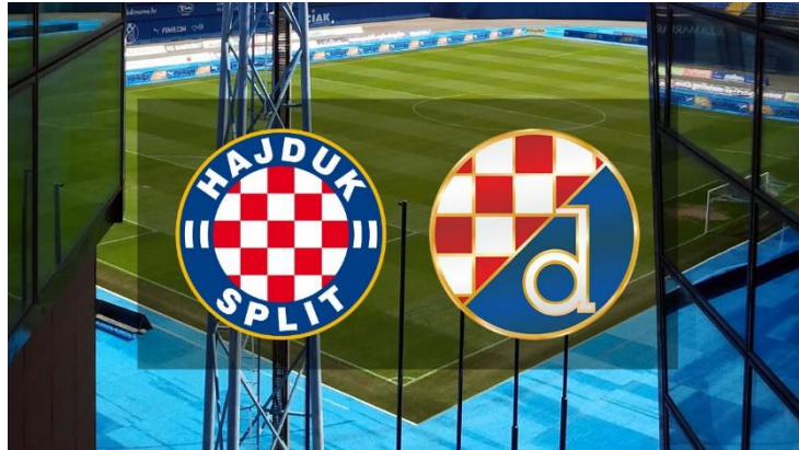
Slika 11. – Grbovi Hajduka i Dinama, najvećih hrvatskih klubova (dostupno na https://www.zgportal.com/zgviijesti/dinamo-i-hajduk-igraju-novi-vjecni-derbi-gdje-gledati-utakmicu-22-kola/ )

Najviše pažnje pobuđuje “derbi vječitih rivala” Dinama i Hajduka, no posljednjih godina stvorila su se još neka rivalstva koja uključuju Rijeku i Osijek.