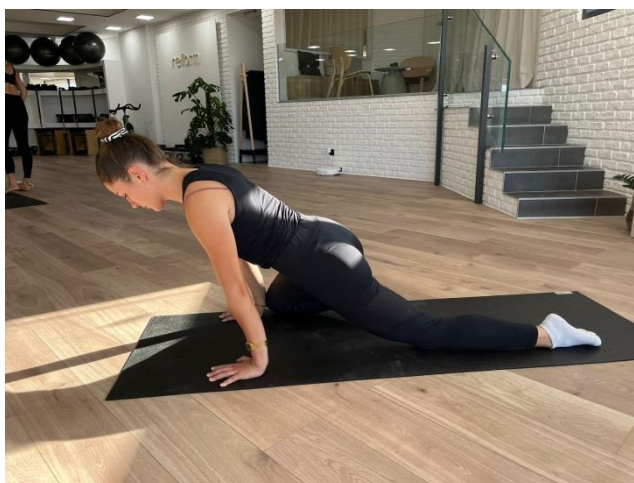
Slika 5. Početak vježbe