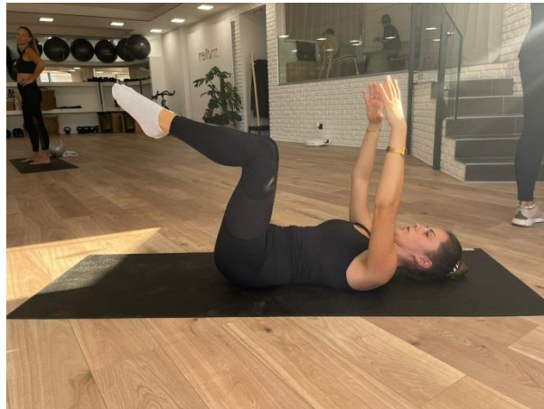
Slika 8. Početni položaj

Početni položaj: Izvodi se u ležećem položaju, ruke su u predručenju tako da su dlanovi iznad ramena. Noge su u zraku u fleksiji. Donji dio leđa čvrsto je postavljen na podlogu.