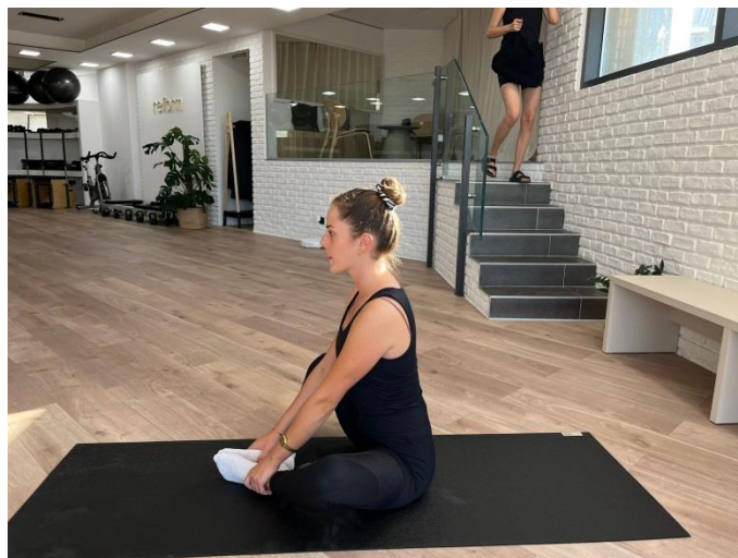
Slika 2. Početni položaj

Početni položaj: Sjesti s uspravnim položajem leđa, privući noge prema sebi, ne preblizu niti predaleko, spojiti stopala.