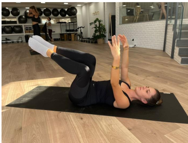
Slika 9. Početak vježbe

Početni položaj: Izvodi se u ležećem položaju, ruke su u predručenju tako da su dlanovi iznad ramena. Noge su u zraku u fleksiji. Donji dio leđa čvrsto je postavljen na podlogu.