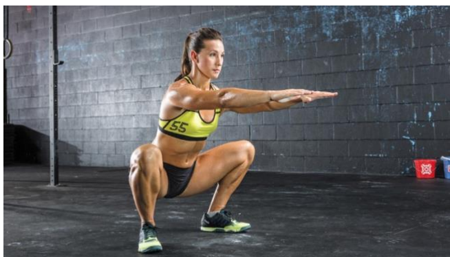
Slika 4. Čučnjevi s predručenjem