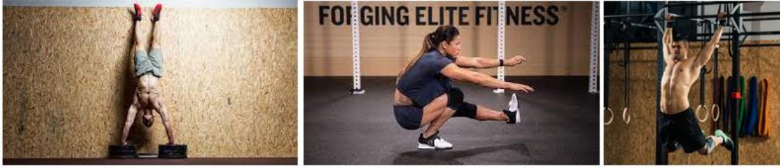
Slika 1. Mary WOD: sklekovi u stoju na rukama, jednonožni čučanj i zgibovi