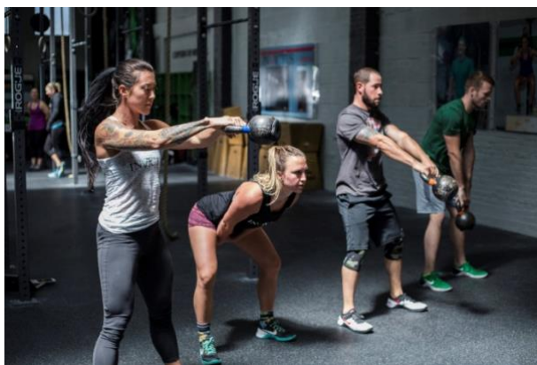
Slika 3. Zamah s girjom