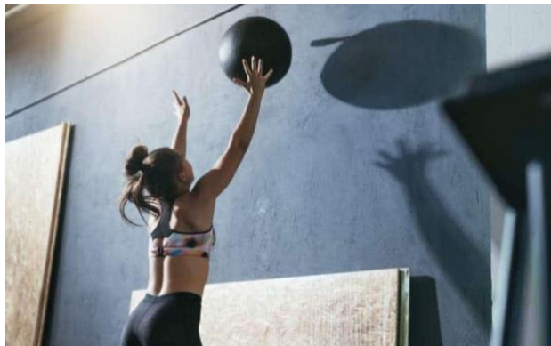
Slika 2. Wall Ball vježba.

Još jednostavnije od Frana, postoji samo jedna vježba u Karen WOD-u. Nažalost, ta vježba su wall balls, a cilj je napraviti ih 150 što brže. Vježba se radi s medicinkom od 9kg koju je potrebno na zid baciti iznad oznake.