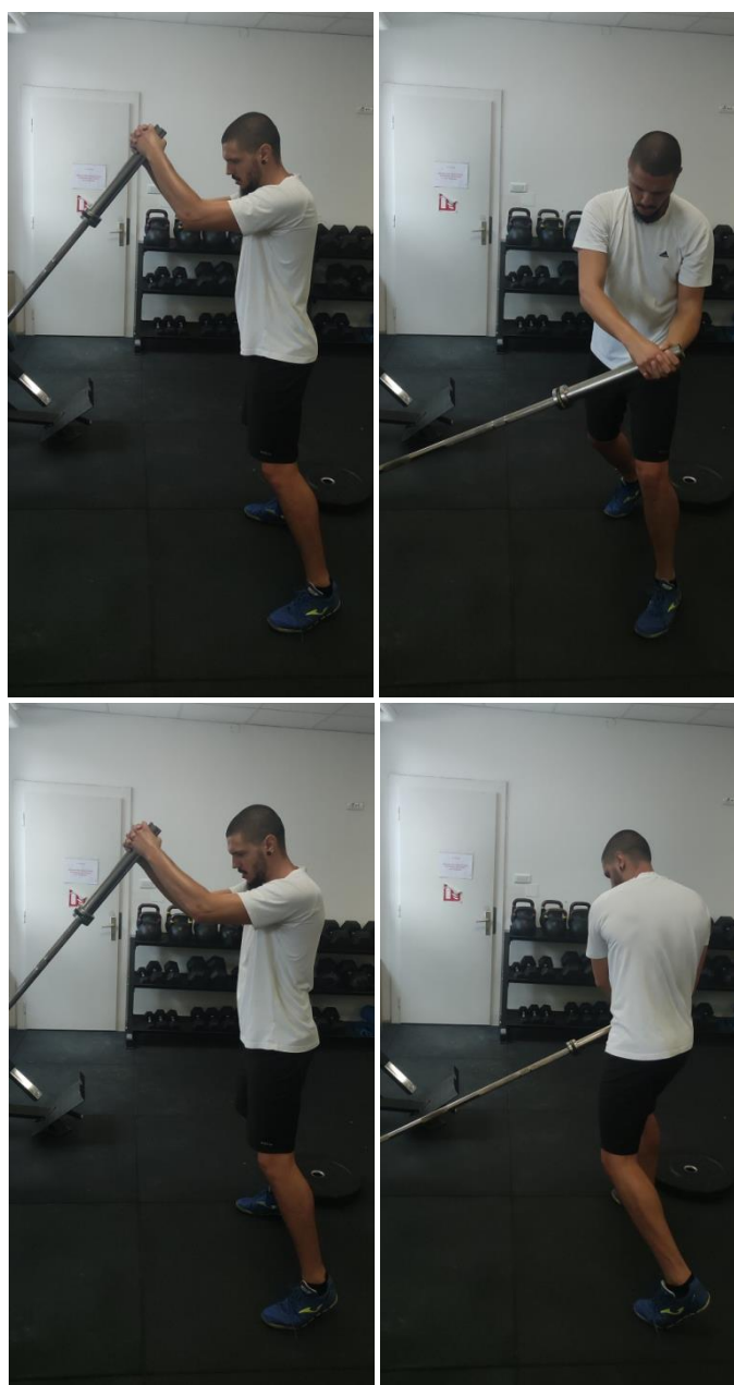
Slika 6. Landmine wiper

Napomena: vježbe se izvode naizmjenično s minimalnom pauzom između vježbi.