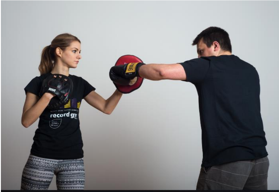
Slika 5 Bočni udarac u boksu- kroše