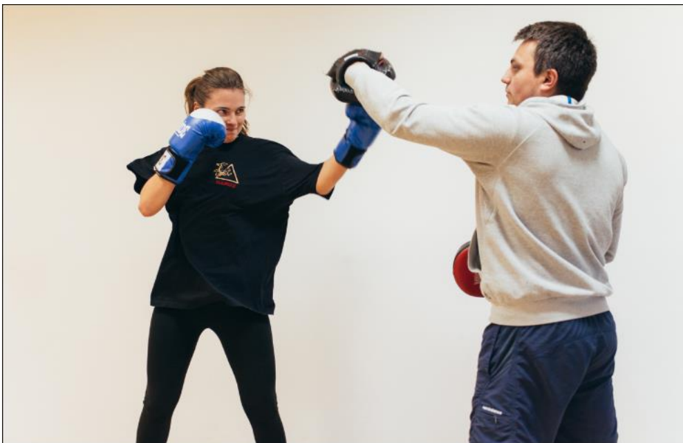
Slika 6 Vertikalni udarac u boksu- aperkat