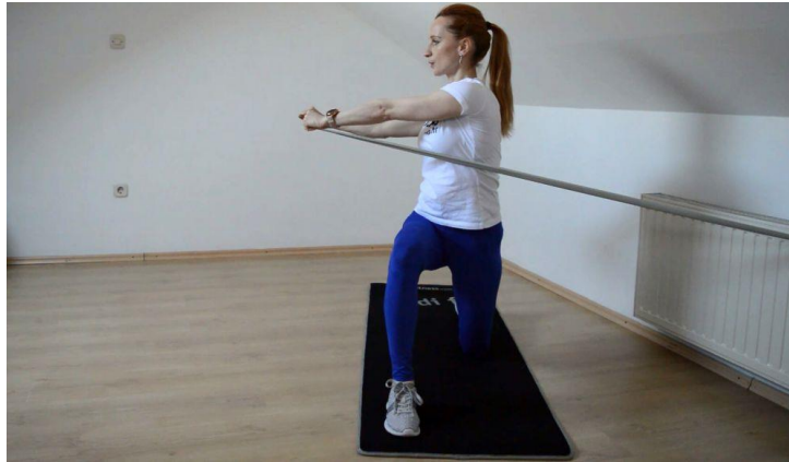
Sl. br. 7: Vježba za jačanje bočnih mišića trbuha