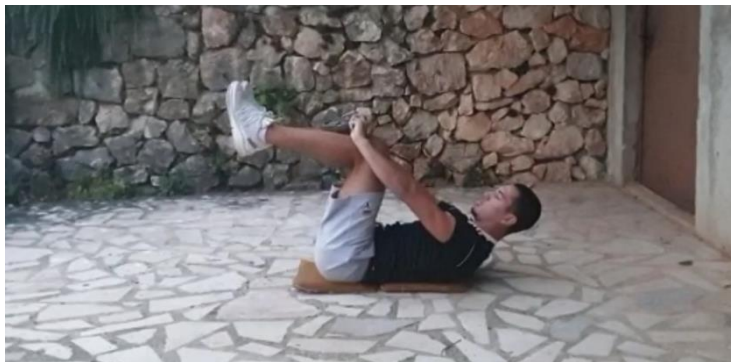
Šesta vježba- Aktivacija mišića gornjeg dijela tijela (8 ponavljanja)