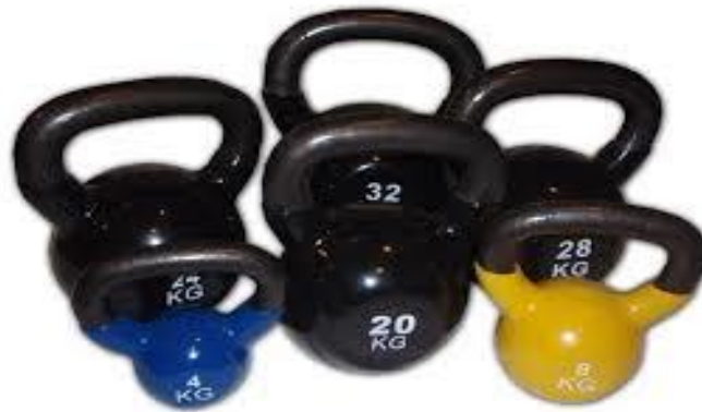
Sl. b. 13: Girje za vježbanje