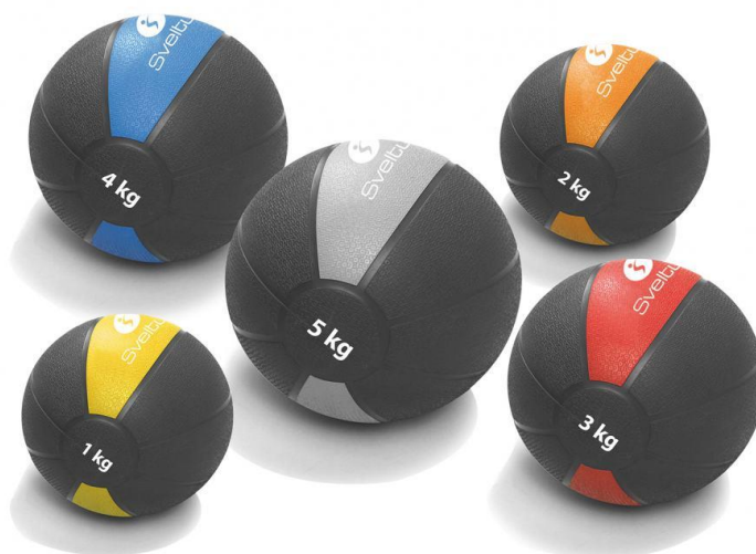
Sl. br. 10: Medicinke za vježbanje