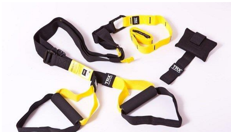
Sl. br. 9: TRX trake za vježbanje