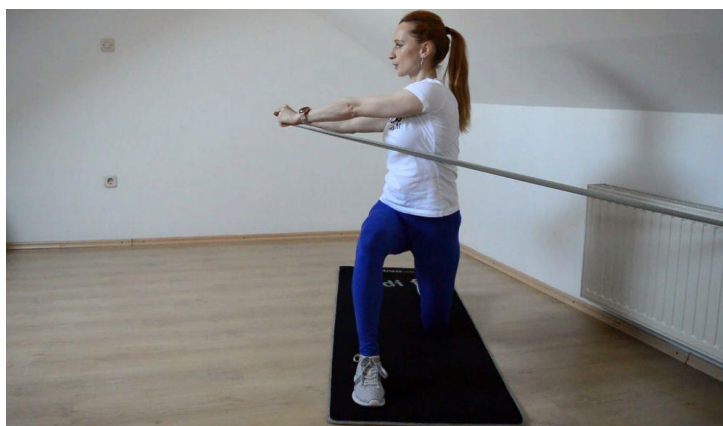
Sl. br. 7: Vježba za jačanje bočnih mišića trbuha