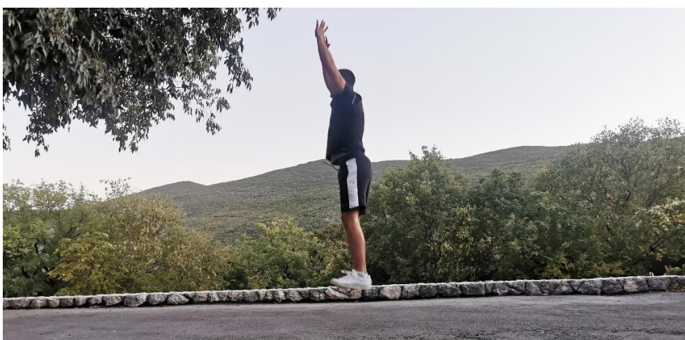
Šesta postaja- Zgib (5-8 ponavljanja/početnici rade s osloncem)