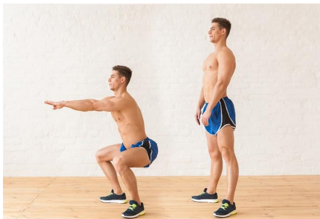
Sl.br. 3: Vježba snage za m. quadriceps femoris