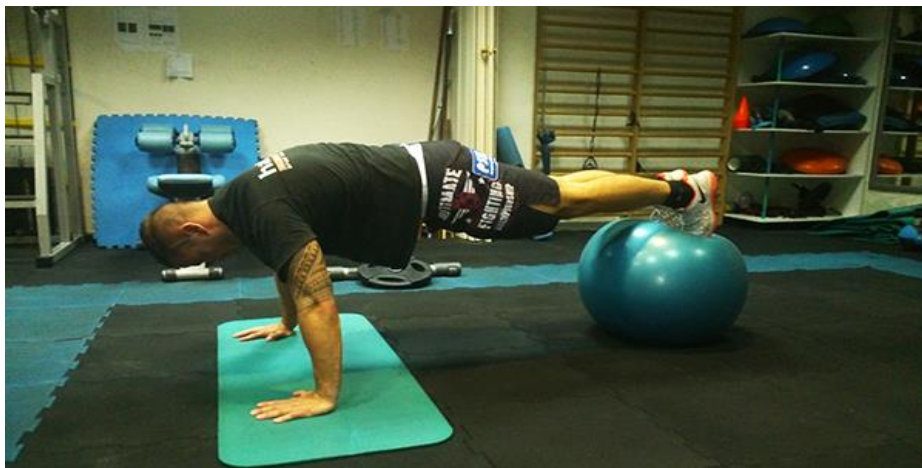
Sl. br. 1: Vježba za aktivaciju mišića trupa

Sam funkcionalni trening aktivira više mišića, mišićnih skupina i zglobova te ima cilj uskladiti mišiće u jednu cjelinu kako bi zajedničkim djelovanjem u svakodnevnim aktivnostima (koje uključuju višeravninske i višezglobne dinamičke obrasce) stabilizirali tijelo, smanjili rizik od ozljede, olakšali svakodnevnu aktivnost te poboljšali samu kvalitetu života. S obzirom da koristi različite mišiće iz više mišićnih skupina, funkcionalni trening stavlja naglasak na mišiće trupa i stabilnost koju oni daju cijelom tijelu. Znači međusobna suradnja cora i neuromuskularne funkcije, zahtjevni trening stabilnosti, snage i propriocepcije daje značajni napredak u izvršavanju učinkovitije i sigurnije kretnje. Stoga se smatra najkompletnijim načinom treniranja jer njegovim djelovanjem se utječe na svim bitnim značajkama kao što su; snaga, eksplozivnost, brzina, izdržljivost, kondicija. Funkcionalnim treningom se također koriste i sportaši kako bi poboljšali performanse u matičnom sportu, a njegova individualizacija i prilagodba pojedinačnim potrebama i karakteristikama, garantira učinkovitost i povećanje ukupne funkcionalnosti.