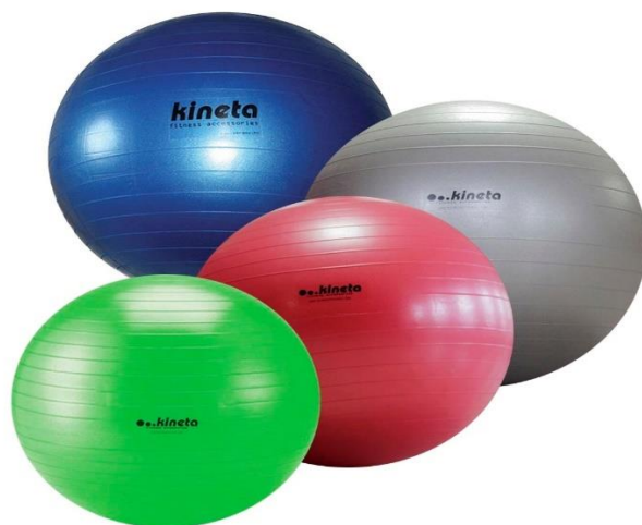
Sl. br. 11: Pilates lopte za vježbanje