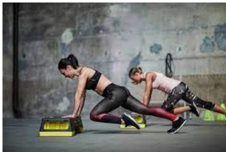
Sl. br. 14: Kompleksna vježba za cijelo tijelo

Uzimajući u obzir dobrobiti funkcionalnog treninga kao i njegovu filozofiju usmjerenu na specifičnosti, nije potrebna bujna mašta da bi se shvatile njegove prednosti. Funkcionalni trening se može usredotočiti i unaprijediti bilo koju sportsku vještinu kao i svakodnevni život.