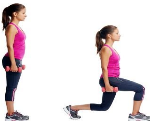
Sl. br. 4: Vježba snage za mišiće nogu i glutealnu regiju