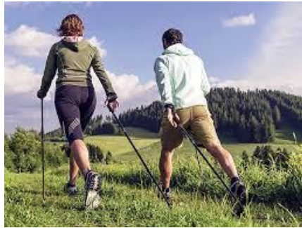
Sl.br. 2: Nordijsko hodanje

obilježja: tjelesne sposobnosti, psihološkog zadovoljstva, emotivnog zadovoljstva, socijalizacije, duhovnog ispunjenja, intelektualnih spoznaja, kreativnog poticaja, povećanje motivacije, doživljaja radosti, povećanje životnog elana, realizacije osobnih ciljeva i sl.