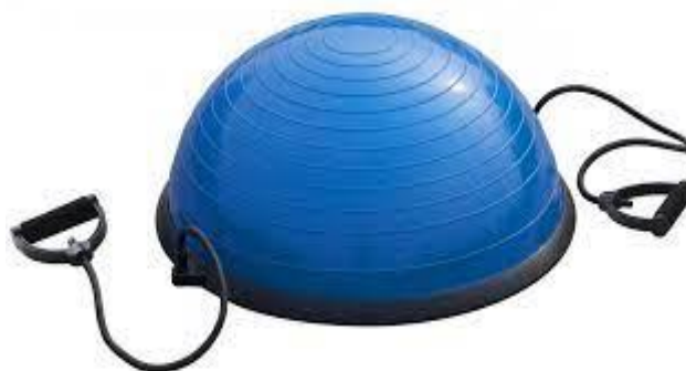
Sl. br. 12: Bosu(balans) lopta za vježbanje