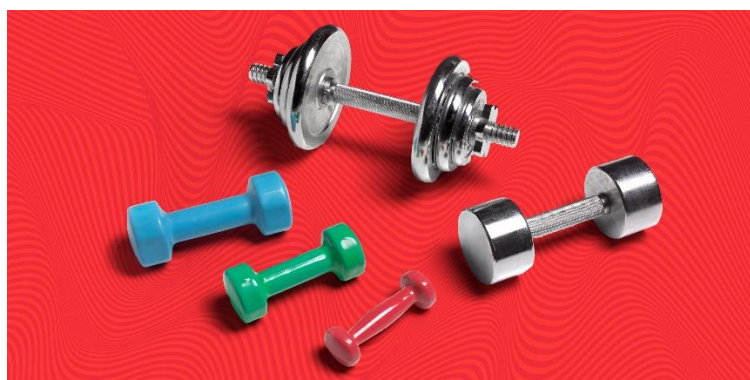
Sl. br. 8: Utezi za vježbanje